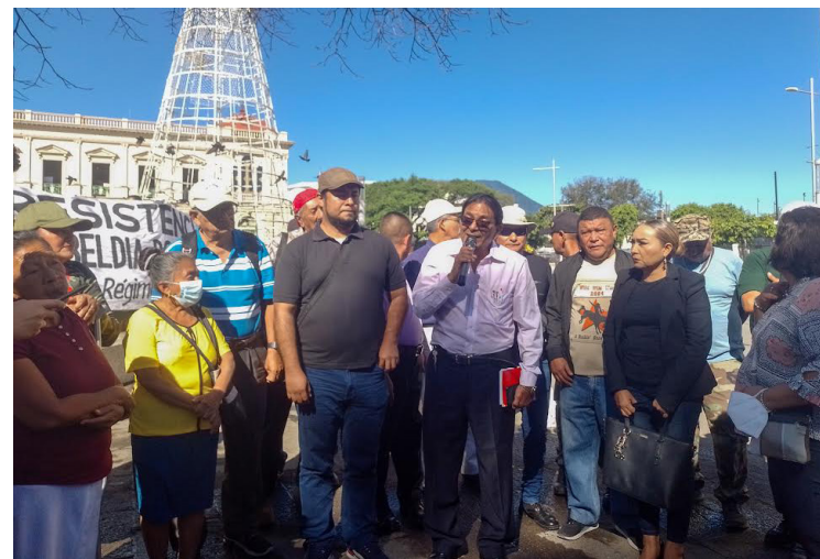
Las organizaciones civiles instan a la población salvadoreña a manifestarse este 15 de enero, en conmemoración de la firma de los Acuerdos de Paz y en lucha por la reivindicación de los derechos humanos.

“Saldremos a las calles a manifestarnos, a repudiar, a rechazar todo este tipo de medidas que están sometiendo al pueblo salvadoreño, que están arrebatando los derechos conquistados de la clase trabajadora. Salgamos a la calle a exigir nuestros derechos, a exigir una mejor pensión, a exigir los derechos conquistados. No podemos seguir callando, porque si callamos somos cómplices de todas las me-