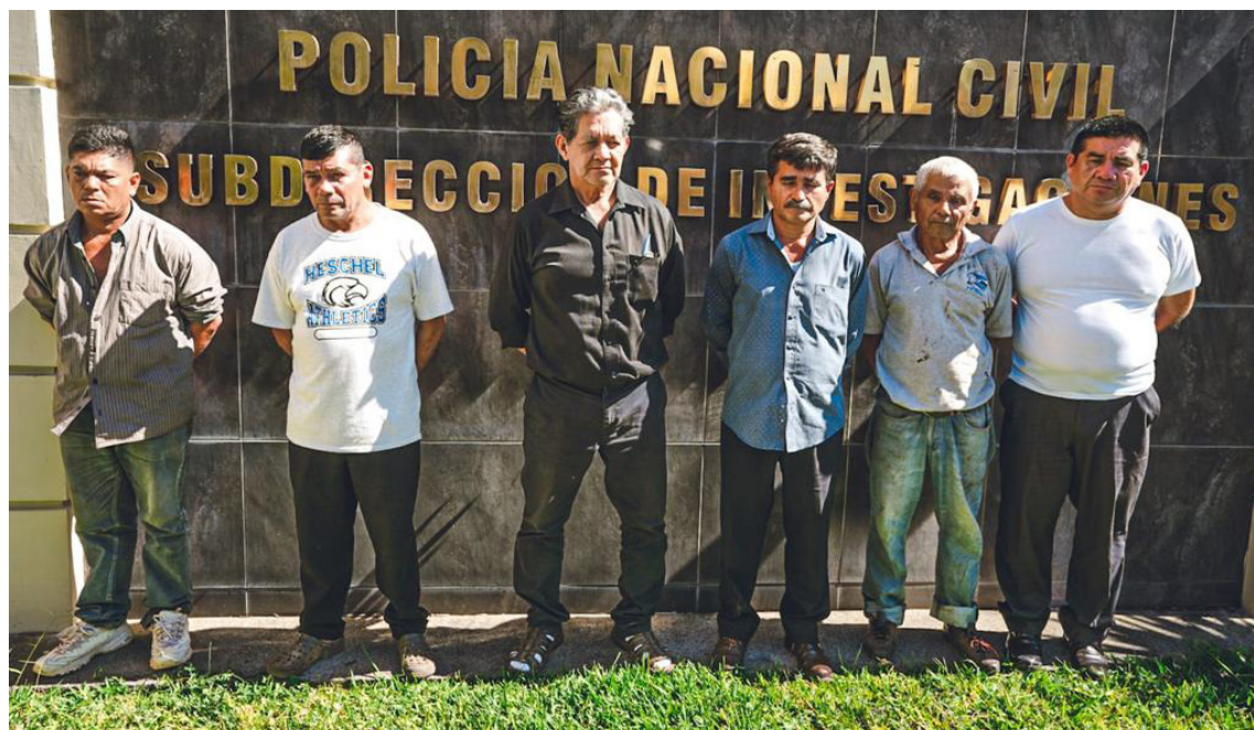
La Fiscalía General de la República (FGR) y la Policía Nacional Civil (PNC), realizaron el allanamiento de los hogares y detención de cinco personas que pertenecen a la directiva de ADES y la comunidad Santa Marta, acusados de un hecho ocurrido en 1989, durante el conflicto armado de los años ochenta.

“Exigimos cuanto antes la liberación de nuestros compañeros y líderes comunitarios, así como el cese de acciones de persecución y represión contra la organización popular”, reiteró la Mesa en su comunicado.