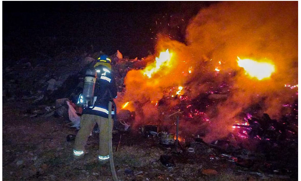
En los últimos días Bomberos ha reportado varios incendios en diferentes puntos del país, especialmente en predios de maleza seca.