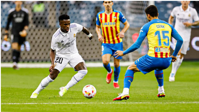
El Real Madrid podría enfrentarse al Barcelona en la final de la Supercopa de España, donde intentará defender su título.