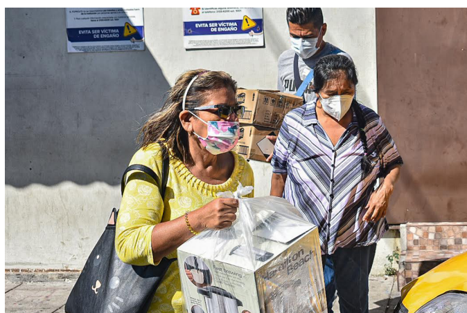
Algunos trabajadores que si pudieron ingresar sacaron sus pertenencias. Sin embargo, no a todos se les permitió el ingreso.