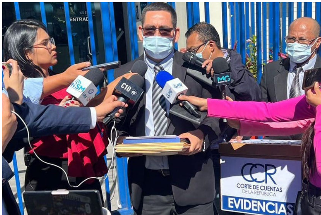
La Corte de Cuentas presenta ante la FGR ocho avisos por posible cometimiento de ilícitos, en el uso de recursos públicos asignados a igual número de municipalidades.

Los trabajadores del área de desechos sólidos de la alcaldía de Soyapango, han denunciado des-