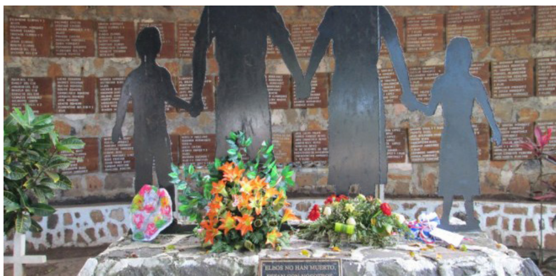
El caso del Mozote se abre en el año 2016, luego de la derogatoria de la Ley de Amnistía (1993), ha generado alrededor de 80 mil páginas de pruebas testimoniales, científico-forenses y periciales.

renovado sentimiento de esperanza a la justicia para las víctimas, y que concretó el Juzgado de Segunda Instancia de San Francisco Gotera Morazán, en