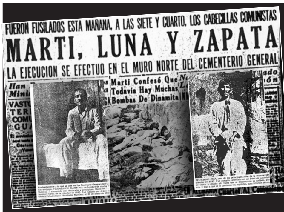
Composición tomada de imágenes de la Prensa Gráfica.

La figura de Farabundo Martí, más que la de cualquier otro dirigente co-