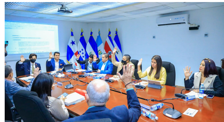
Comisión de Economía de la Asamblea Legislativa.

Es una representación digital que puede almacenarse y transferirse electrónicamente, utilizando un sistema de Tecnología de Registro Distribuida o tecnología si-