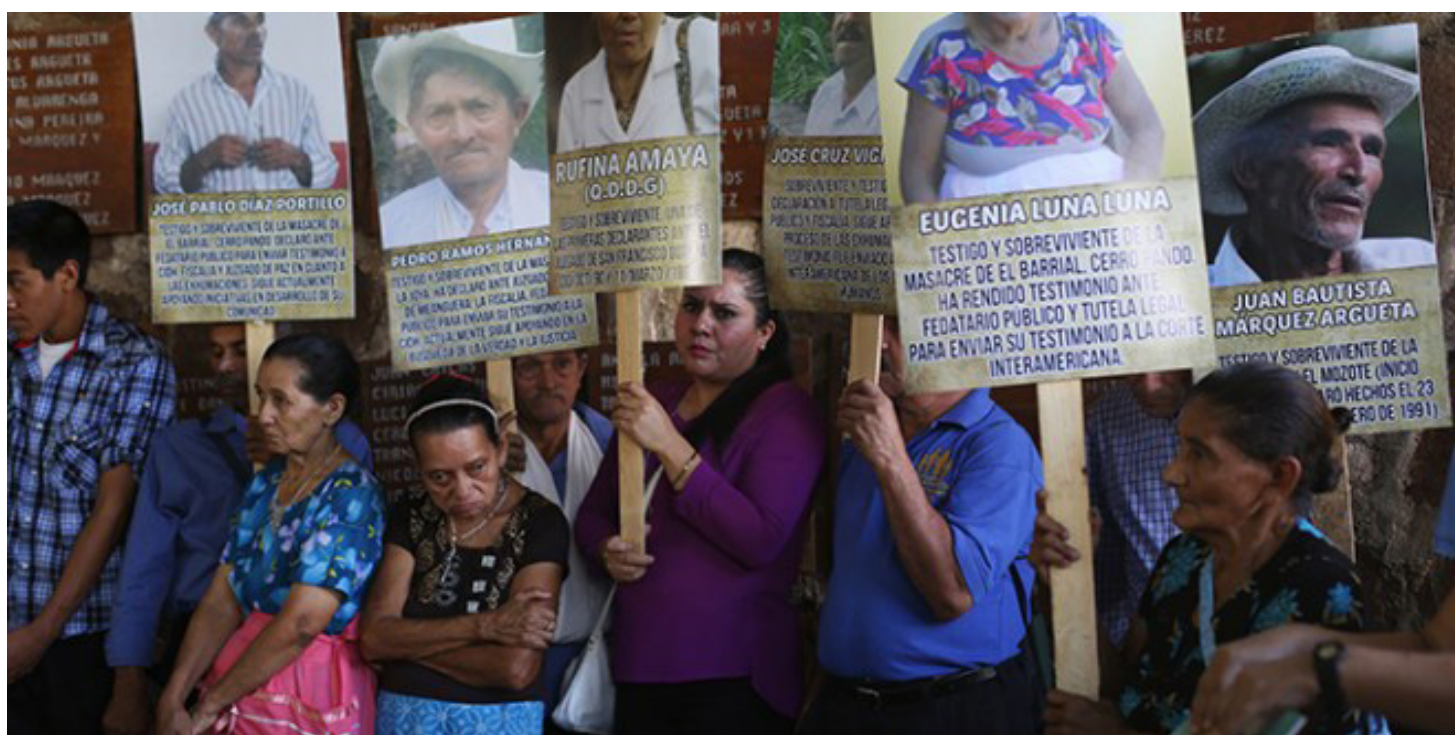
Los sobrevivientes y familiares de las víctimas, iniciaron su peregrinaje por justicia y reparación desde el año 1990.

“Consideramos que solo significa que la línea estatal y el ejército han hecho un pacto y, es no dejar que estos casos (Memoria Histórica) tengan justicia y mucho menos la verdad de estos trágicos eventos. ¿Qué nos queda?, luchar porque siempre habrá este tipo de tácticas, solo queda estar preparados para lo que pueda suceder”, puntualizó Díaz.