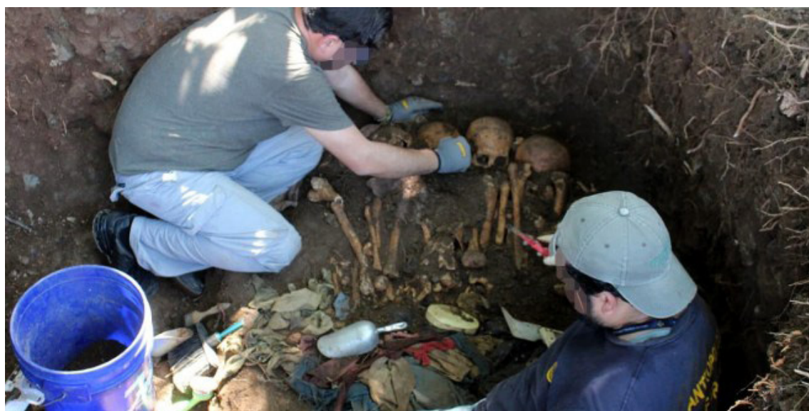
Las exhumaciones realizadas en el cementerio municipal de Cacaopera, Morazán, forman parte de las investigaciones que cuentan con apoyo de la arqueología forense para las evidencias sociales que giran alrededor del caso de la Masacre de El Mozote y sitios aledaños.