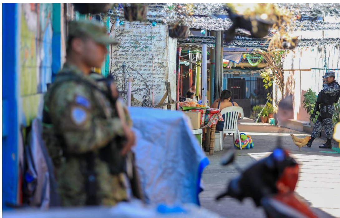
Cercos militares han dejado la captura de más de 1,400 supuestos terroristas, como parte de la fase 5 del Plan Control Territorial llamada "extracción".

mación con la que tenemos en los centros penales y es así como vamos teniendo los resultados pendientes de capturar", destacó Villatoro.