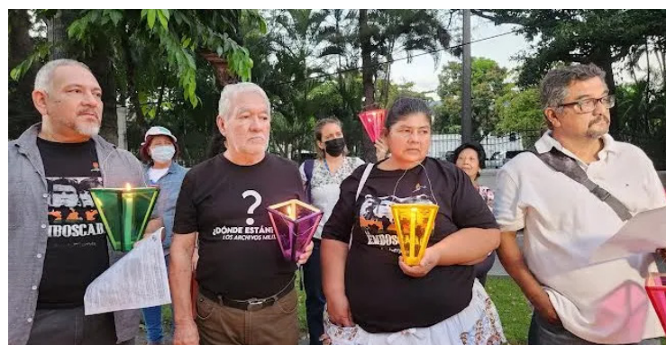
Organizaciones y víctimas del conflicto armado se concentran en Casa Presidencial para exponer la carta hacia el Estado.

Y es que según plasmaron las organizaciones, la espera para conocer la verdad y hacer justicia a las víctimas de la pasada guerra en El Salvador “mantiene abiertas las heridas y punzante el dolor de quienes sufrimos estos hechos, muchos tan graves que son crímenes de lesa humanidad”. Se estima que el conflicto armado que sufrió El Salvador por 12 años