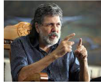
La Habana/Prensa Latina

El presidente de Casa de las Américas, Abel Prieto, advirtió este domingo sobre el papel de las redes sociales en la difusión de discursos de odio, racistas y violentos y de campañas de manipulación contra Cuba.