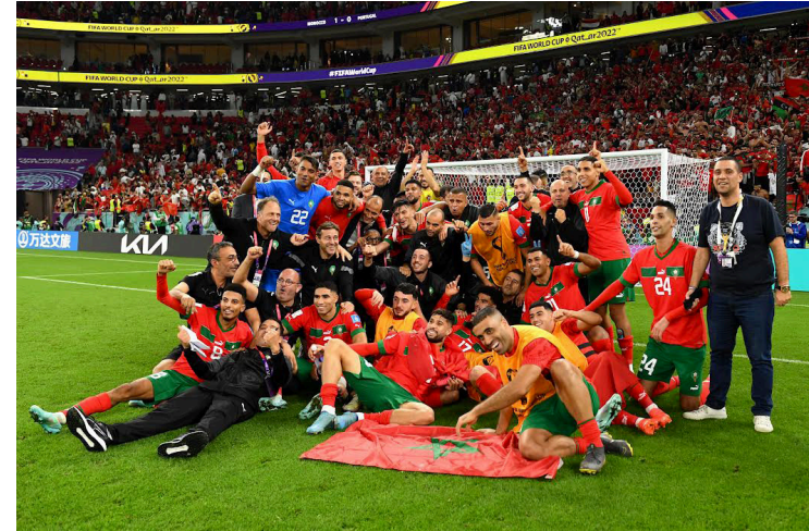
Marruecos se convierte en la primer selección de África en alcanzar las semifinales de un mundial, esta vez disputará el partido de antesala a la final contra Francia.

que llegaron a los cuartos de final, en la historia mundialista, fueron eliminados en la fase, estos son Camerún en 1990, luego Senegal en 2002 y Ghana en 2010. Marruecos será la primer selección en llegar, este miércoles