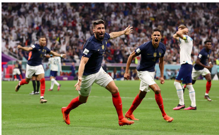
Oliver Giroud de la selección de Francia, celebra el gol del desempate (1-2) ante Inglaterra que le concede el boleto a las semifinales de la Copa Mundo Catar 2022.

La batalla por el boleto a la siguiente fase tuvo 17 minutos con el marcador 0-0, con Francia intentando acomodarse y con la intención de romper las líneas del combinado inglés para ir por la ventaja desde los primeros minutos y los ‘three lions’ presionando para trazar el cami-