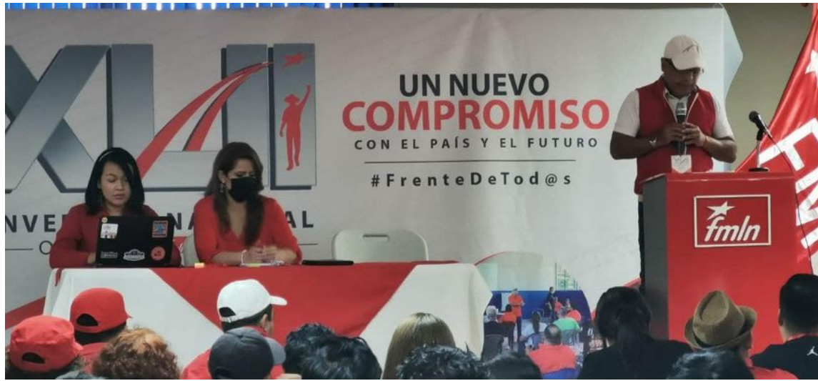
Secretario general del FMLN preside la XLII Convención Nacional del FMLN, donde acuerdan 4 elementos que regirá el futuro del partido.