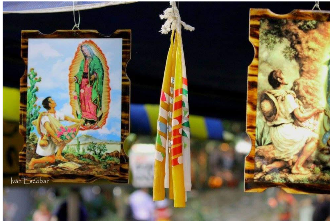
La celebración de la “virgen morena” está ligada a los milagros y bendiciones que aseguran muchas familias haber tenido, por lo que acuden al templo en familia.

Los católicos en toda América Latina y distintas latitudes del planeta, se aprestan a celebrar las apariciones de la Virgen de Guadalupe, que en este año llega a su 491 aniversario. La Ceiba es en El Salvador, hoy en día, un referente nacional e incluso regional, y recibe a miles de personas cada año, desde que el arquitecto de origen ita-