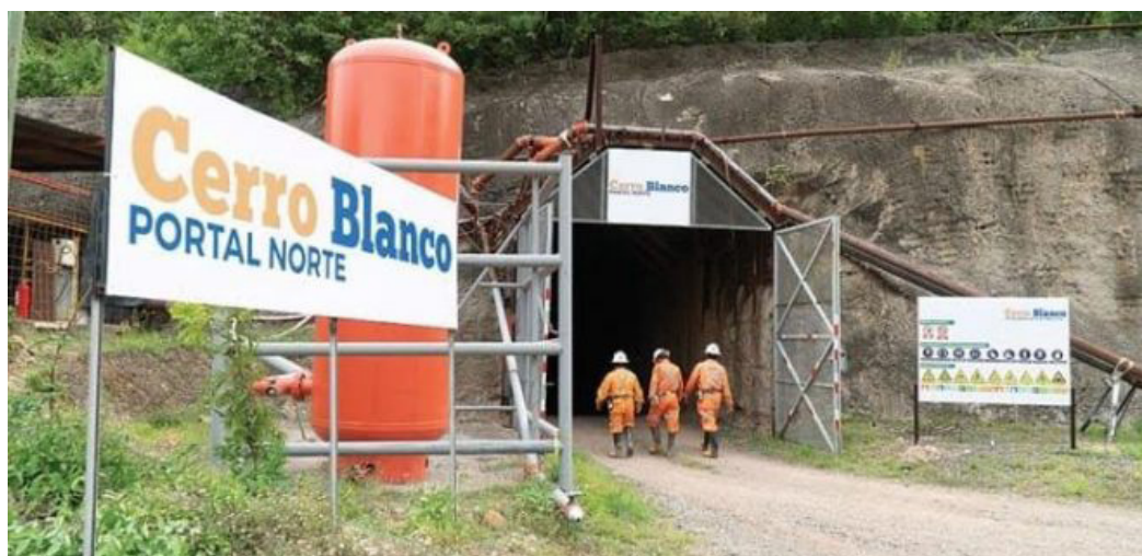
El proyecto minero Cerro Blanco, de propiedad canadiense se encuentra en el municipio de Asunción Mita, Jutiapa, Guatemala, cuyas aguas transfronterizas con El Salvador, podrían contaminar las aguas del río Lempa y el lago de Güija.