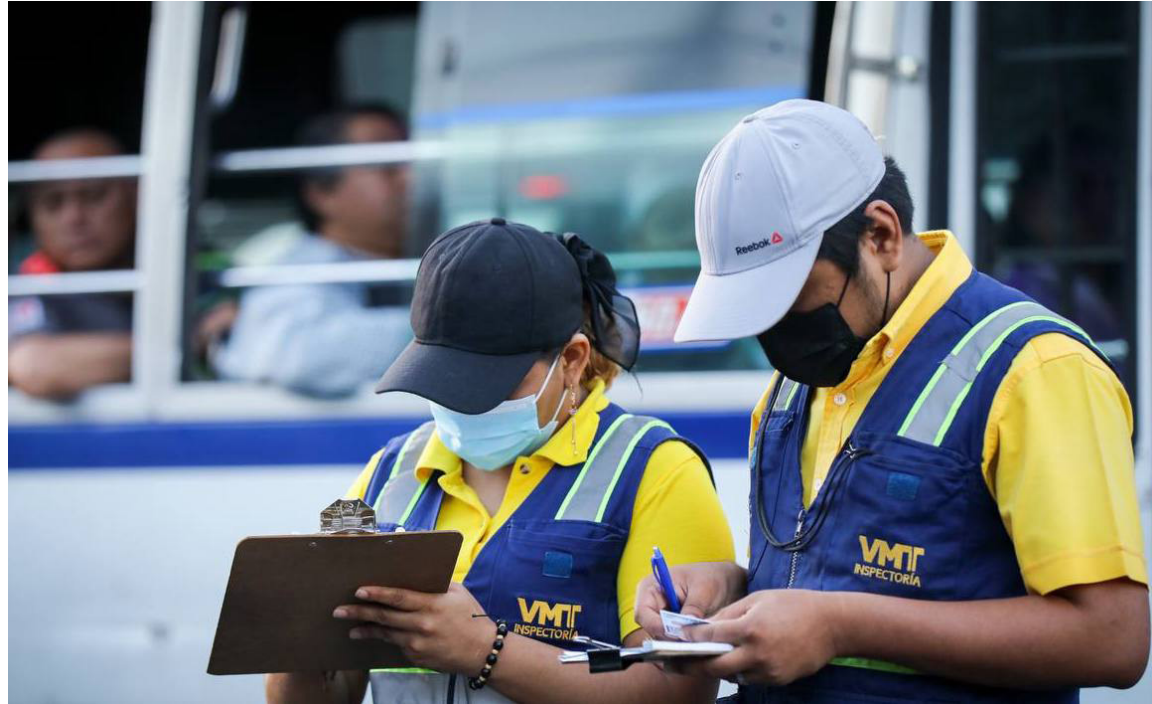
El VMT intensifica los controles vehiculares y antidoping en los lugares que conducen a lugares turísticos y de mayor afluencia, para evitar siniestros viales en la época navideña.

“Tenemos diferentes controles vehiculares en todo el territorio nacional para garantizar seguridad vial a los salvadoreños, tanto de día, de noche y madrugada, estamos teniendo controles para aplicar infracciones a los conductores irresponsables”