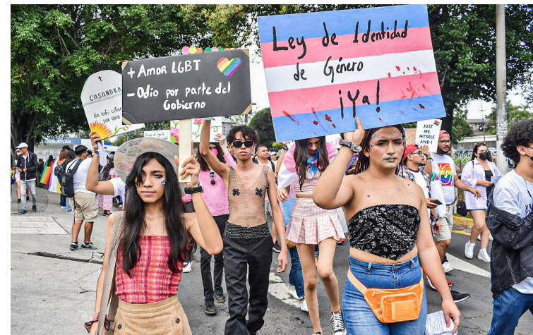
Personas LGBTI marchan el último sábado de junio de cada año con el fin de exponer su situación y exigencias hacia el Estado.

En la Asamblea Legislativa aún no se discute la Ley de Iden-