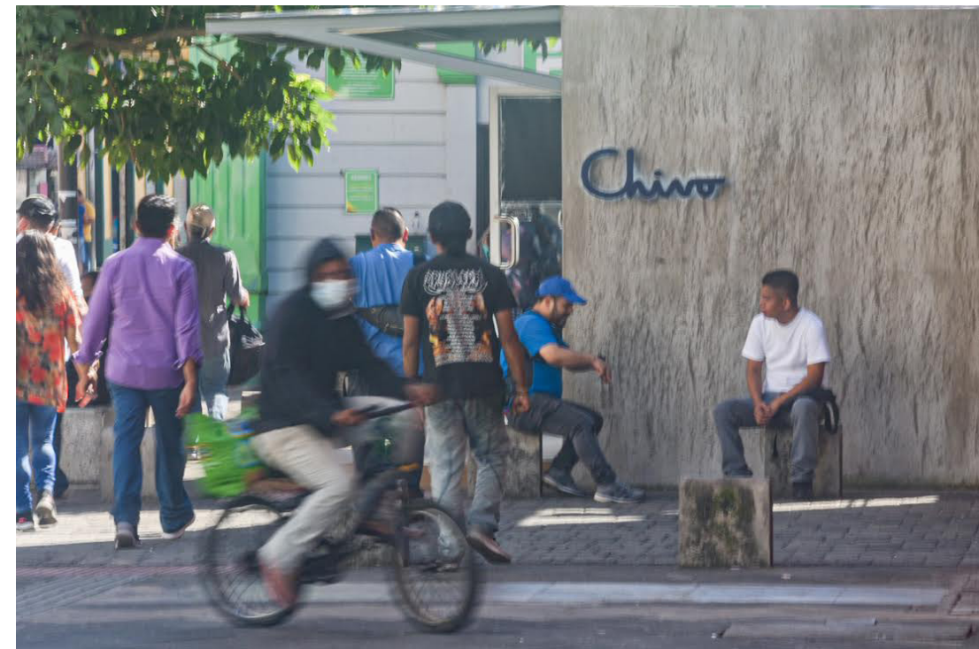
Los salvadoreños le han hecho poco caso a las casetas Chivo. Solamente cuando el Gobierno anunció que daría los $30 dólares, dichas casetas lucían abarrotadas.