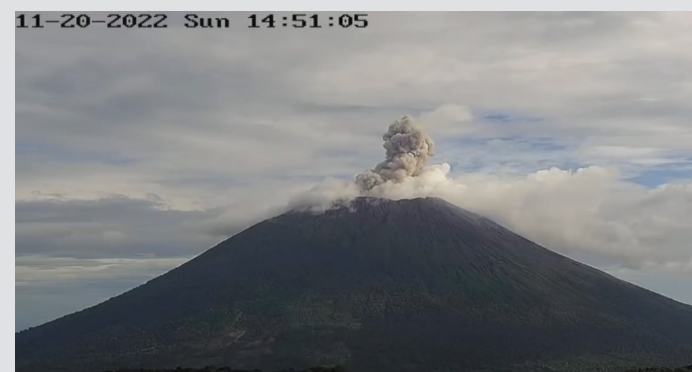
Esta es una de las explosiones registradas ayer domingo; el cráter expulsa gases y cenizas.