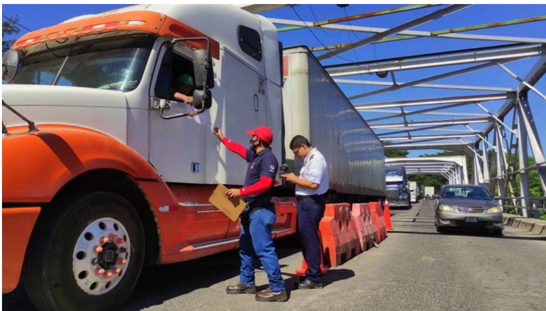
Transportistas de carga pesada levantaron el bloqueo que habían efectuado desde el pasado 14 de noviembre.