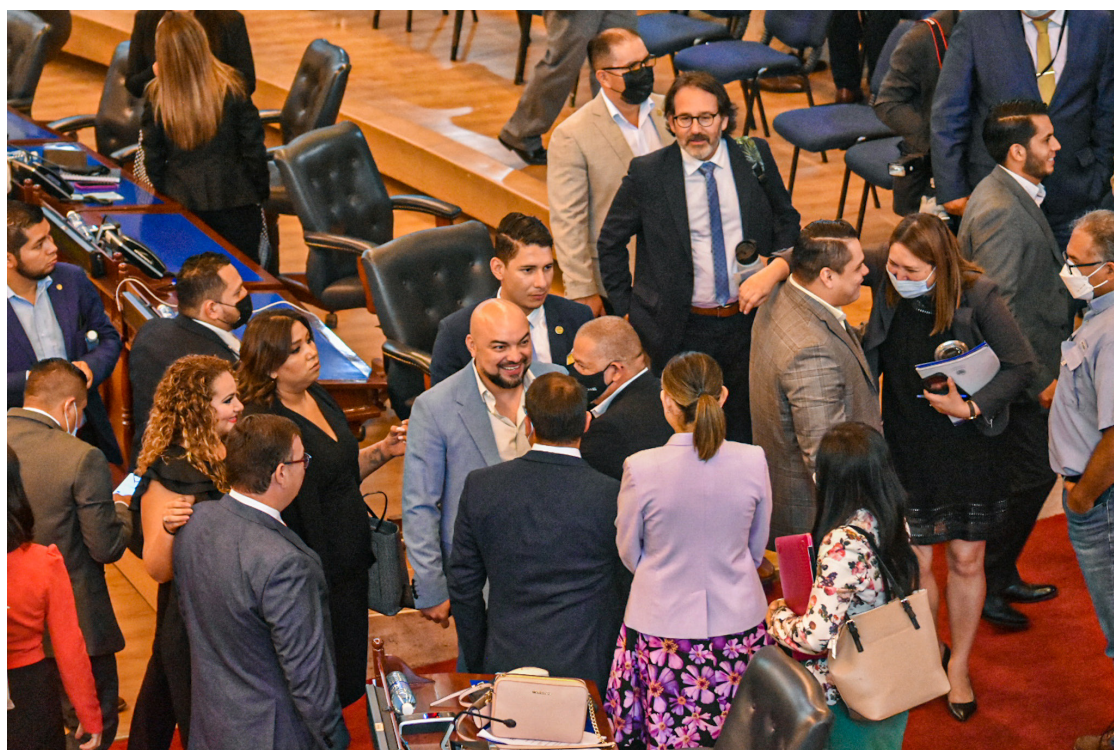
Diputados de Nuevas Ideas se muestran negativos ante las propuestas de la oposición. De hecho, el oficialismo no ha aprobado ninguna propuesta hecha por otros diputados que no sean de sus aliados, PDC, PCN y GANA.

Tomando en cuenta ese incremento en los productos básicos, “se deben establecer medidas que vayan en función de generar algún alivio al bolsillo de los salvadore-