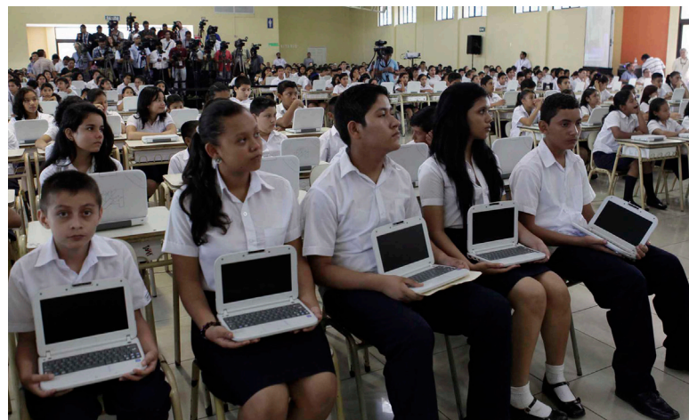
Alba se volvió en el enemigo número uno del imperio y la oligarquía, sin embargo, fue la responsable que los primeros 8 mil niños del país recibieron computadoras en sus escuelas y comenzar a digitalizarse.

A criterio de Merino, en los dos periodos de gobierno