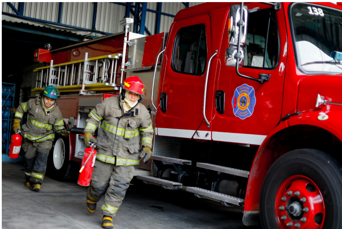
Por lo menos 950 bomberos operativos se sumarán para atender las emergencias durante el Plan Fin de Año 2022.

El Sistema de la Integración Centroamericana (SICA) fue constituido el 13 de diciembre de 1991, mediante la suscripción del Protocolo de Tegucigalpa, Honduras, con el propósito que la integración en la región sea para convertirla en una zona de paz, libertad, desarrollo y democracia. Está constituido por Belice, Costa Rica, El Salvador, Guatemala, Honduras, Nicaragua, Panamá y la República Dominicana, que constituye un área de amplia biodiversidad y una población aproximada de 58.92 millones de personas.