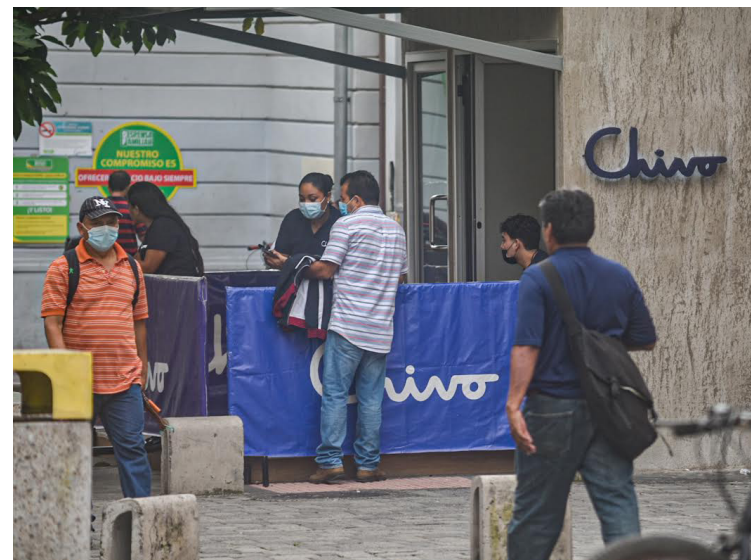
Los montos para conocer todo lo relacionado con el bitcoin y la Chivo Wallet no es público, esto limita a la ciudadanía en conocer de qué formase gasta el dinero público.

Este miércoles, el presidente de la República, Nayib Bukele, anunció que se estará comprando un Bitcoin “todos los días” a partir de este jue-