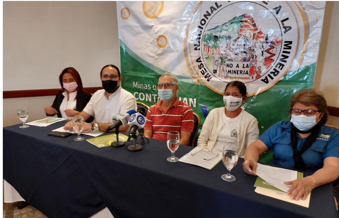
La Mesa Frente a la Minería Metálica sugirió que el Ministerio de Hacienda debe respetar y asignar un presupuesto anual necesaria para asegurar la ejecución del Plan de Reconversión Productiva: FOTO DIARIO CO LATINO/IVÁN ESCOBAR.

En cuanto a la “remediación ambiental”, Mira agregó que existen “casos graves” como la mina San Sebastián, Santa Rosa de Lima, La Unión, que generó “drenaje ácido”, que mantiene al río sin vida y continúa afectando el medio ambiente y la población de la zona y aguas abajo. “No hay ninguna medida que aborde la reconversión de la conocida minería artesanal con otras actividades económicas que les permitan a