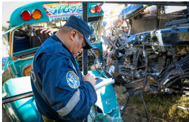
Este accidente deja una persona fallecida y 17 lesionados, según información de Cruz Verde Salvadoreña.

Redacción Diario Co Latino @DiarioCoLatino