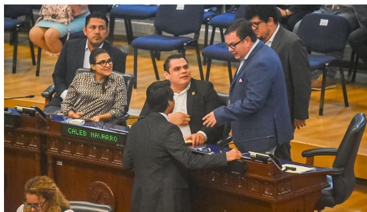
Diputados de Nuevas Ideas conocieron la iniciativa el martes y la aprobaron el mismo día, sin mayor análisis o discusión.

Según el Ministerio de Hacienda con base a las medidas contenidas en la Ley Especial y