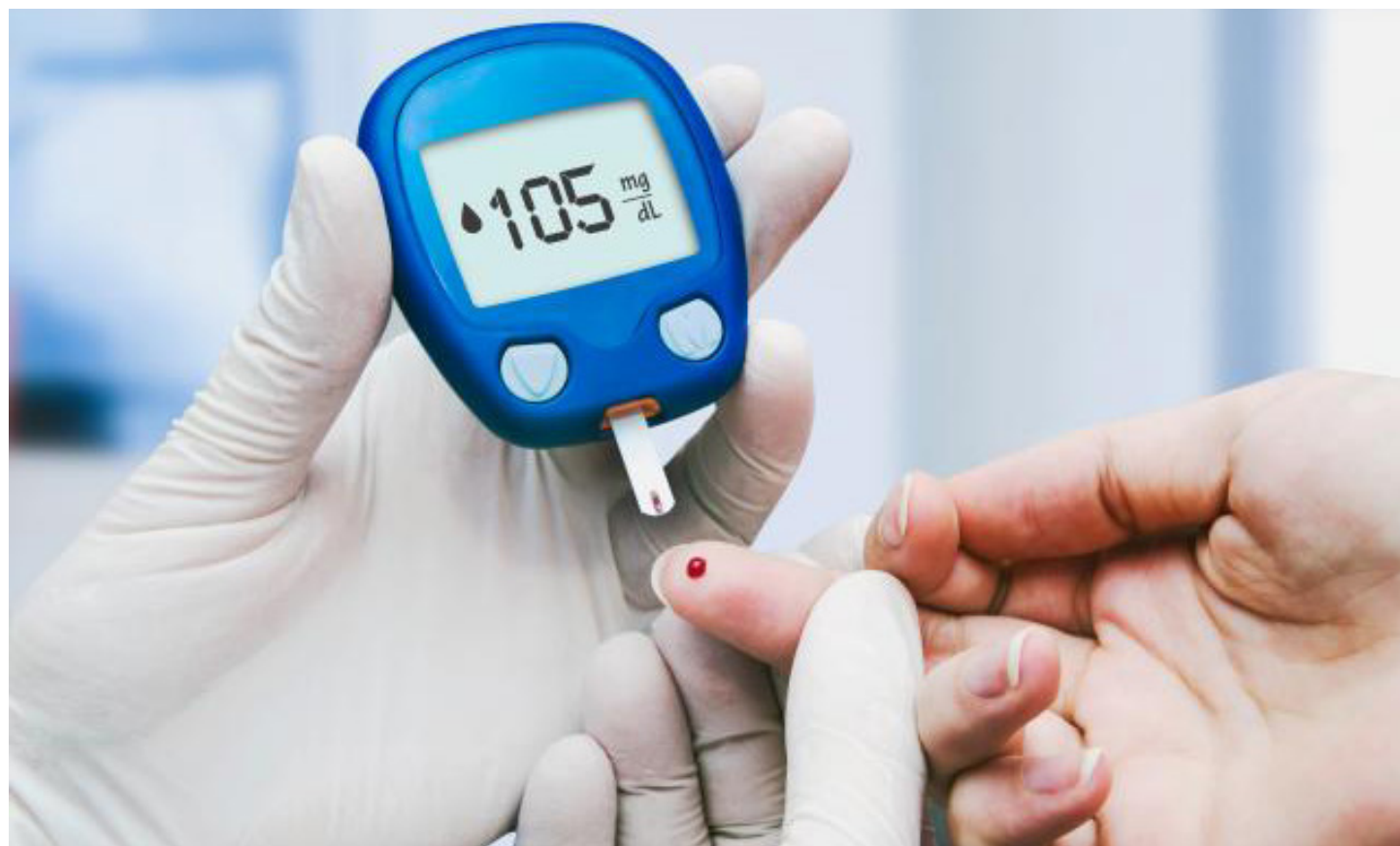
La Diabetes es una enfermedad metabólica crónica, caracterizada por niveles elevados de glucosa en la sangre.

El Informe de la Organización Panamericana de la Salud (OPS), presentado recientemente, señala como dato relevante que las tasas crecientes de obesidad, dietas deficientes y falta de actividad física ha triplicado en tres décadas el número de personas con diabetes.