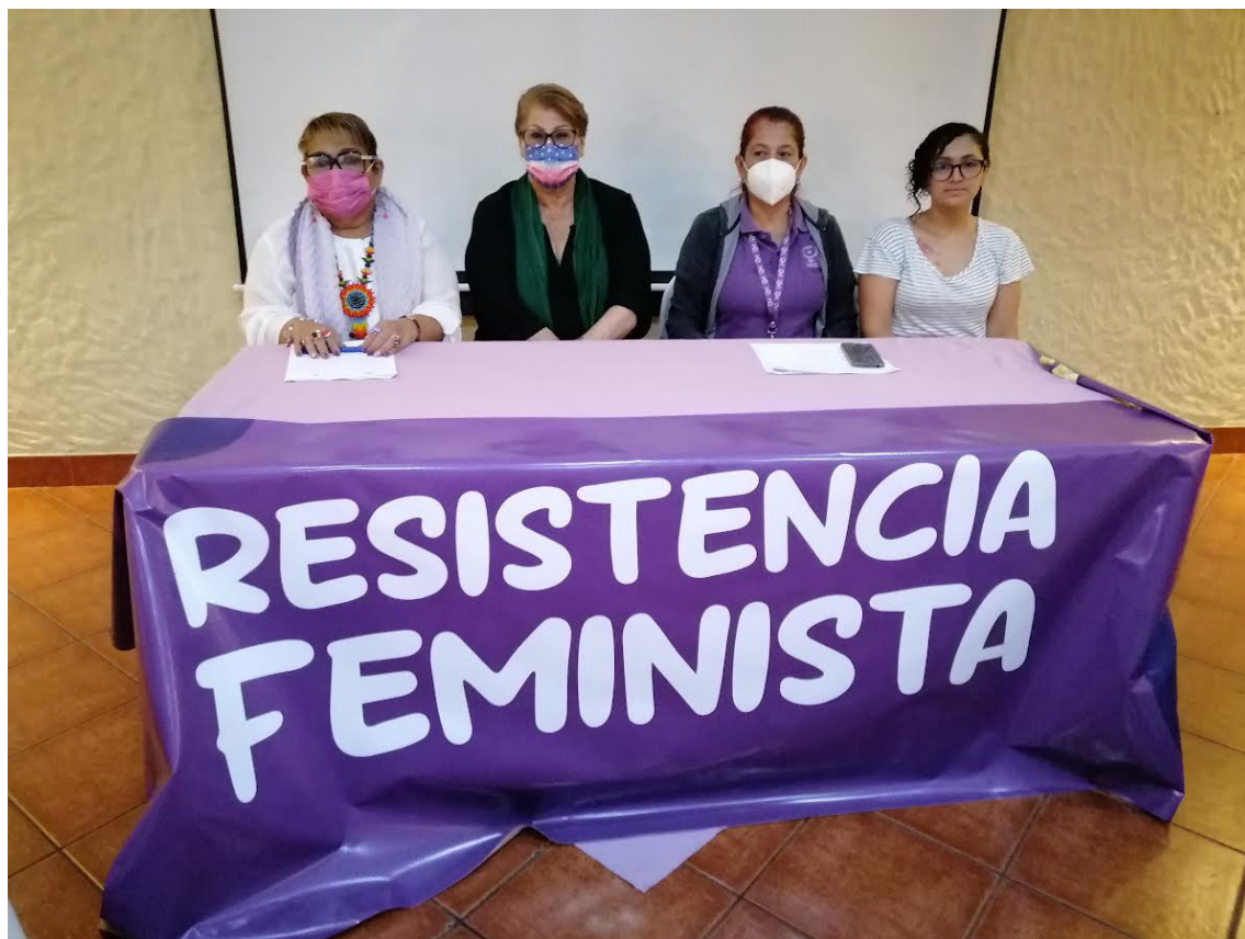
Las integrantes del colectivo de mujeres “Resistencia Feminista”, anuncian el retroceso democrático en materia de derechos humanos que afecta directamente a la mujer salvadoreña. Y anuncian la marcha para el próximo 25 de noviembre, Día Internacional de la Eliminación de la Violencia contra la Mujer.