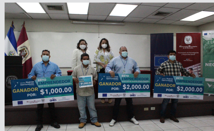
Los emprendedores ven como una oportunidad de mejora estos proyectos, ya que aparte de obtener capital semilla; los especializan con capacitaciones y asesorías enfocadas en un modelo de negocio integral.

En los próximos dos años el proyecto Gene-Sis de Nuevas Oportunidades espera beneficiar al menos 1,200 personas migrantes retornados con el objetivo de reintegrarse productivamente al país.