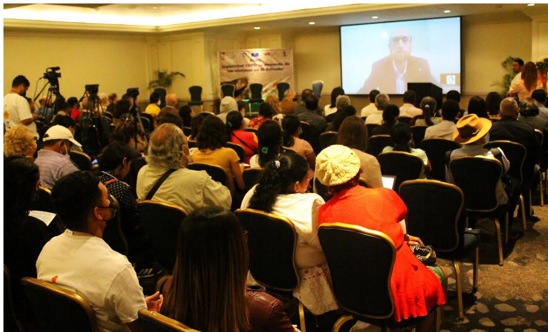
Las organizaciones que trabajan en favor de encontrar a los desaparecidos, durante la guerra, demandan de las autoridades abrir los archivos militares y que se haga justicia.