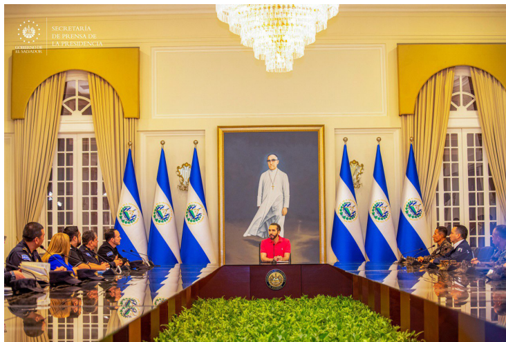
La del presidente Nayib Bukele destina fondos públicos a pagar protección policial a personas investigadas por corrupción o que no pertenecen al aparato estatal.

la administración Bukele destina fondos públicos a pagar protección policial a personas investigadas por corrupción o que no pertenecen al aparato estatal. En particular destaca la figura del empresario Herbert Saca, un operador político investigado por su presunto papel en esquemas de corrupción durante el mandato de su primo, el expresidente Antonio Saca (2004-2009) y de su sucesor, Mauricio Funes (2009-2014), uno preso y el otro prófugo de la justicia salvadoreña. La denuncia periodística recibió la callada por respuesta de parte de los partidarios de Bukele, y tampoco hay mucha esperanza de que la Corte de Cuentas investigue al director de la Policía Nacional Civil, Mauricio Arriaza, como solicitó Cristosal en su reciente demanda. “En El Salvador el sistema de control esta cooptado por el Ejecutivo, no son instituciones independientes que permitan controlar el poder y que se asegure una rendición de cuentas efectiva”, explicó López, quien, no obstante, reivindicó la necesi-