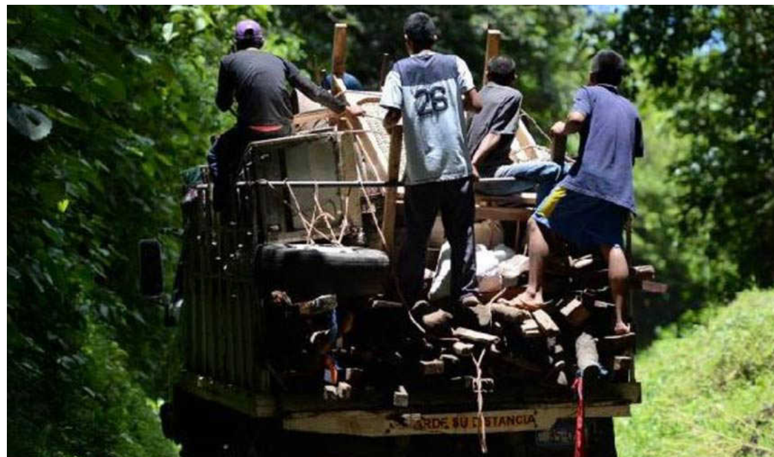
La violencia social y las amenazas por parte de grupos pandilleriles, continúan como las principales causas de desplazamiento interno forzado en el país, que afecta principalmente a jóvenes y adolescentes.