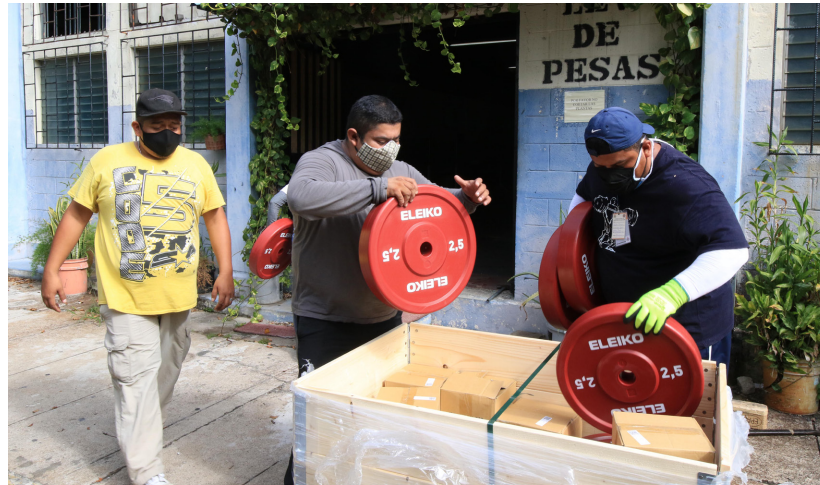
Implementos que estrenarán los atletas de levantamiento de pesas.

Dichos fondos son distribuidos de la siguiente manera en ambos gimnasios: 18 equipos completos