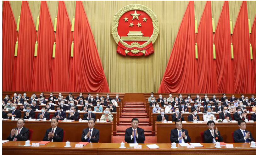
La reunión de clausura de la tercera sesión de la XIII Asamblea Popular Nacional (APN) se lleva a cabo en el Gran Palacio del Pueblo en Beijing, capital de China, el 28 de mayo de 2020. Los líderes del Partido Comunista de China y de Estado Xi Jinping, Li Keqiang, Wang Yang, Wang Huning, Zhao Leji, Han Zheng y Wang Qishan asistieron a la reunión, y Li Zhanshu presidió la reunión de clausura y pronunció un discurso.

En la reunión también se adoptó la Decisión de la APN sobre el Establecimiento y la Mejora del Sistema Legal y los Mecanismos de Aplicación para la Región Administrativa Especial de Hong Kong