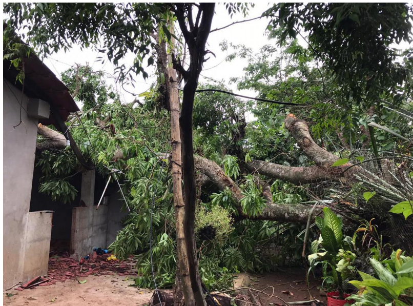
Lluvias dejan cinco viviendas dañadas por la caída de árboles en la comunidad de Guarjila, Chalatenango.

“Realmente es preocupante siempre que inicia el invierno, que este país que tiene como causales estructurales la parte económica, la pobreza, la in-