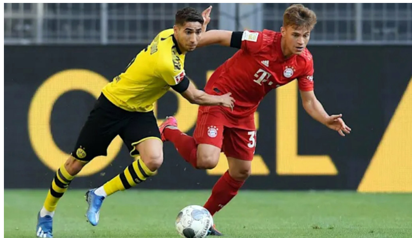
La Bundesliga fue la primera en volver a la actividad durante la pandemia del COVID-19.

Entre tanto, el campeonato de Alemania Bundesliga, fue una de las últimas competicio-