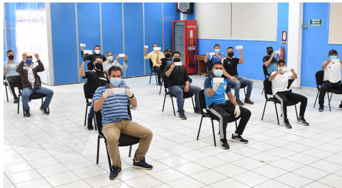
Árbitros cuscatlecos con su cheque de ayuda económica de la FESFUT.

Es de recordar que los referés cuscatlecos, pero en la modalidad de fútbol sala y fútbol playa, también se han visto beneficiados con otras ayudas, como la que les hizo el INDES.