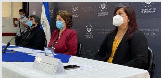
Ministra de Educación, Carla Hananía presidió la graduación virtual de 182 jóvenes y adultos que culminaron sus estudios de Bachillerato en modalidad virtual.

La distribución de sedes por modalidad de estudio es la siguiente: 4 de la modalidad acelerada, 139 semipresencial, 183 a distancia, 81 nocturna y una de la modalidad del Bachillerato Virtual. Asimismo, el MINED cuenta con una planta de docentes tutores a nivel nacional de 2,950, en especialidades como Matemática, Estudios Sociales y Cívica, Ciencia, Salud y Medio Ambiente, Lenguaje y Literatura e Inglés.