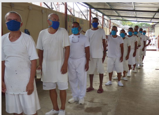
Cincuenta hombres y ocho mujeres reclusos en el pabellón designado para reos con padecimientos mentales en el Hospital Nacional Psiquiátrico, en Soyapango, fueron diagnosticados con COVID-19.

El juzgado emitirá y notificará en los próximos días la resolución sobre la audiencia especial. La cifra de casos confirmados de COVID-19 en centros penitenciarios superaría ya el centenar.