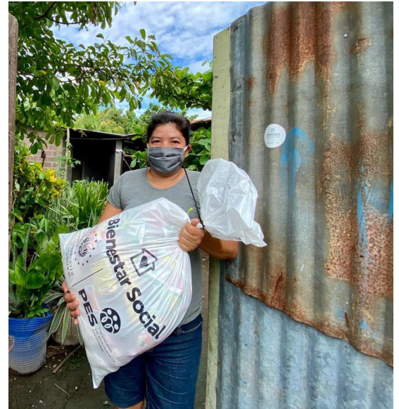
El Fondo de las Naciones Unidas para la Infancia (UNICEF) alertó de que se perpetrar actos de violencia y discriminación contra los repatriados, a quienes se percibe como infectados por el coronavirus (COVID-19).

Para la tarde y noche de este día, el Ministerio de Medio Ambiente y Recursos Naturales (MARN) pronostica que el cielo estará generalmente nublado, con lluvias de moderadas a