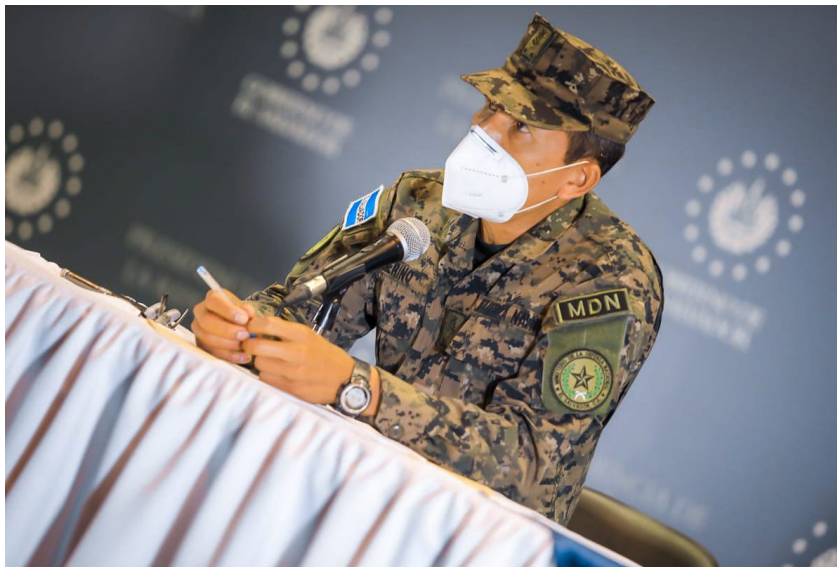
René Merino Monroy, ministro de Defensa.

191 elementos de la Fuerza Armada de El Salvador han recuperado su salud, luego de enfermar de COVID-19.