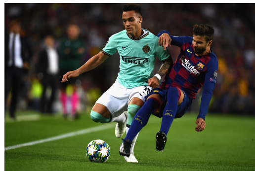
Lautaro Martínez es uno de los objetivos para fichar del equipo azulgrana.

Estas declaraciones significan un retroceso en las negociaciones entre ambos clubes por el jugador, pues el Barcelona contempla incluir jugadores en la misma para abaratar el costo de uno de los delanteros