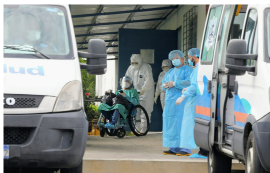
A 70 días de cuarentena domiciliar obligatoria, el Ministerio de Salud (MINSAL) cambió las disposiciones para atender casos de COVID-19.

En este sentido, y a setenta días de cuarentena domiciliar obligatoria, el Ministerio de Salud (MINSAL) cambió las disposiciones para atender casos de COVID-19 y el tratamiento utilizar debido a prohibición de la OMS para administrar Hidroxloroquina más Azitromicina por causar arritmias car-