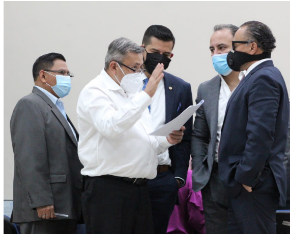
Diputados y Gobierno discrepan en cuanto a la duración de la cuarentena domiciliaria, los legisladores sostienen que la población lleva más de dos meses en un confinamiento que se ha endurecido cada vez más.