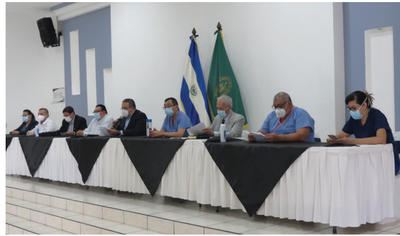
El Colegio Médico de El Salvador recomienda mantener por 14 días la cuarentena acorde a los protocolos de vigilancia epidemiológica y cumpliendo estrictamente protocolos de bioseguridad.

Extremar el cuidado de los grupos más vulnerables, con