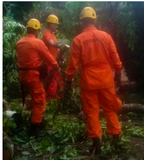
Cuerpos de Socorro colaboran para limpiar estragos ocasionados en viviendas por las fuertes lluvias en la comunidad Guarjila, Chalatenango.

Y que de persistir el fenómeno de La Niña, el océano se va a enfriar mucho más de lo normal, que se relaciona con los vientos alisios, aumentando la canti-