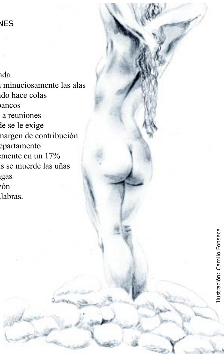
Ilustración: Camilo Fonseca

Resignada se corta minuciosamente las alas y llorando hace colas en los bancos y asiste a reuniones en donde se le exige que el margen de contribución de su departamento se incremente en un 17% mientras se muerde las uñas las mangas el corazón y las palabras.