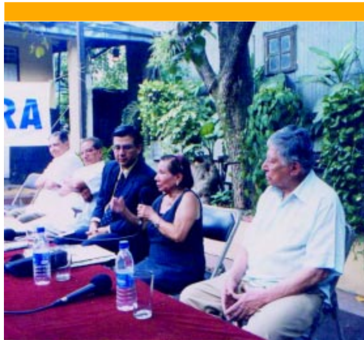
Mesa Redonda titulada: La Generación Comprometida: Aportes. Casa de la Cultura del Centro Histórico de San Salvador, 22 de septiembre del 2001.