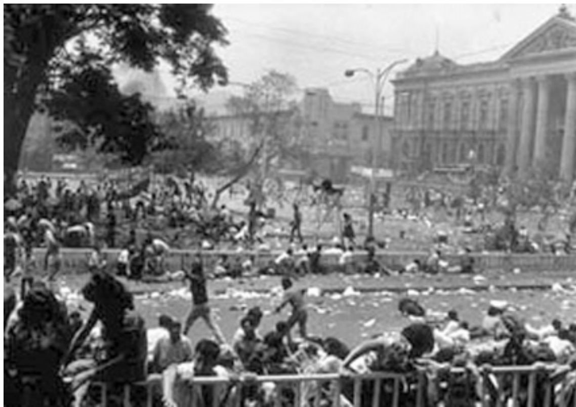
Violencia y represión estatal durante las ceremonias religiosas del entierro de Monseñor Romero, 30 de marzo de 1980.

Cuando regresé al país, después de 20 años, yo hablaba con mi familia del pasado, de los que se quedaron, de lo que yo había vivido, ¿pero cuál fue la respuesta de