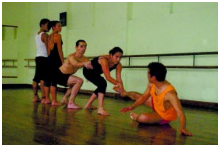
Ensayo de Luna Azul.

Durante el proceso, los bailarines interactuaban con las indicaciones dadas por el coreógrafo, así mismo, este observaba lo realizado por los bailarines y surgían nuevas propuestas, imágenes, formas de movimiento que iban sumándose a la construcción. Francisco recuerda: «las propuestas se fueron amoldando a la forma de movimiento particular de cada bailarín, observé qué es lo que podía hacer y cómo eso se podía desarrollar al máximo, como cada forma de movimiento podía dar lo máximo». Esto es evidente al observar el montaje, donde cada uno posee una cualidad de movimiento que se suma para pro-