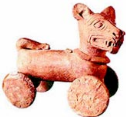
Juguete con ruedas encontrado en el sitio arqueológico de Cihuatlan.

Una de las temáticas –necesarias de investigar, escudriñar, debatir, teorizar, contradecir y difundir – son los elementos identitarios que configuran nuestra identidad. En esta dirección los migrantes cada vez toman un rol en este entramado identitario, en ese sentido hemos revisado una conversación amplia, amena y franca que sostuve con un de los especialistas más connotados en materia antropológica en El Salvador y en esa conversa hemos abordado uno de los temas más polémicos y que está en boga en estos momentos. Vaya pues para todos y todas estas reflexiones de viva voz del doctor Ramón Rivas.