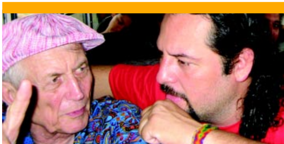
Guevara con el poeta ruso Eugueni Evtushenko, cuando participó en el Encuentro Internacional de Poetas «El turno del ofendido» en El Salvador.

Por eso dirá con tono y alusión bíblica: «Tomo la sal entre mis dedos y siento enjambres de hombres remontar parajes asesinos/ atravesar océanos de infinitas incertidumbres/... La sal/ con toda su blancura/ no pronuncia la sangre vertida tras su aroma de mar/ nunca invoca la paz/ muy al contrario/ se devela mortaja sobre el cabello de las santas mujeres/... La sal es cruel/ La mujer de Lot lo sabe/ en lo que aún le queda de corazón.» Poema: Sal, [10] resulta en suma interesante este poema porque posee una larga tradición y connotación, sobre todo en las culturas antiguas. «En el universo bíblico la sal es puente de unión entre Dios y su pueblo. La diosa lituana Gajiba dominaba el fuego sagrado y, para honrarla, se lanzaba sal a las llamas.» Su simbolismo ancestral es tal que este elemento Sal, mencionado en el «Symposion» de Platón y también utilizado en la conservación de alimentos corruptibles. Homero llama «divina» a la sal que se utiliza-