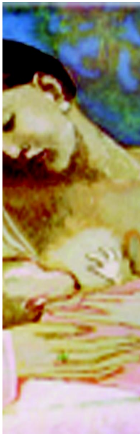
Maternidad. Pablo Picasso.

Los momentos ininterrumpidos de luz de los días caídos en la sangre que experimenta el sentimiento y la razón, el soplo de los instantes de quienes fuimos y de lo que aún somos respirando los mismos apellidos, estamos donde estemos o vayamos donde vayamos. Los unen las miradas cansadas, serias y aliviadas de papá, luego de soltarse los zapatos y sentarse en una silla, la sonrisa beso con beso de mamá preparando la comida, y el grato olor de las tortillas iluminando la mesa.