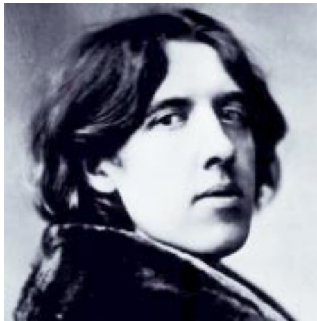
El romántico Wilde

- ¡Apriétate más, pequeño ruiseñor! -gritaba el rosal-, ¡o llegará el día antes de que este terminada la rosa!