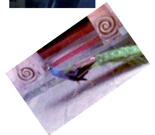
Pavorreal de Francys Alys