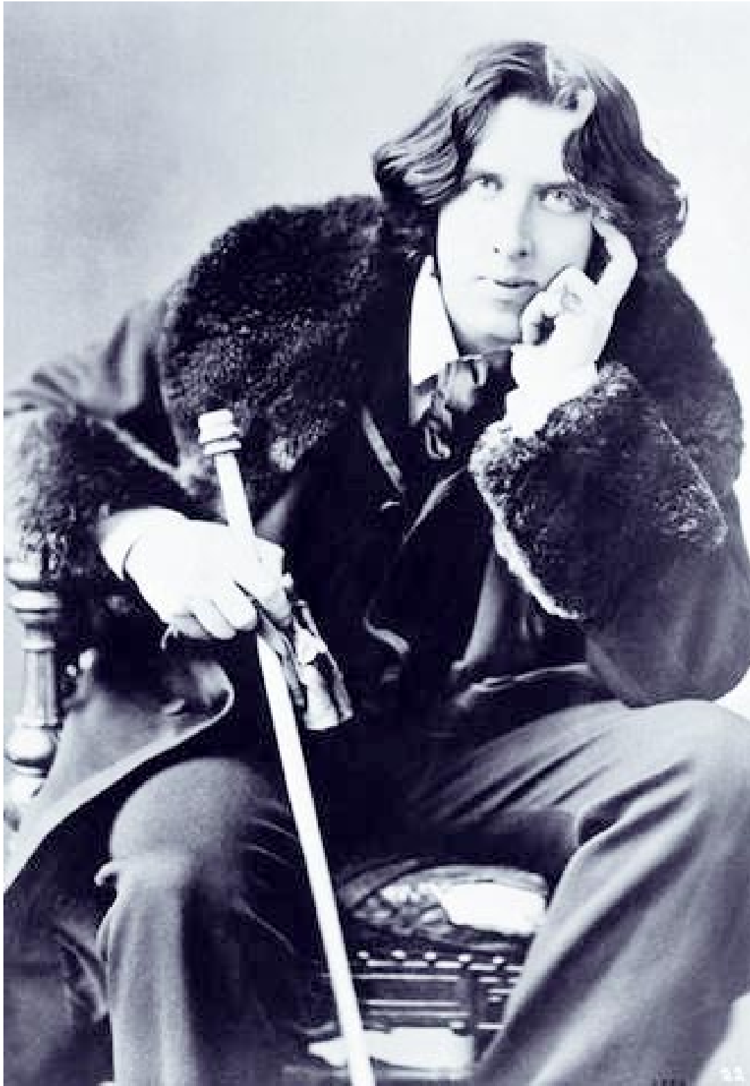
El escritor británico-irlandés Óscar Wilde

Óscar Wilde (Dublín, 1854 - París, 1900)