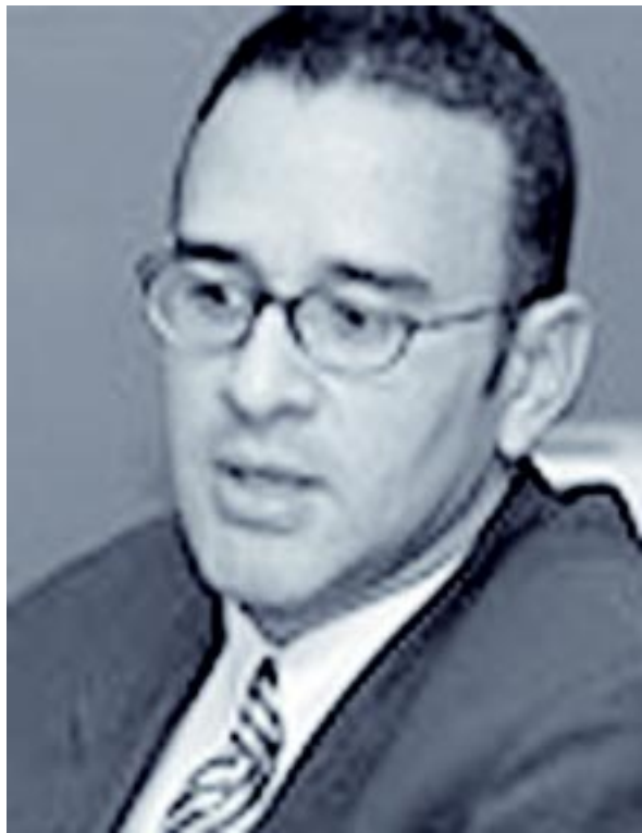
El periodista Mauricio Funes