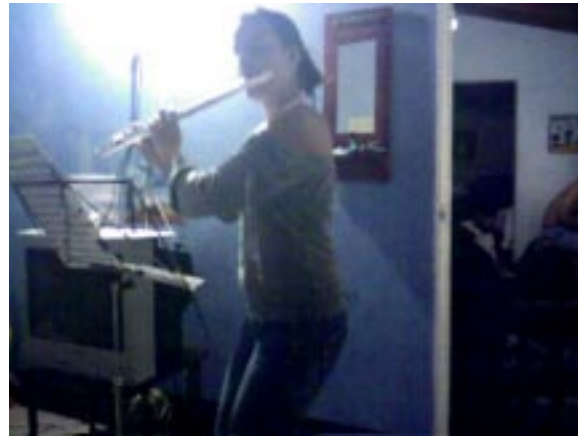
Flautista de Medeflín

Llegando los vientos de octubre el canto de los buses de la tarde el despertar de las paredes de ladrillo el baile de los árboles andantes, el viento liberando sus secretos, la tierra sofocando el sufrimiento,