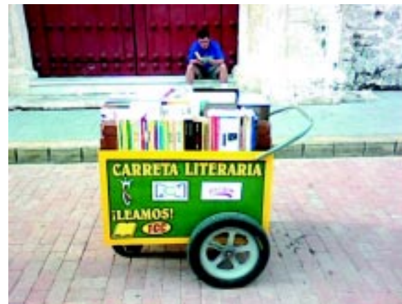
Carreta Literaria, Cartagena de Indias, Colombia 2008.

Los libros se prestan para leerlos dentro de la ciudad, posteriormente se devuelven para otros usuarios.