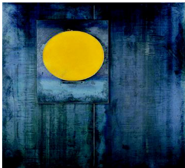
Janis Kounellis: Globo

Parece, pues, que tanto los contenidos de la película como, los recursos empleados en ella insisten en una idea capital, cuyo tratamiento da congruencia al tema de la misma: Para Etaix el cine cómico Francés le debe mucho a la pantomima escénica y de tradición circense, no debiendo haber salido nunca de tal influencia. El trabajo mismo del actor cómico no puede explicarse sin referirlo a las contribuciones de tempranos cómicos franceses presentes del circo o del Music Hall. Tal obsesión no es de extrañar si tomamos en cuenta que el mismo Etaix tuvo como esposa a la hija de laureado payaso "Fratellini", considerada como la creadora de la primera escuela circense en Francia.