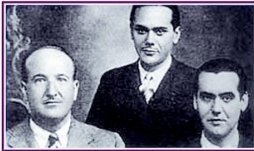
El trío: Vicente Aleixandre, Luis Cernuda y Federico García Lorca

Placeres prohibidos, planetas terrenales,