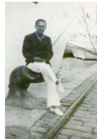
Luis Cernuda, a la orilla del mar

Allí con sus iguales, damas imperativas bajo sus afeites, caballeros seguros de sí mismos, rito social cumplía, y entre el diálogo moroso,