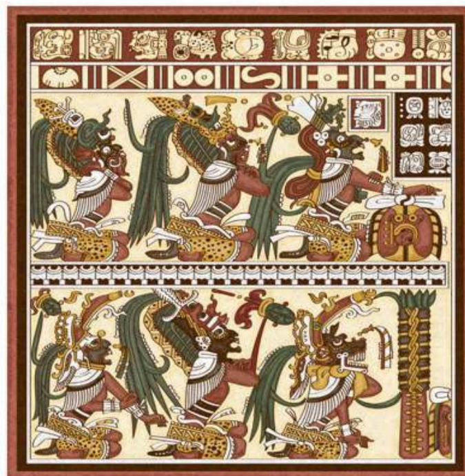
Lords of Xibalba