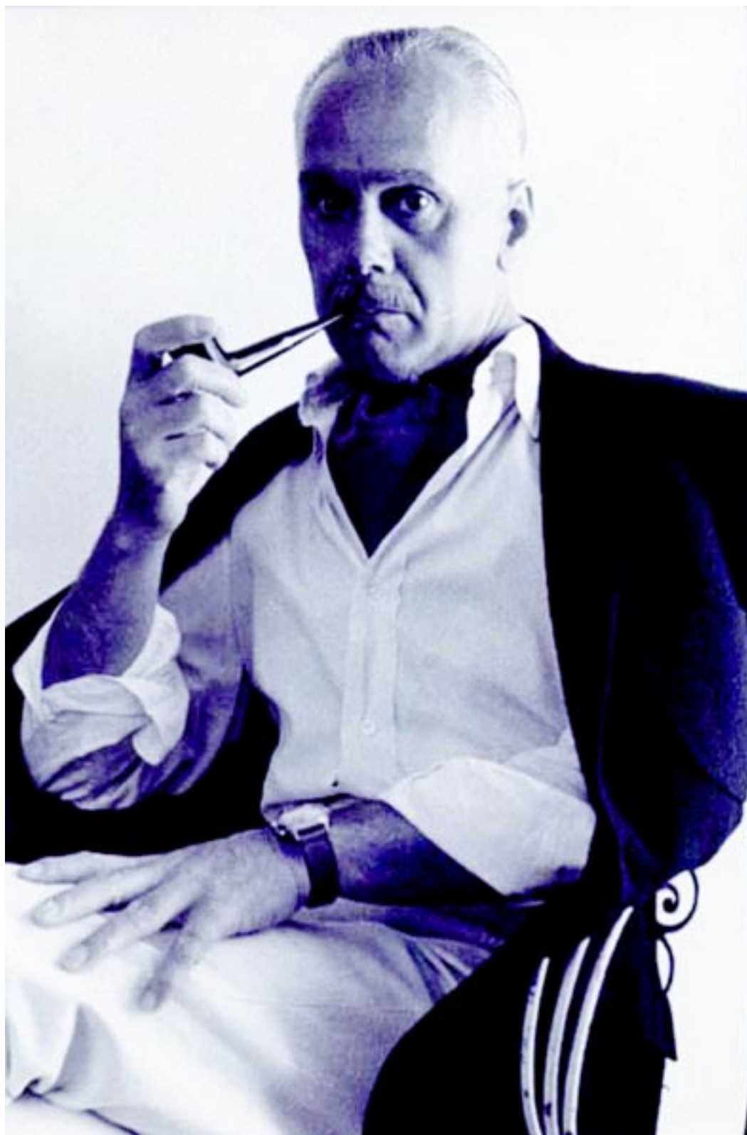
El controvertido escritor español Luis Cernuda

PRIMER AÑO DE BACHILLERATO Vladimir Baiza