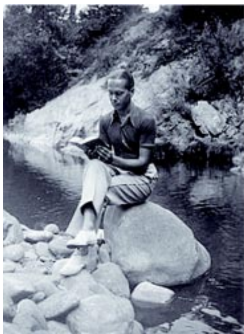
Cernuda en el río

El amor no tiene esta o aquella forma, no puede detenerse en criatura alguna; todas son por igual viles y soñadoras. Placer que nunca muere beso que nunca muere,