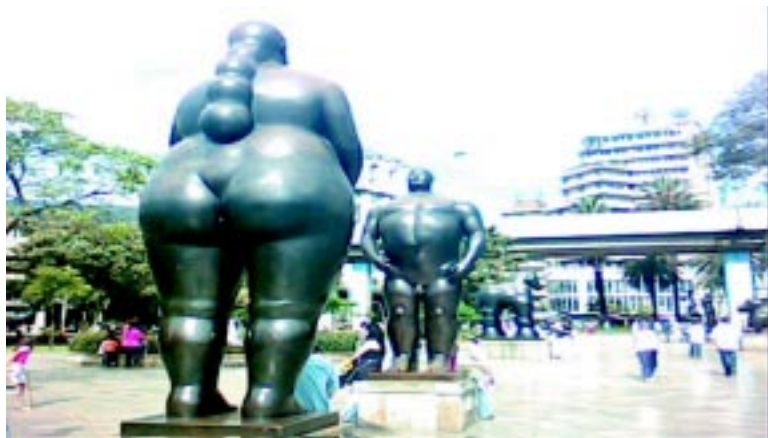
Los Gordos, de Botero. (Parque en Medellín, Colombia).

Otoniel Guevara Suplemento Cultural Tres Mil Diario Co Latino El Salvador