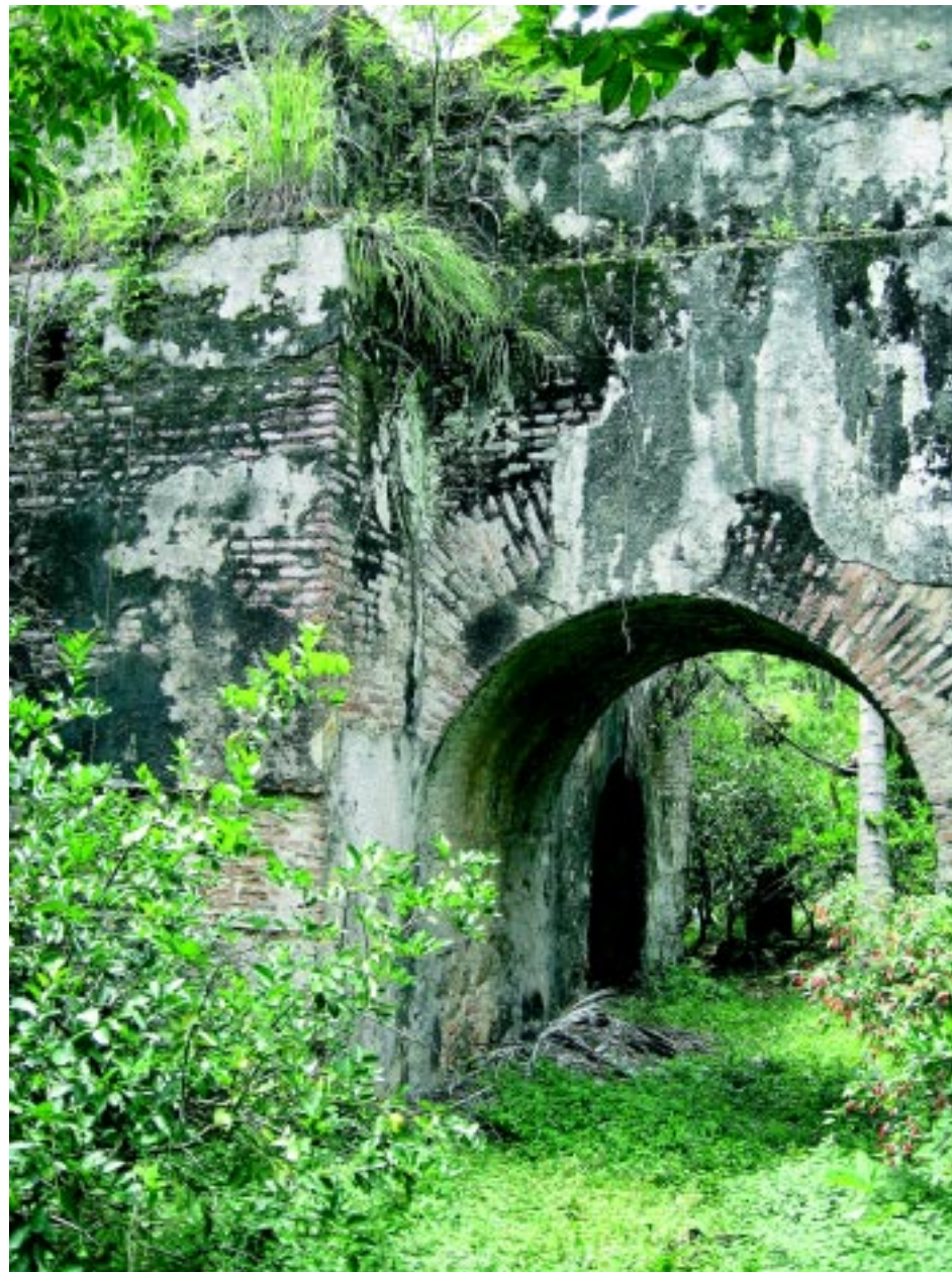
Antiguas edificaciones en Rosario.