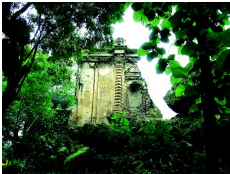
Tacuba.