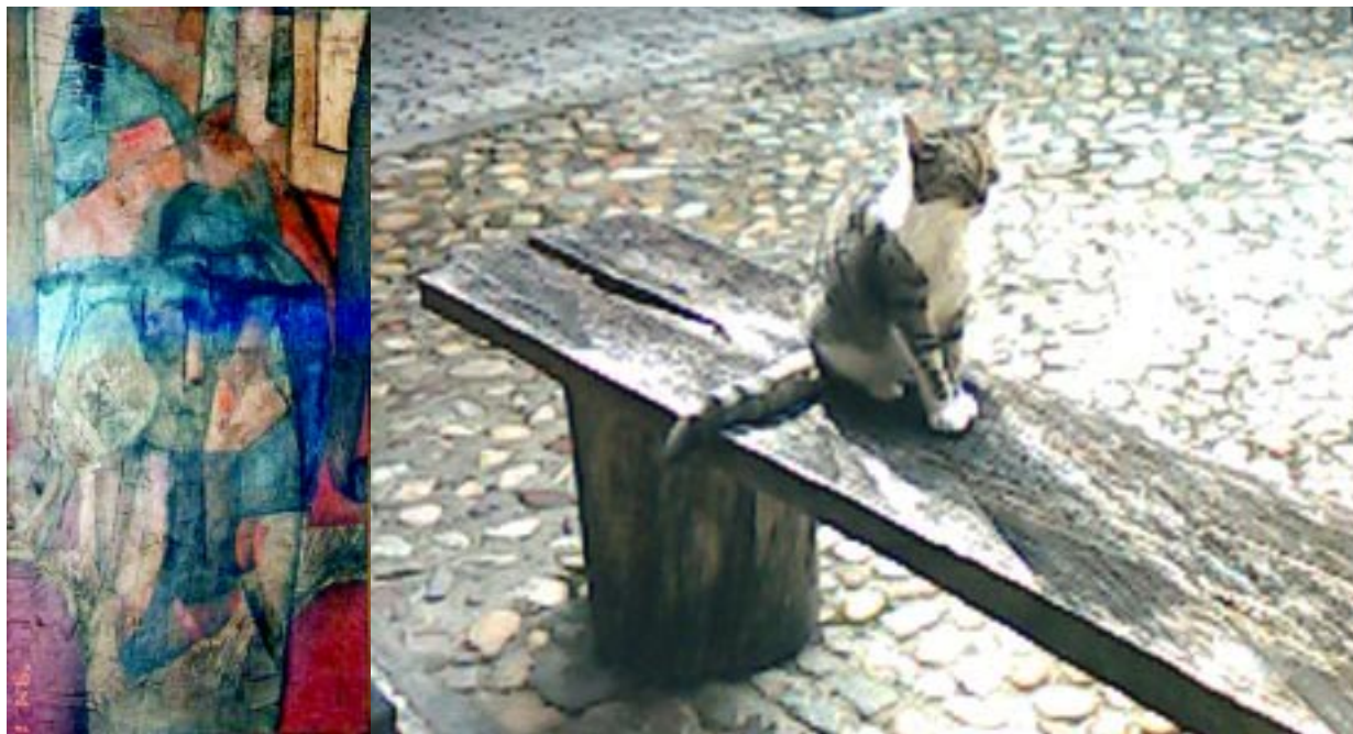
El Quijote (izq.) y Gato de La Selva (der.).

(PONENCIA PRESENTADA EN GUANAJUATO, MÉXICO; EN EL III ENCUENTRO DE PERIODISMO CULTURAL DE IBEROAMÉRICA, ENMARCADO EN EL 36 FESTIVAL INTERNACIONAL CERVANTINO: 8-26 OCT. 2008)