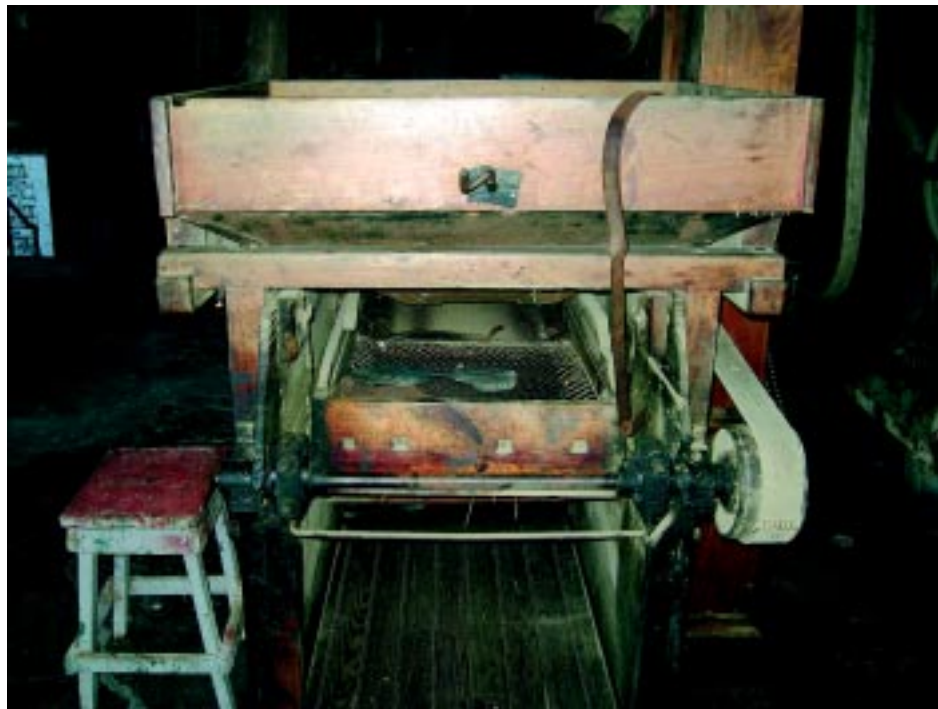
Parte del inventario elaborado por José Heriberto Erquicia. Beneficio Río Claro .

a. En el siglo pasado, en algunos de estos sitios hubo presencia de connotados historiadores e investigadores, así como también muchos de estos sitios cuentan con referencias documentales que datan de los siglos XVII, XVIII y XIX donde se hace referencia a familias importantes e influyentes, a litigios, a reasentamientos por desastres naturales, (erupciones volcánicas, desbordamientos de ríos, movimientos telúricos), así como a tipos de producción. La información que se consigna tiene un fundamento en fuentes históricas estratégicas para comprender la importancia y rol de estos sitios durante su esplendor y apogeo.