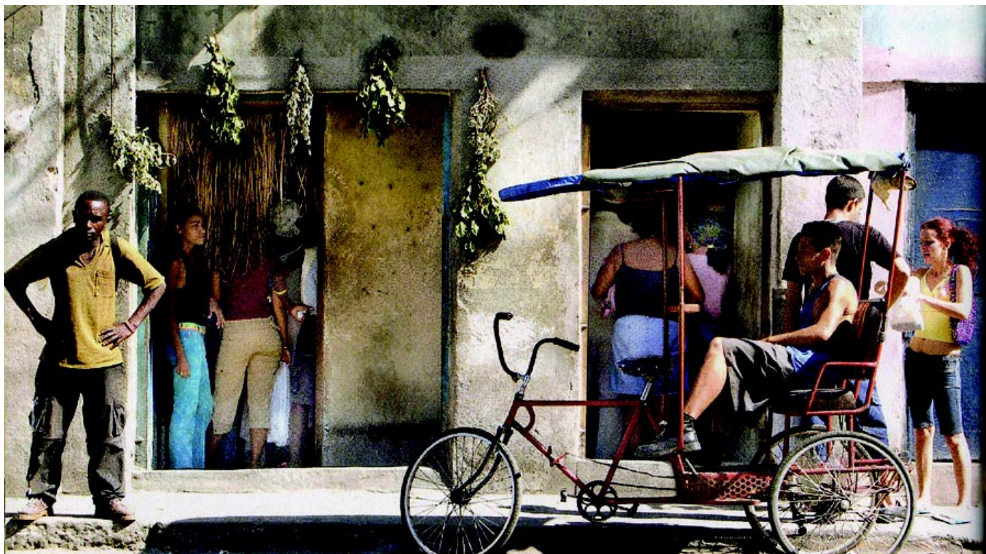
Una calle de La Habana, Cuba.

Una cosa le falta a don José Martí para ser un publicista [...] Fáltale regenerarse, educarse, si es posible decirlo, recibiendo del pueblo en que vive la inspiración, como se recibe el alimento para convertirlo en sangre que vivifica [...] Quisiera que Martí nos diera menos Martí, menos español de raza y menos americano del Sur, por un poco más del yankee, el nuevo tipo de hombre moderno [...] Hace gracia oír a un francés del Courier des États Unis reír de la beocia y de la incapacidad política de los yankees, cuyas instituciones Gladstone proclama como la obra suprema de la especie humana. Pero criticar con aires magisteriales aquello que ve allí un hispanoamericano, un español, con los retacitos de juicio político que le han transmitido los libros de otras naciones, como queremos ver las manchas del sol con un vidrio empañado, es hacer gravísimo mal al lector, a quien llevan por un campo de perdición [...]