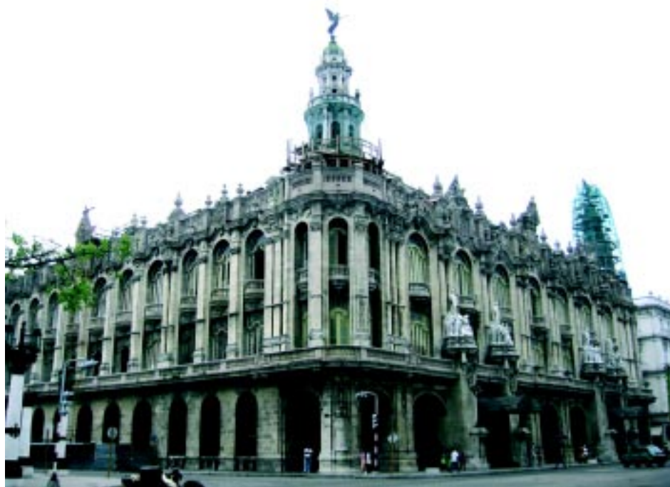
El Gran Teatro de La Habana

Odiar y vengarse cabe en un mercenario azotador de presidio; cabe en el jefe desventurado que le reprende con acritud si no azota con crueldad; pero no cabe en el alma joven de un presidiario cubano, más alto cuando se eleva sobre sus grillos, más erguido cuando se sostiene sobre la pureza de su conciencia y la