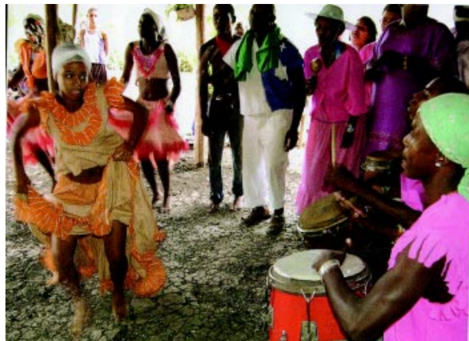
Una danza Vudu en Cuba, herencia afro-haitiana

Ante los Estados Unidos, Martí sigue una postura congruente con su ideal ecuménico. Aunque es claro en advertir que hará todo lo que esté a su alcance para «impedir a tiempo con la independencia de Cuba que se extiendan por las Antillas los Estados