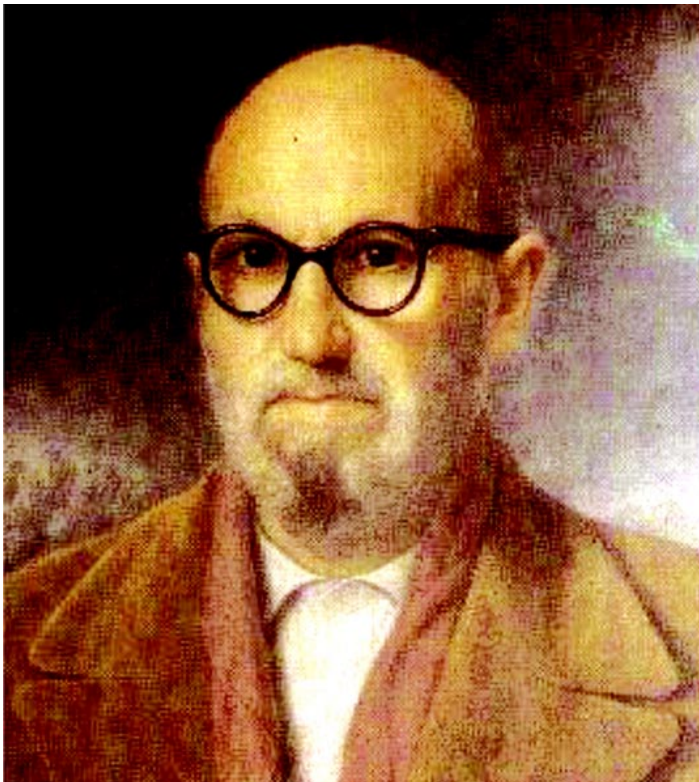
El poeta español León Felipe.