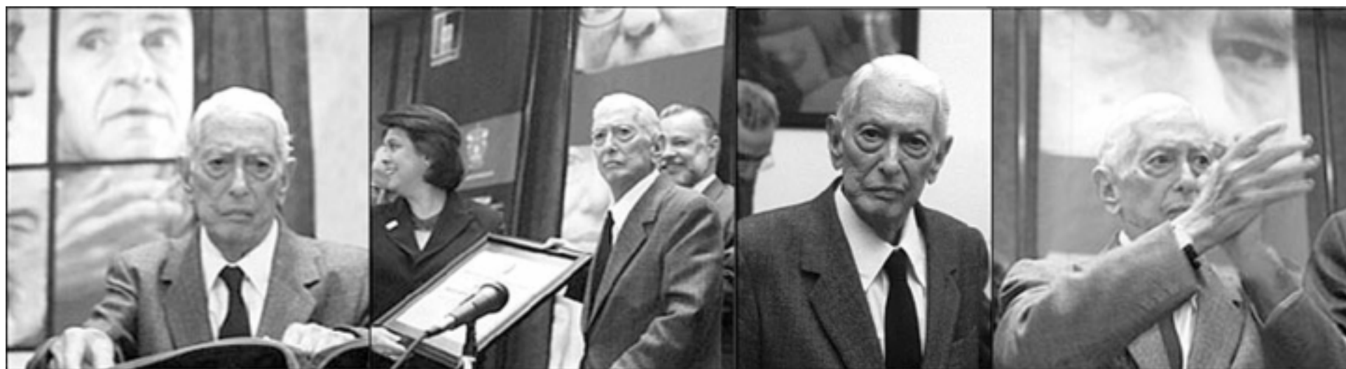
Secuencia fotográfica del escritor cubano Cintio Vitier