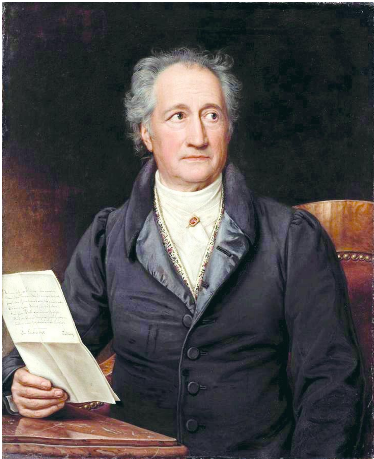
Imagen del escritor alemán Johann Wolfgang Goethe (Stieler 1828)