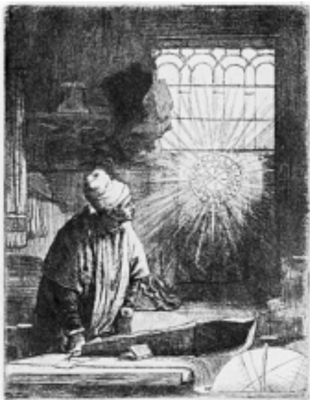
La presencia certera del mal

“Pero llegó un momento en que aquella cabeza ya no era capaz de contener por más tiempo tantos elementos dispersos. Y en el verano de 1772, hallándose en Wetzlar rogaba a Dios que le permitiera en los años sucesivos dar