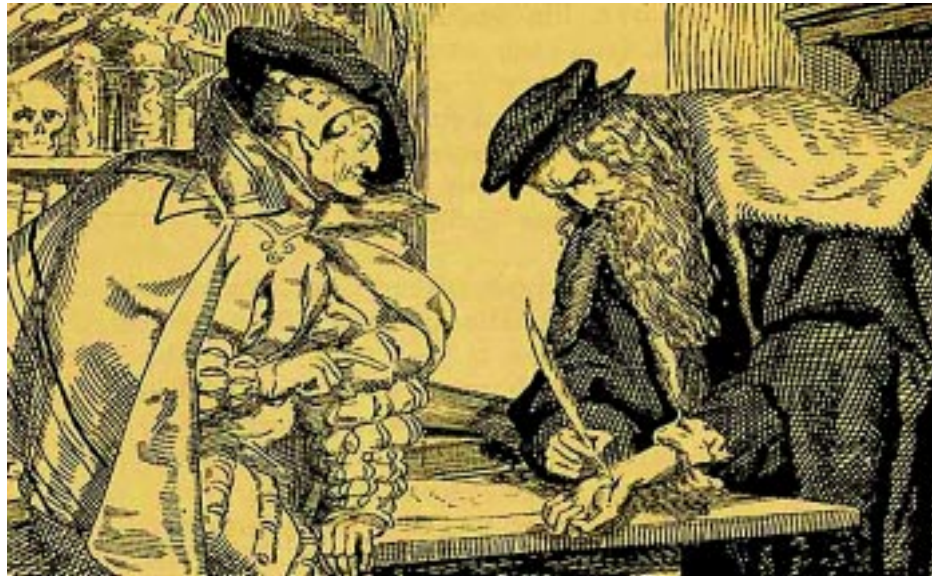
El pacto entre Fausto y Mefistófeles

forma a su Fausto para poder aligerar su mente de un peso tan enorme. Efectivamente, en aquél año y en los subsiguientes comenzó a dar rienda suelta al cúmulo de ideas que había ido elaborando en sus fraguas interiores.