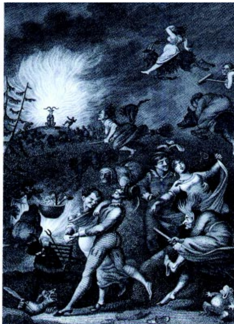
Aquelarre, fiesta satánica donde se adora un macho cabrío

En 1974, vino a El Salvador una cinta musical, titulada Phantom of the paradise, (Fantasma en el paraíso), cuyo argumento y líricas (Paul Williams), se basan en la obra del poeta alemán, incluso hay dos versiones de una canción titulada Fausto. Esto, quíerose o no, es una clara muestra de la inagotable influencia de este clásico de la literatura universal a través del tiempo y el espacio. Por supuesto que el cine con todo su glamour, no tiene la indiscutible gracia del detalle literario.