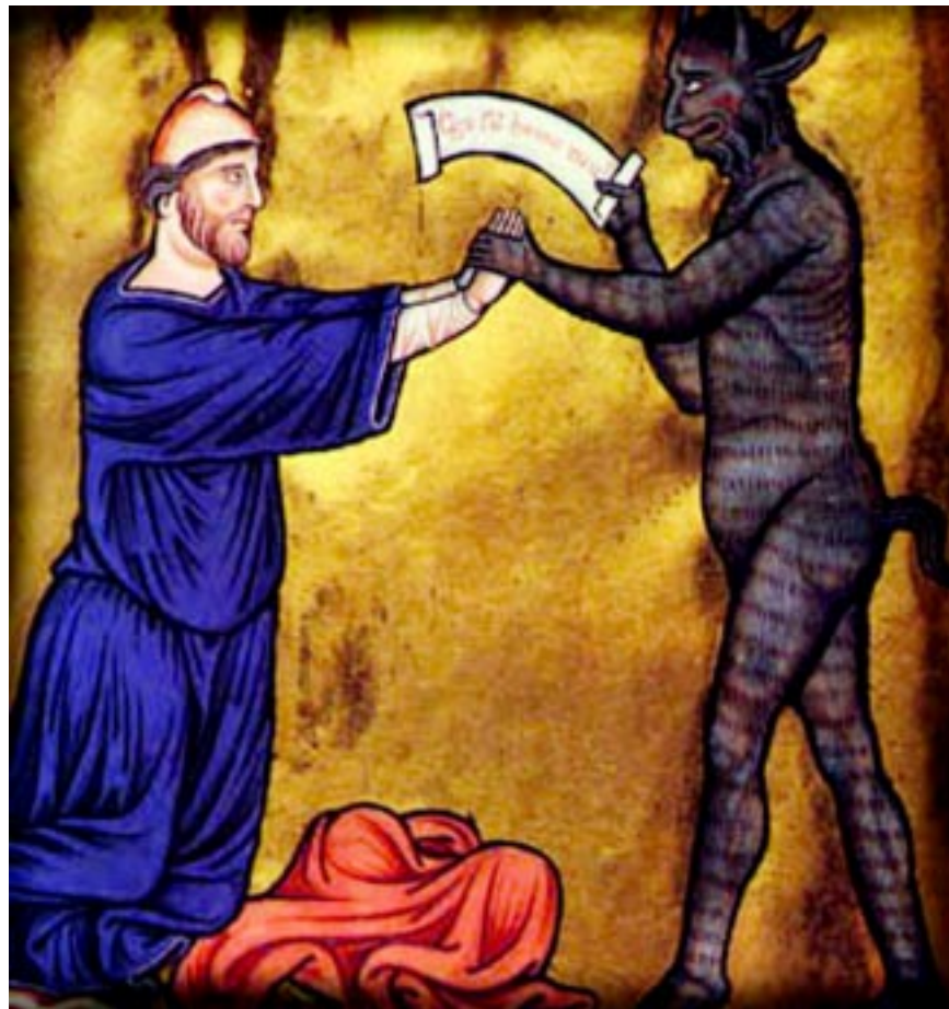
La tentación, el tema del Fausto en la obra de Goethe.

carga a Fausto sobre sus hombros y desaparece exclamando enfurecido: “¡He aquí lo que es encargarse de un loco!”. El sabio y el demonio vuelven al laboratorio de aquél, donde encuentran a Wagner, su criado, que ha conseguido crear un ser humano, ente diminuto que guarda en su redoma y al que da el nombre de “homúnculo”. El homúnculo lleva a Fausto y a Mefistófeles a los campos de Farsalia, en Grecia, donde se desarrolla la Noche Clásica de Walpurgis, extraño cuadro henchido de alegorías. Fausto pasa a Esparta y llega al palacio de Menelao; vuelve a encontrar -esta vez hecha mujer y no simple visión- a Elena de Troya .