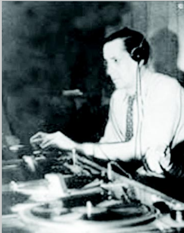
Alejo Carpentier en la radio

El 26 de diciembre de 1904 nació en Cuba quien habría de ser reconocido, años más tarde, como uno de los más grandes escritores de lengua castellana del siglo XX. Alejo Carpentier, de padre francés y de madre rusa, es considerado como el precursor del actual sello distintivo de la literatura latinoamericana. Desde la realidad particular de su continente, propugnó una lectura de la realidad novedosa, con un trasfondo surrealista, que más adelante se denominará realismo maravilloso.