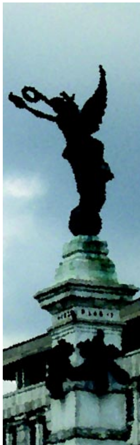
Plaza Libertad, San Salvador, El Salvador

me hizo caer... Exactamente como en la fábula del caballero y la herradura. Moter ¿Sólo las piernas ves? Goter Sí, sólo las piernas, hasta un poco abajo de la ingle... Y tú ¿qué ves? Moter ¡Oh, yo lo veo todo! Goter ¿Desde los pies hasta... la nuca? Moter Desde los pies hasta la nuca Goter Y... ¿Cómo está? Moter Un brazo ha quedado, retorcido, debajo del cuerpo. No veo ese brazo; pero me duele. Goter ¿Puedo preguntarte algo?