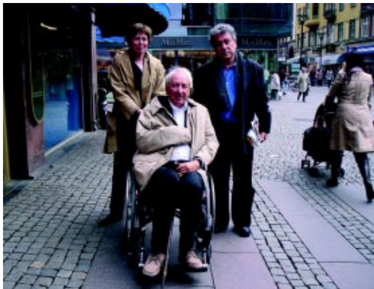
Tomas Tranströmer junto al poeta colombiano Juan Manuel Roca, en Malmö, Suecia.

El primero que divulga sus poemas es el periódico del colegio donde estudia bachillerato. Los versos allí publicados levantaron, sin embargo, la ira del profesor de