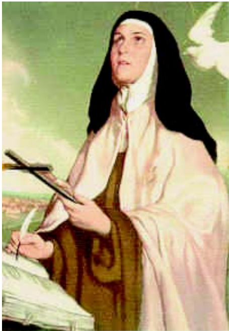
Santa Teresa de Jesús, la patrona de los escritores españoles

tos en Ávila; se obligó a la santa a regresar al convento de la Encarnación, y, calmados los ánimos, vivió Teresa cuatro años en el convento de San José con gran austeridad. Las religiosas adictas a la reforma de Teresa, dormían sobre un jergón de paja; llevaban sandalias de cuero o madera; consagraban ocho meses del año a los rigores del ayuno y se abstentaban por completo de comer carne. Teresa no quiso para ella ninguna distinción, antes bien siguió confundida con las demás religiosas no pocos años.