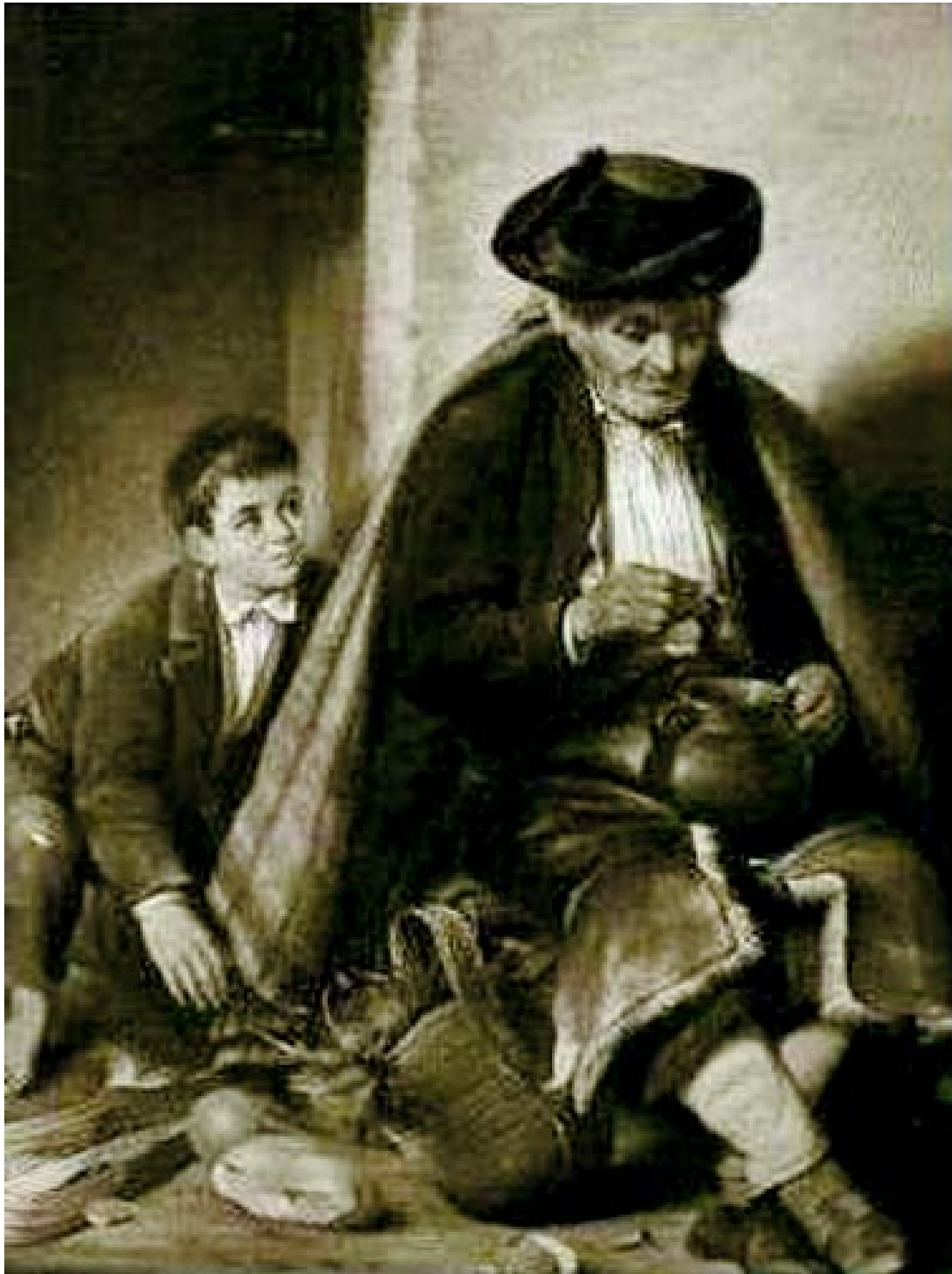
Lazarillo de Tormes, obra de la picaresca española.