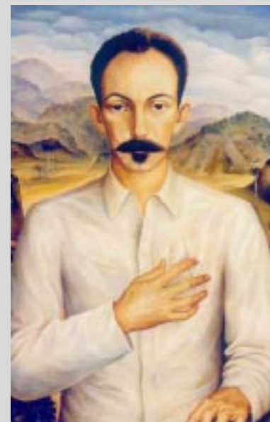
CARTAS A LA MADRE [1892]