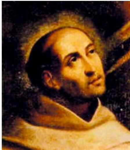
San Juan de la Cruz

En el reinado de Felipe II corresponde una de las manifestaciones literarias de mayor importancia que han conocido las letras hispanas: la literatura ascético-mística .