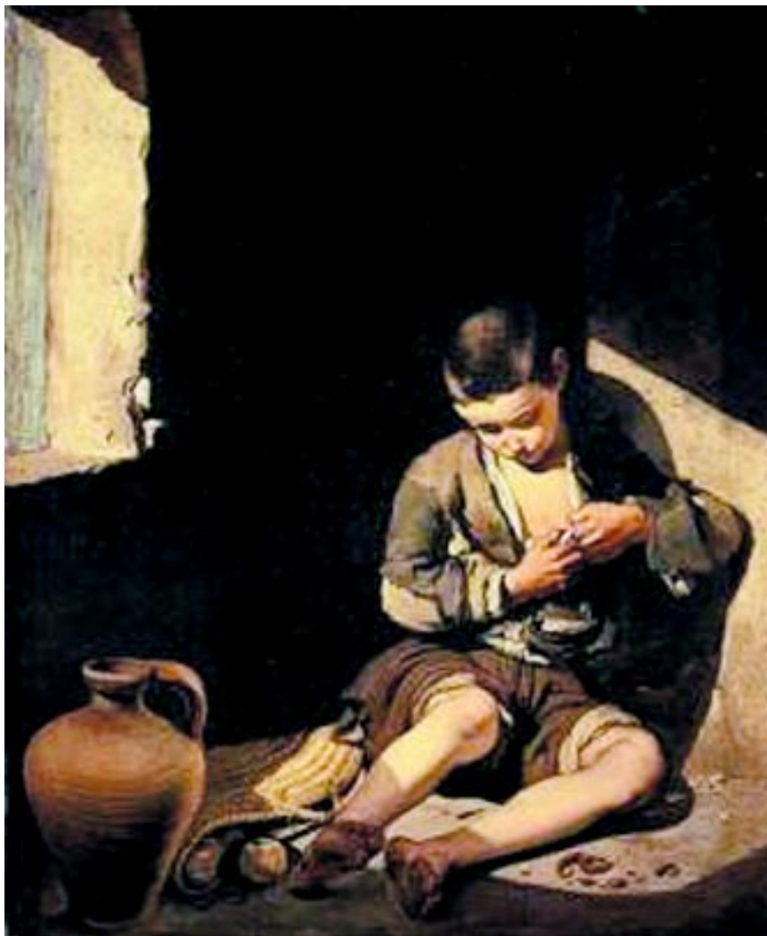
Lazarillo, como sobreviviendo nuestros niños salvadoreños

En general, el pícaro roza el hampa sin pertenecer a ella, la astucia que despliega para adherirse a la vida en la precariedad (por el engaño y no por el trabajo) traduce, paradójicamente, un desesperanzado vigor.