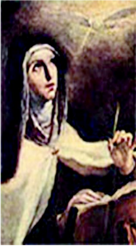
La mística Santa Teresa de Jesús

Teresa de Cepeda y Ahumada (Ávila o Gotarrendura, España, 28 de marzo de 1515 – Alba de Tormes, 4 de octubre de 1582) religiosa, Doctora de la Iglesia Católica, mística y escritora española; fundadora de las carmelitas descalzas, rama de la Orden de Nuestra Señora del Monte Carmelo (o carmelitas). También es conocida por el nombre de Santa Teresa de Jesús o simplemente Santa Teresa de Ávila.