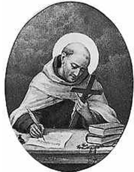
El escritor y teólogo

La ascética está, pues, en el camino de la mística, y de los tres momentos dichos: los dos primeros son comunes a ambas, quedando el último reservado para la segunda. En lo que atañe a su contenido, la ascética se basa en el ejercicio racional, mientras que la mística es puramente intuitiva. No puede llegarse a la cima de la perfección espiritual sin pasar por el camino de la ascética.