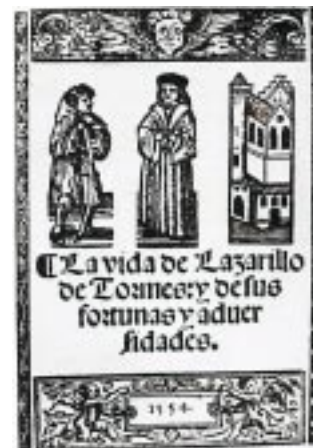
Portada del Lazarillo de Tormes, edición de 1554.

- http://faculty-staff.ou.edu/L/A-RoberT.R.Lauer-1/Mistica.html - http://www.los-poetas.com/f/biocruz.htm -Alvarenga, Luis. 2004. La poesía mística y San Juan de la Cruz. Diario Co Latino, Suplemento Cultural Tres Mil, sección Aula Abierta, No. 27, sábado 21 de agosto del 2004. -San Juan de la Cruz. Doctor de la Iglesia. Perfiles biográficos. La Noche oscura, poesías y escritos menores por el santo. www.mercaba.org/FICHAS/Santos/juandelacruz.htm - 9k