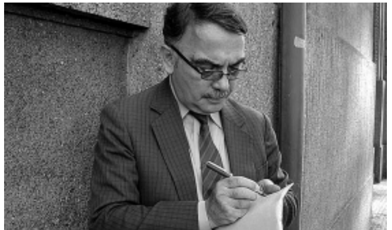
El poeta venezolano Eugenio Montejo

Toda poética es el inicio de un viaje que puede ser breve, mediano o infinitamente largo. La poética de un autor tiene que ver con su disposición de hacer el viaje y con el equipaje que lo acompañe para ese caminar por los mundos de la palabra. No es problema sólo de años, ni Rimbaud, ni Lautreamont, ni Miguel Hernández, necesitaron muchos para dejarnos obras definitivas.