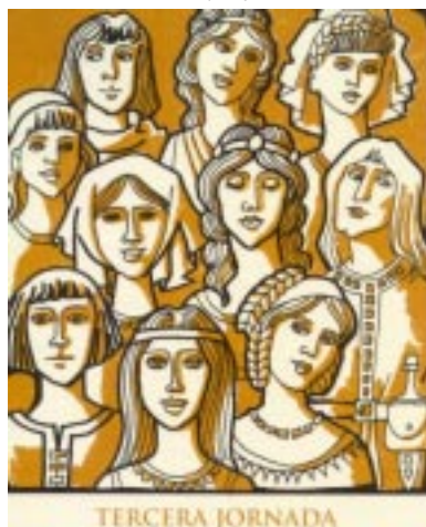
Los jóvenes narradores del Decamerón, reunidos por la peste negra, el azote de Europa.

Tienes razón; procura convencerle. Regálale unos zapatos y un vestido viejo, y dale bien de comer.