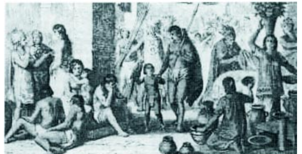
Aspecto de la colonización de América

Tomado de Aula Abierta 2004. Luis Alvarenga, editor.