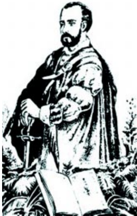
Bernal Díaz del Castillo.

Para comprender la conquista de América por los europeos, es necesario acudir, con sentido crítico por supuesto, a las versiones de los protagonistas. Una de esas versiones es la de Bernal Díaz del Castillo, soldado de las tropas de Hernán Cortés. Nacido entre 1492 y 1492, Díaz del Castillo era de familia pobre —como la inmensa mayoría de los buscadores de fortuna que se embarcaban hacia «las Indias»—. De esta forma, Díaz del Castillo se hizo a la mar bajo las órdenes de Francisco Hernández de Córdoba, quien dirigió una expedición hacia las islas caribeñas para capturar nativos y venderlos como esclavos. Esa expedición constituyó la primera ocasión en que los europeos avistaron las costas de Yucatán. La segunda vez que Díaz del Castillo se embarcó, fue al mando de Juan de Grijalva, y la tercera, que es la que nos ocupa, fue con Hernán Cortés, que realizaría la empresa de invadir el territorio azteca, conocido en la época como la Nueva España.