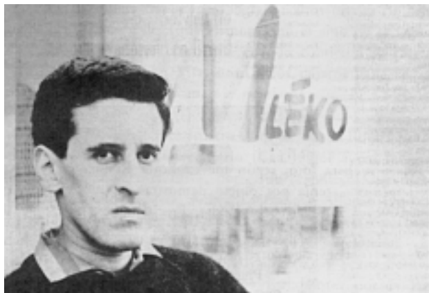
Dalton: polémico, mordaz, irónico.

El Libro de Dalton fue premiado por un jurado integrado por los escritores José Agustín Goytisolo, Efraín Huerta, René Depestre y Antonio Cisneros. Taberna fue publicado por la editorial Casa de las Américas, lo cual constituyó un reconocimiento importante para la obra de Dalton.