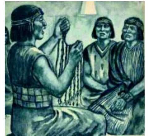
Los quipus, la escritura y registros incaicos

Ninguno de los jóvenes se atrevió a enfrentarlo, ni le contaron de su matrimonio secreto y de que Cusi-Coyllur estaba esperando