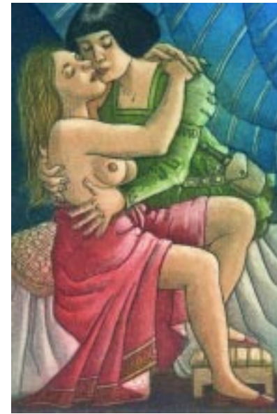
Jornada VIII, El mercader despojado, cuento que muestra la infidelidad humana.

Si así ha dispuesto Dios que deba yo dar comienzo a la presente jornada con mi historia, ello me place; y por ello, amorosas señoras, como sea que mucho se ha dicho de las burlas hechas por las mujeres a los hombres, una hecha por un hombre a una mujer me place contar, no ya porque yo entienda con ella censurar lo que el hombre hizo, o de decir que a la mujer no le estuvo bien empleado, sino por alabar al hombre y reprochar a la mujer, y por mostrar que también los hombres saben