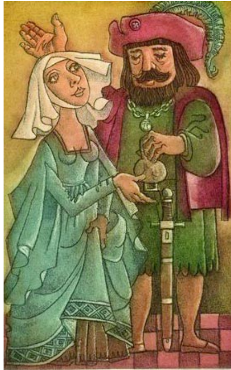
Gulfardo, el alemán. Jornada VIII, Novela 1.