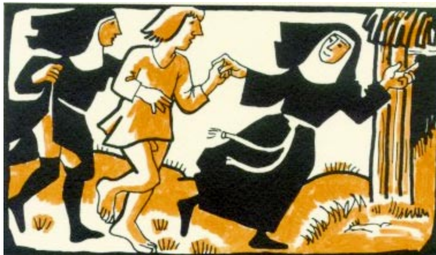
Masetto, fue seducido por las monjas. Un demolidor cuento contra la hipocresía del clero católico.