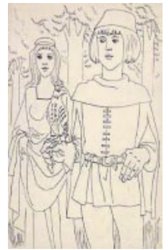
Federigo, el amante leal, sacrifica su único y querido halcón para agasajar a su amada.

-Señora, desde que plugo a Dios que en vos pusiera mi amor, en muchas cosas he juzgado que la fortuna me era contraria y me he dolido de ella, pero todas han sido ligeras con respecto a lo que