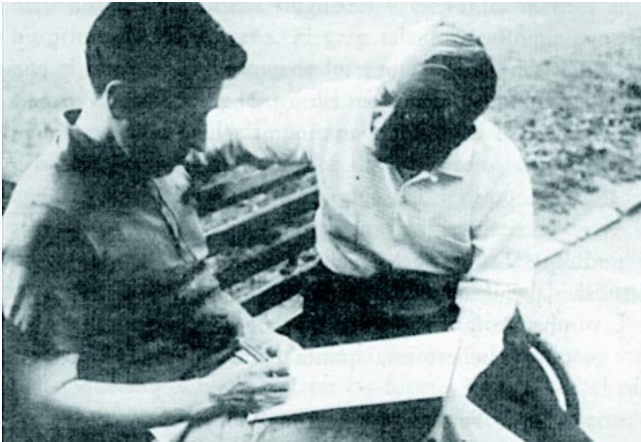
Roque Dalton, entrevistando a Miguel Màrmol en Praga, Checoslovaquia.

socialismo, una visión de mundo radicalmente conservadora. Pero estas visiones de mundo no son ilegítimas. El poema de Dalton también nos está hablando de una crítica sin concesiones al autoritarismo y la intolerancia ideológica. Nos está diciendo que el socialismo de inspiración estaliniana confundió la utopía con el campo de concentración y el uniforme: nos dice también que el socialismo, como lo pensó Marx, era el reino de la libertad. Por lo que puede deducirse del pensamiento de Roque, que éste preconizaba un socialismo de inspiración humanista y profundamente democrático.