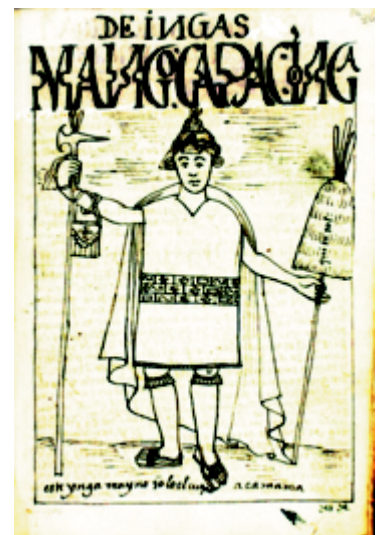
Ollantay, obra quéchua

El prisionero Ollantay, preocupado por la situación en que se encontraba, la poco honorable muerte que le esperaba, y el ignorar qué había sido de su esposa y de su hija, fue llevado al mediodía ante el nuevo Inca, al que conocía desde chico. Cuando el Inca Túpac Yupanqui le increpó por su rebelión, Ollantay expuso sus ideas, diciendo que no se rebeló contra el Inca sino contra las injustas leyes del imperio, que un hombre puede ser Dios y otro simplemente humano,