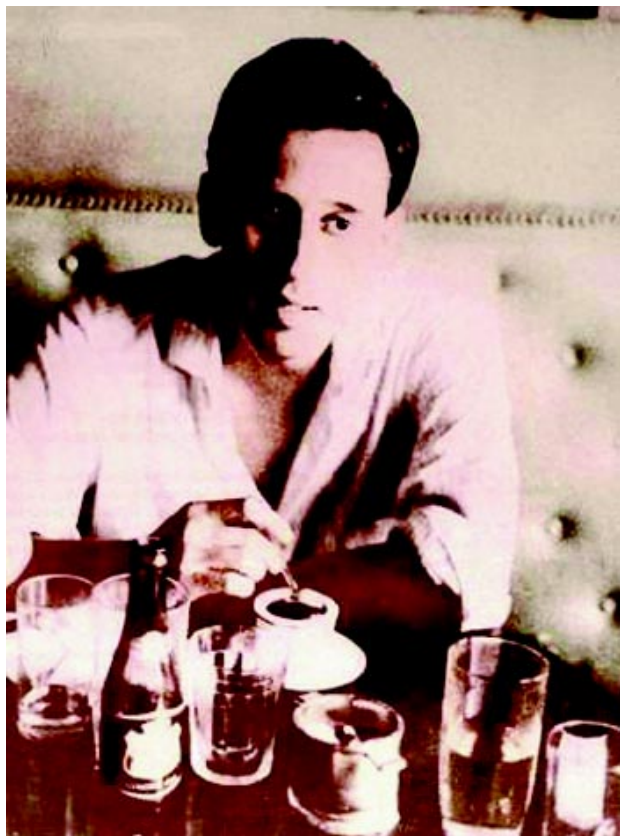
Roque Dalton García

Era el año 1966. En Praga, fue comisionado por el Partido Comunista de El Salvador para formar parte del equipo de redacción de la Revista Internacional, órgano de los partidos comunistas que mantenían afinidades con la URSS, no era, con todo, un hombre que vivía con privilegios.