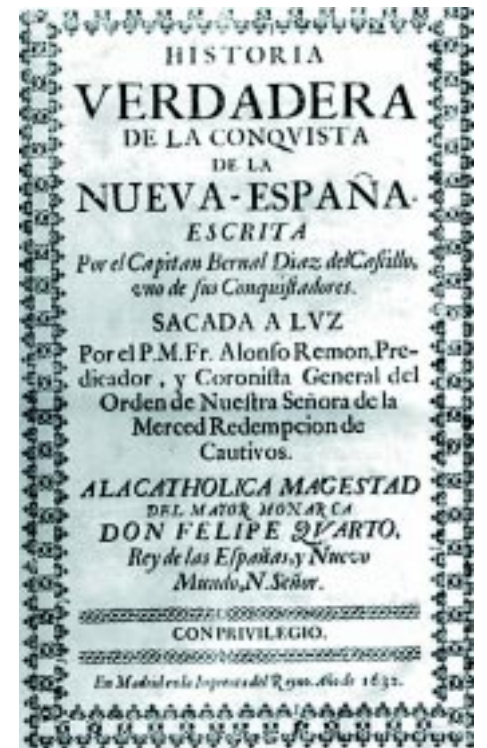
La edición de 1632.

Pedro de Alvarado estaba cercado y México rebelado... Cortés habló a los de Narváez: que sintió que no irían con nosotros de buena voluntad a hacer aquel socorro, y les rogó que dejasen atrás enemistades pasadas por lo de Narváez, ofreciéndoseles de hacerlos ricos y darles cargos. Cortés que llevaba gente para poder entrar muy a nuestro salvo en México; y demás de esto, en Tlaxcala nos dieron los caciques dos mil in-