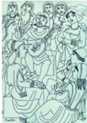
Los narradores alternos cada día, disfrutaban de las jornadas.