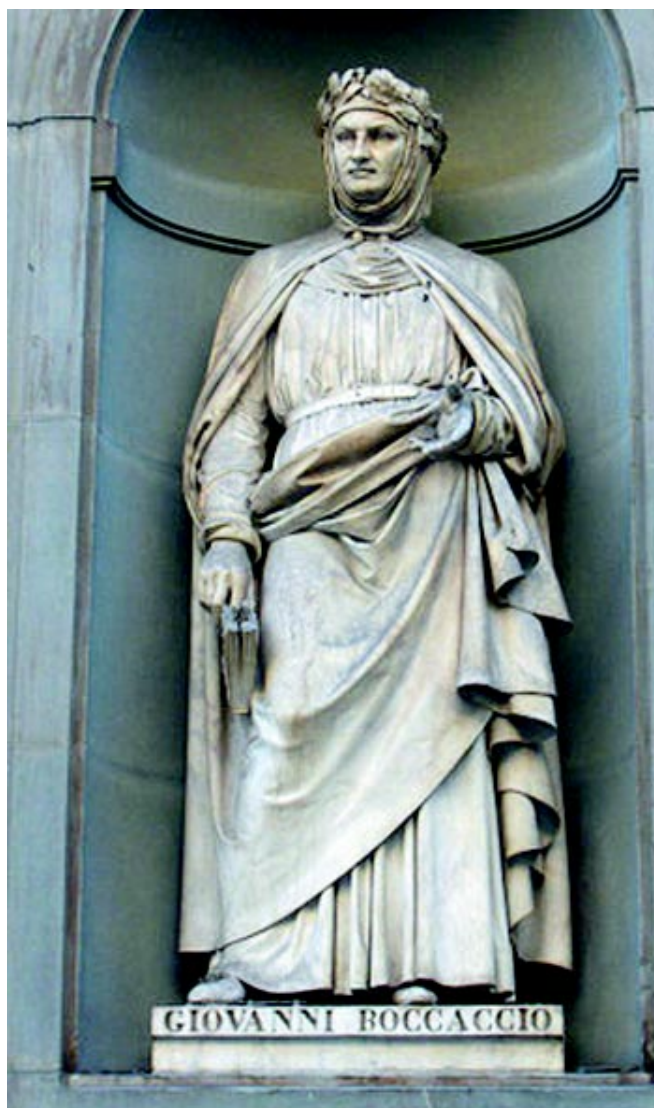
Estatua de Boccaccio