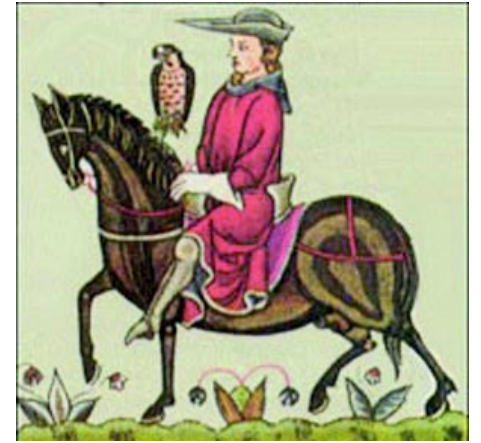
Pero no tengo más que un halcón de cetrerías... lamentaba el que amaba sin ser amado.

Y sin pensarlo más, quitándole el collar, a una criada lo hizo prestamente, pelado y condimentado, poner en un asador y asar cuidadosamente; y poniendo la mesa con manteles blanquísimos, de los que aún tenía algunos, con alegre gesto volvió