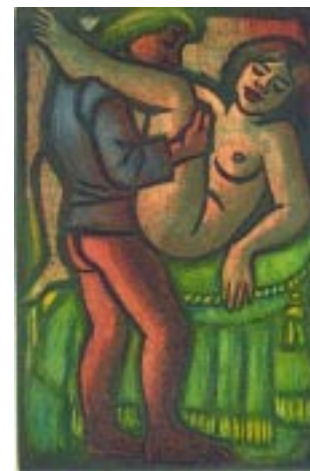
Jornada III, Cuento el Palafrenero. Siempre aflora la condición humana.