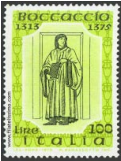
Sello italiano de Boccaccio

me hacen en este momento, con lo que jamás podré estar en paz con ella, pensando que vos hayáis venido aquí a mi pobre casa cuando, mientras que fue rica, no os dignasteis a venir, y me pedáis un pequeño don, y ella ha hecho de manera que no pueda dároslo; y por qué no puede ser os lo diré brevemente. Cuando oí que deseabais por vuestra bondad comer conmigo, considerando vuestra excelencia y vuestro valor, reputé digna y conveniente cosa que con más preciosa vianda dentro de mis posibilidades debía honraros que las que suelen usarse para las demás personas; por lo que, acordándome del halcón que me pedís, y de su bondad, pensé que era digno alimento para vos: y esta mañana, asado lo habéis tenido en el plato, y yo lo tenía por óptimamente albergado, pero al ver ahora que de otra manera lo deseabais, siento tal duelo por no poder serviros que creo que nunca podré tener paz.