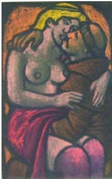
La bella e ingenua Alibech, disfruta de meter el diablo en el infierno, con el monje Rústico en la desolada Tebaida.

-¡Alabado sea Dios! Ya veo que estoy mejor que tú, pues no tengo ese diablo.