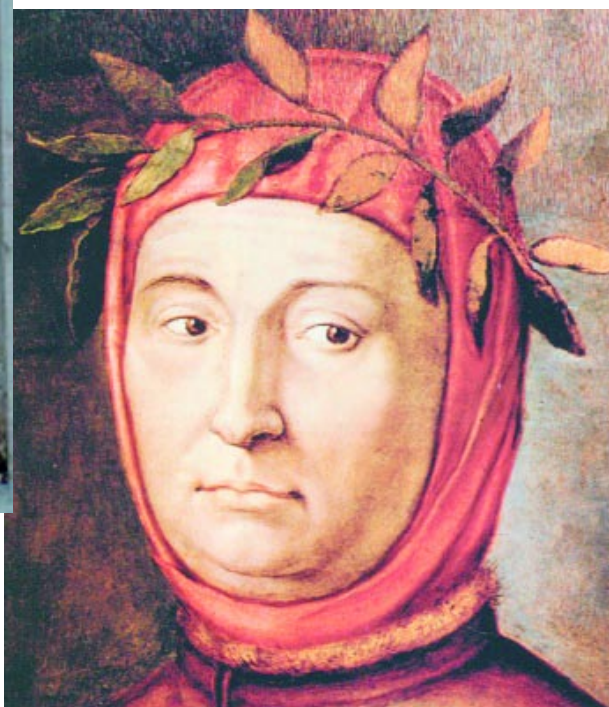
El gran escritor Francisco Petrarca