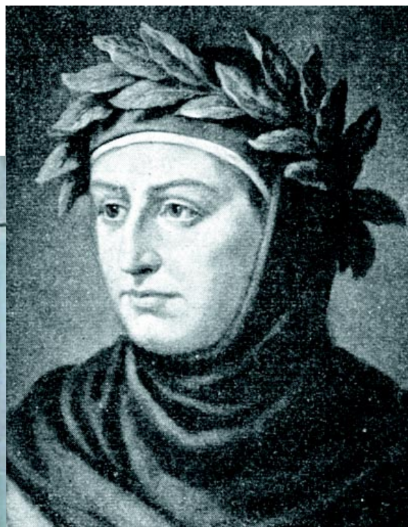
El escritor Giovanni Boccaccio