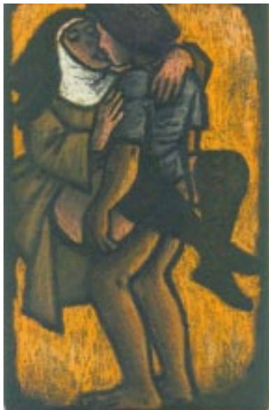
Masetto, amante del convento entero.