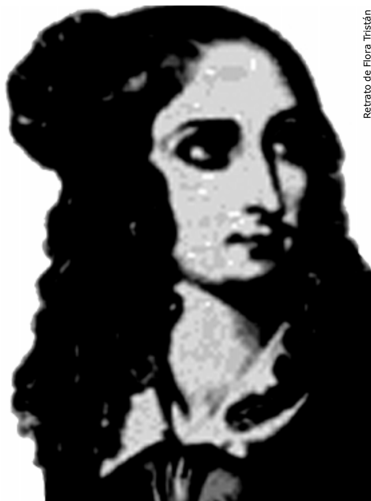
Retrato de Flora Tristán

1973: Aparecerá tardíamente sus apuntes personales bajo el título de Diario