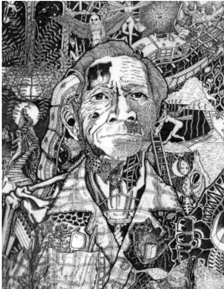
Ulises. Dibujo de Dagoberto Nolasco.

Aquí cualquier tipo de repente se puede aparecer con una camiseta y un fragmento de un dibujo tuyo y vos no percibís nada de eso, ¿no creés que como creador que tenés derecho? Claro que sí, pero dedicarse al arte totalmente aquí es un problema.