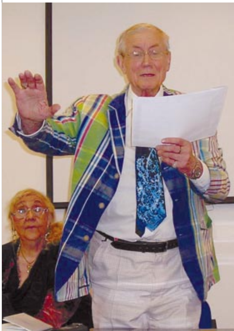
Eugueni Evtushenko (Rusia)