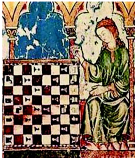
El juego del ajedrez, pasatiempo de origen medieval.

Pero también favorecieron el enriquecimiento de la prosa española, el perfeccionamiento del idioma y de la literatura.