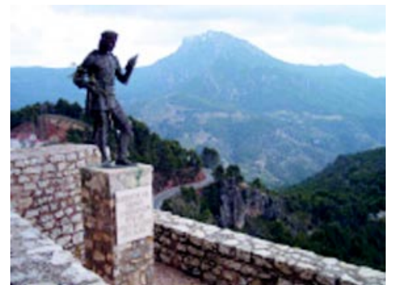
Monumento a Jorge Manrique, España.