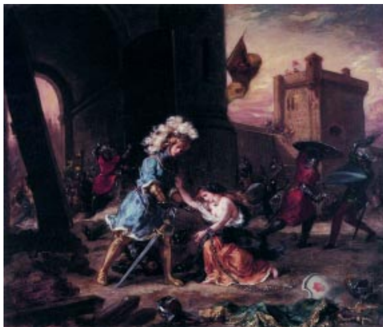
Amadís de Gaula, según Delacroix, Francia.