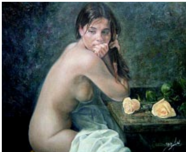
Amo tu desnudez, porque desnuda me bebes con los poros.

Qué contentas y qué tristes se pusieron las canasteras contra las cuales el viejo de mierda echaba su caballo borrachera tras borrachera tras la misma sopa de sandías y matasanos en el suelo mugroso del Mercado Central