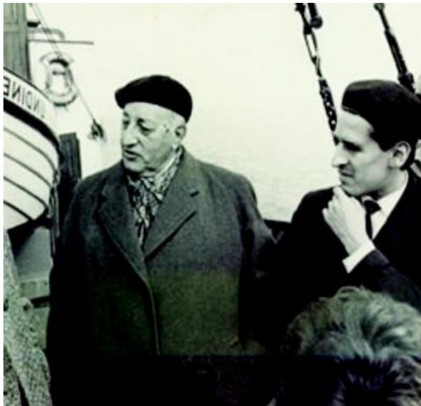
Roque Dalton, junto a Miguel Ángel Asturias

El carácter de esta obra, como toda buena obra hija de Roque, es desmitificador. Su sondeo de la realidad es implacable para darnos una visión más completa y específica de la simple noción de patria almidonada y planchada que solemos percibir producto de la demagogia y la ensoñación, factores que merced al desinterés, abonan la ignorancia sistematizada con sus llamativos y coloridos frutos, los que a la larga son los que nos alejan de nuestra propia