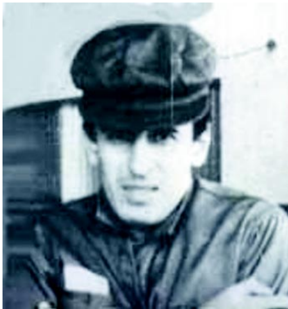
Uno y su cara de santón farsante.

Claro que luego pagaban el doble del valor de la fruta en la puerta de la cocina de Casa Presidencial a las que salían sanas y salvas de entre las patas del caballo