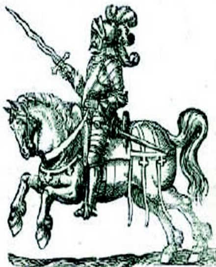
La novela de aventuras de caballeros, se denominaba novela caballeresca. Fue un género con numerosos lectores y soñadores.