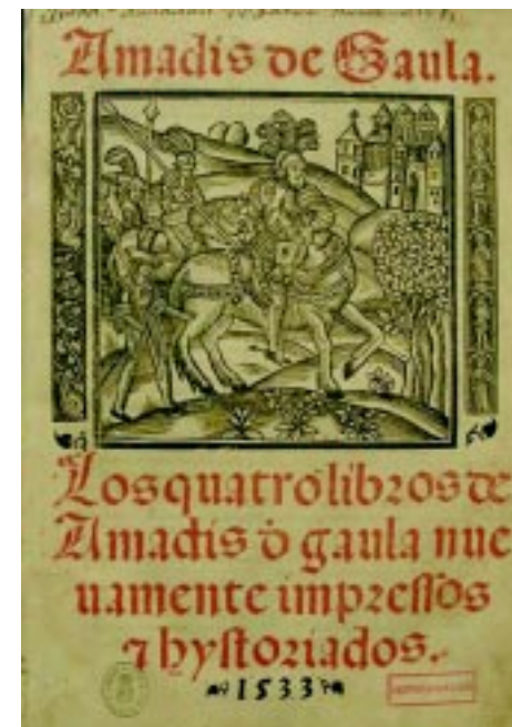
Portada del Amadís de Gaula, que data de 1533.

Se le llama también arte protocristiano. A él corresponden las obras artísticas de los cristianos