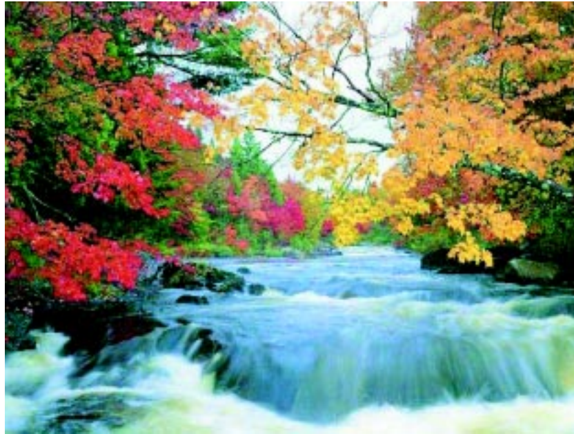
Los ríos de Manrique.

Toda su fama descansa en las llamadas Coplas ,