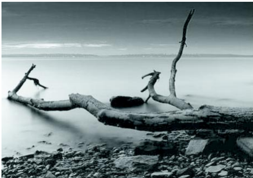
Nuestras vidas son los ríos, que van a dar en el mar, que es el morir.

Los estados y riquezas Que nos dexan a deshora ¿Quién lo duda? No les pidamos firmeza