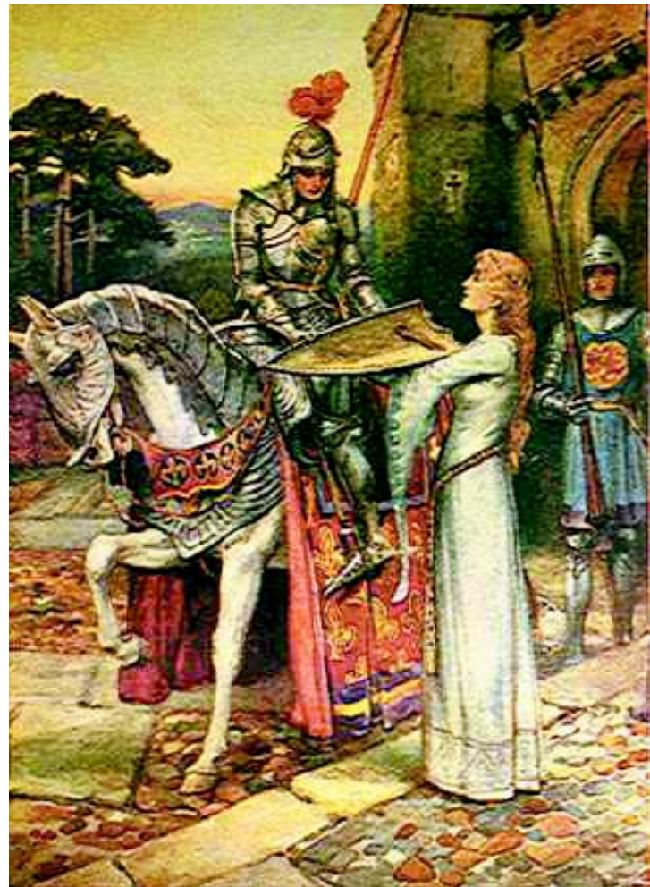
Caballero andante y su amada, a quien dedica sus luchas y victorias. El desgarrante amor medieval, siempre presente. El tema de la amada, es uno de los más fuertes e inspirados en toda la literatura medieval.

el moro que a mí me tiene muy grande bien me quería.