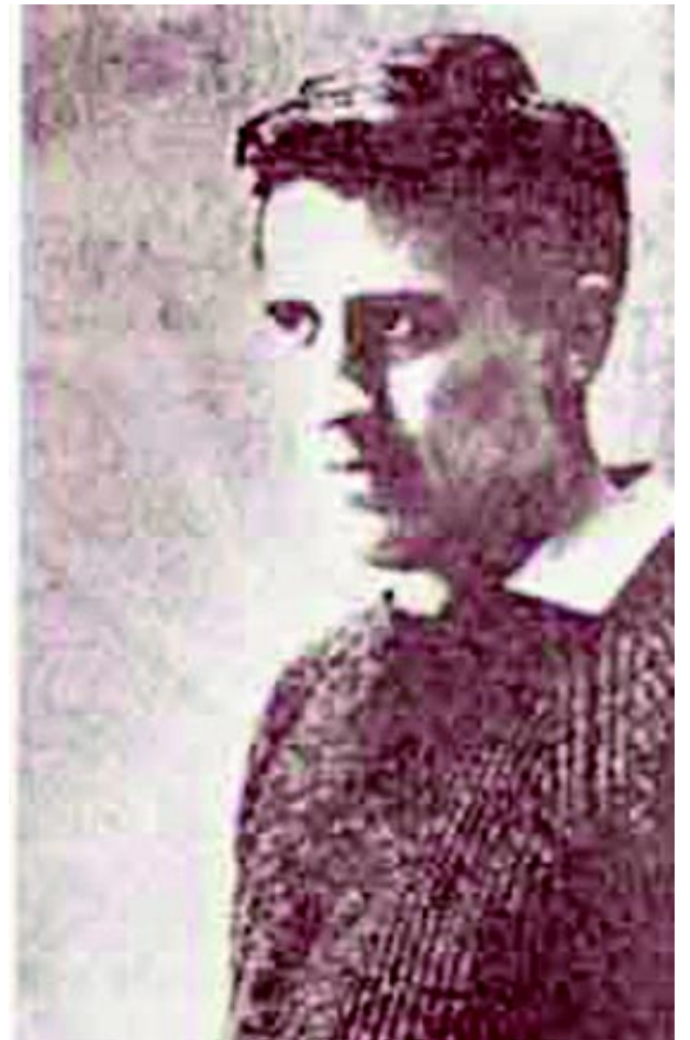
El poeta salvadoreño Roque Dalton García.