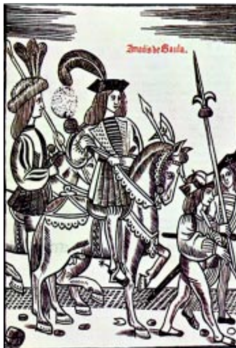
Amadis, héroe inculdiabile.

por medio de luces, colores, decoración y líneas arquitectónicas. Cambios similares se operan en pintura y en escultura: el gótico revela ya en forma más perceptible las formas del cuerpo humano; la expresión de los rostros se torna más dulce, a veces hasta se admite la sonrisa; los velos y mantos pierden importancia. En pintura se inició la perspectiva, es decir, la impresión de profundidad, cualidad totalmente desconocida durante los períodos anteriores.