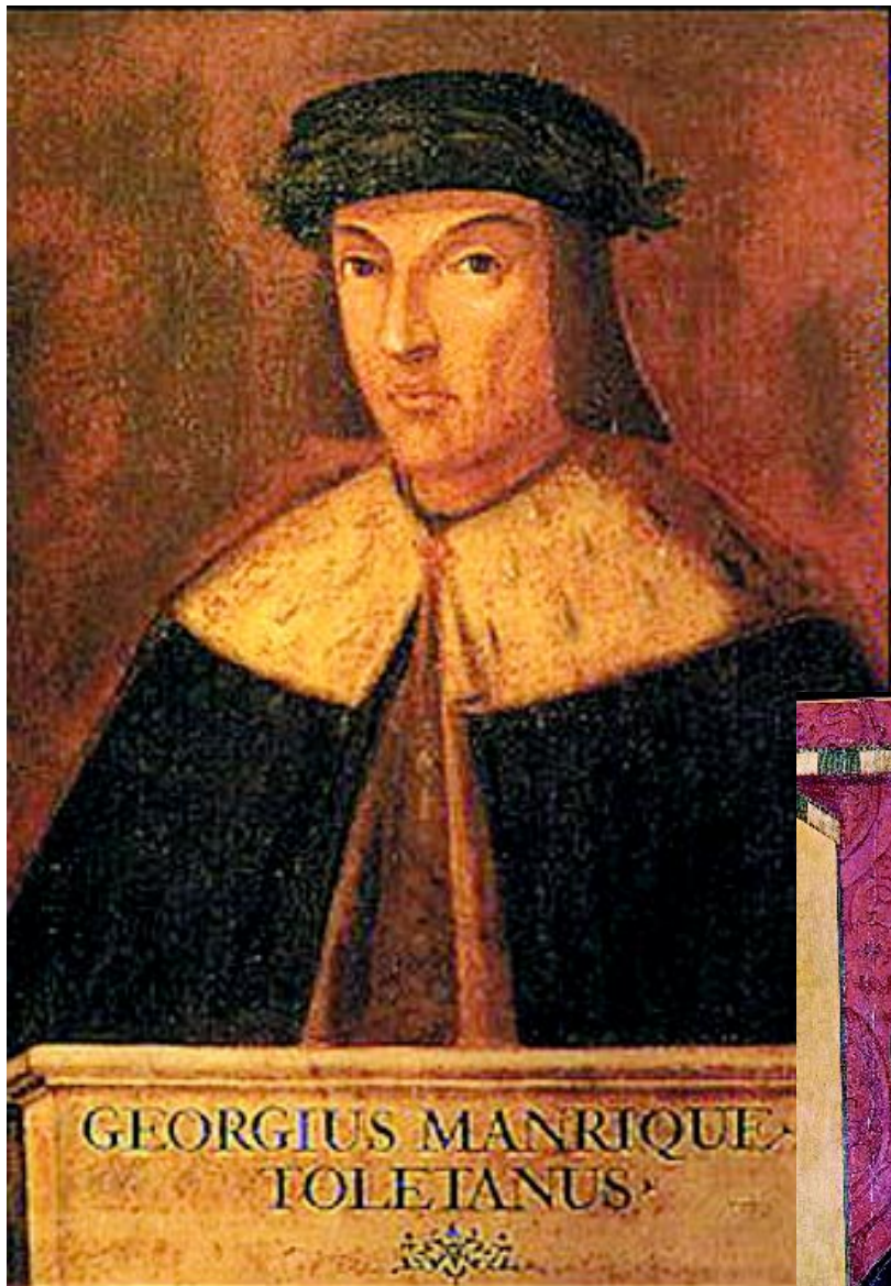
Jorge Manrique, autor de las famosas coplas.

... Nuestras vidas son los ríos Que van a dar en el mar, Que es el morir; Allí van los señorios Derechos a se acabar Y consumir; Allí los ríos caudales Allí los otros medianos Y más chicos; Allegados, son iguales Los que viven por sus manos Y los ricos... (Jorge Manrique)