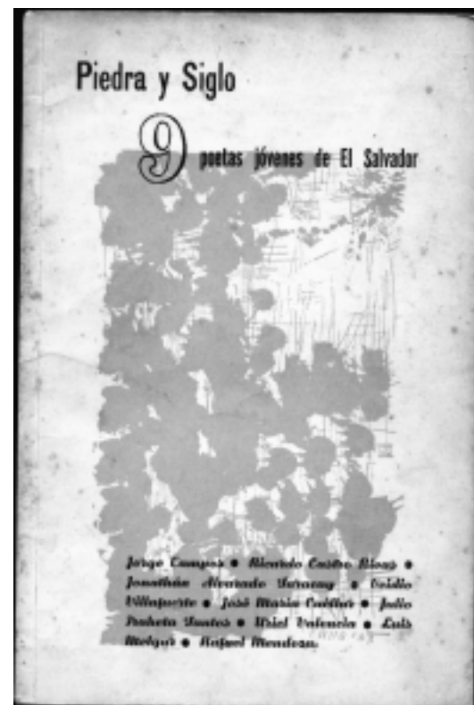
Mayo 2007: Actividad dedicada a Piedra y Siglo.

Vamos a la poesía, Estrella Distante. Ya no hay frutas dulces en mis campos, solo palabras que nutren y limpian el alma. Hay que perdonarnos cada instante, siempre, por el resto de los días.