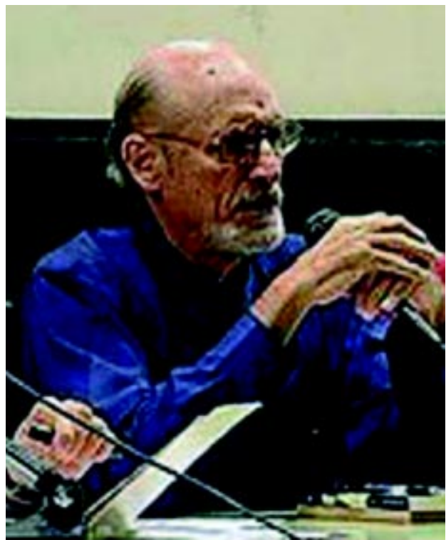
Roberto Fernández Retamar

Con una desafiante dureza en sus miradas y el empecinamiento de los inconformes