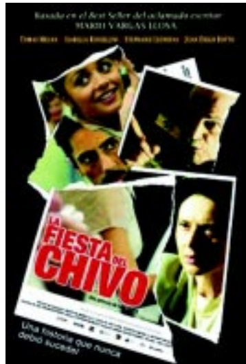
Afiche de la película «La fiesta del chivo»

El filósofo Hegel escribía hace 200 años de que el pueblo se equivoca cuando escoge o mejor aprueba a sus dictadores o a sus generales para que administren justicia y velar por sus derechos civiles. Tal vez por la falta de experiencia, ya que por milenios no ha sido si no un pueblo esclavo, que no conozca la aptitud correcta a asumir, y se tire a las calles a llorar la muerte de un dictador sanguinario, como ocurre en el filme "La fiesta del chivo", 2006, del director peruano Luis Llosa, primo del escritor Mario Vargas Llosa, y del libro del mismo nombre del renombrado Mario.