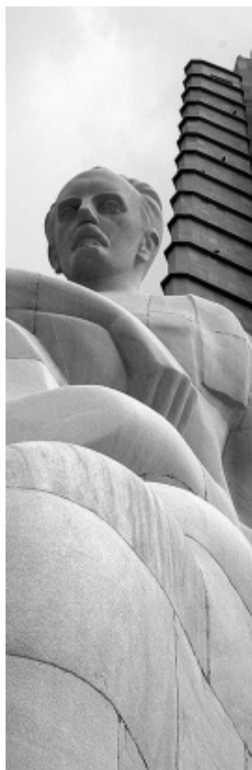
Monumento a José Martí, en La Habana, Cuba.

Firmado en La Habana, Cuba, el 2 de junio de 2007, al final del 12 Festival Internacional de Poesía de La Habana.