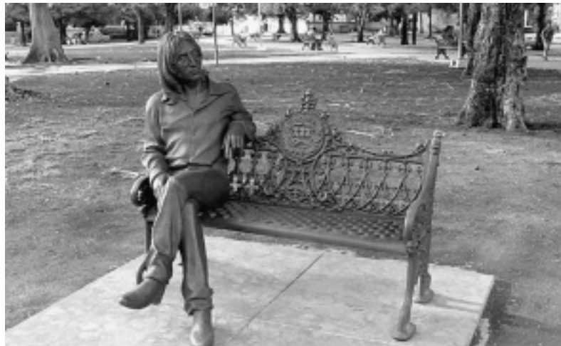
Monumento a John Lennon en La Habana, Cuba.

Más de cien poetas de cuarenta países reunidos en La Habana en la 3ra Junta Mundial de Poetas por la Paz en Defensa de la Humanidad , convencidos de que nuestra acción puede contribuir a una movilización planetaria de la conciencia mundial para la creación de una sensibilidad resistente, en la que al hombre le sea éticamente consustancial y natural la lucha contra la guerra, el hambre y la injusticia, en aras de la preservación de la vida en la tierra, hacemos un llamamiento a todos los hombres y mujeres del mundo, sin distinción de raza, cultura, religión, ideología, credos políticos o filosóficos, a convertir su preocupación ciudadana en hechos concretos que puedan cambiar la configuración de un mundo, en el que ya no es posible vivir sin espantarse: