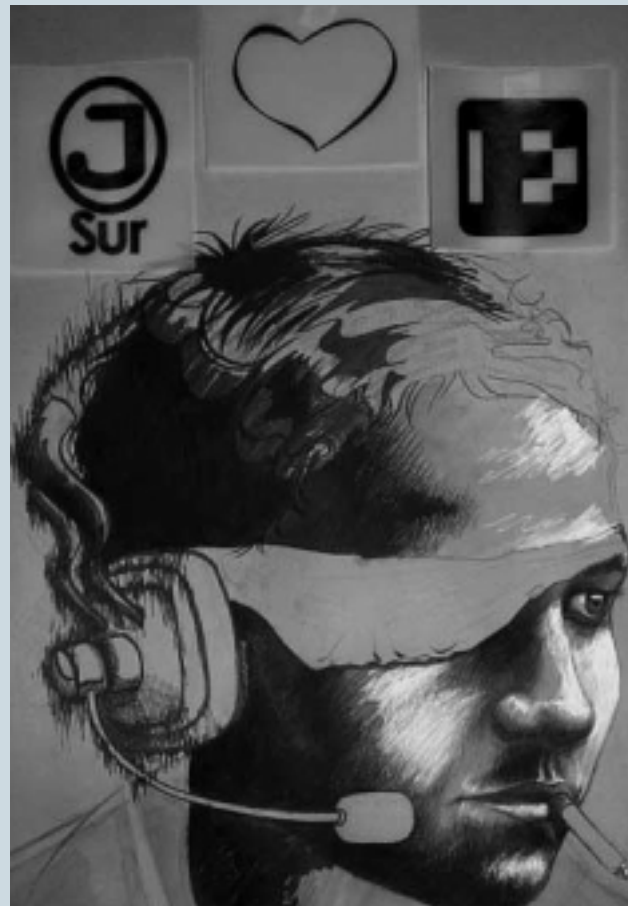
Quinto Salón de Dibujo

El dibujo es el punto de encuentro entre la mente del creador y su mano, si bien se puede considerar como la primera fase del diseño y de toda creación plástica, es una herramienta de expresión creativa autónoma y que puede trascender en obras de arte de mucho valor.