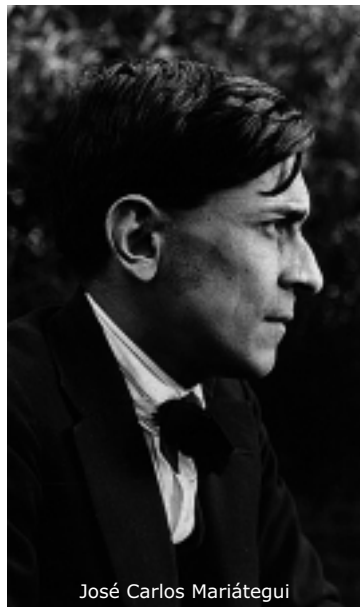
José Carlos Mariátegui

Un barco anclado espera en el puerto del Callao. El viento del mar lo bambolea y sus costillas de viejas maderas crujen al paso de las olas. Pronto zarpará para remontar la profundidad de las aguas que separan a Perú del Viejo Mundo. Mientras tanto un joven bohemio, de rostro afilado y nariz de gavián, apresura entre la maleta de viaje un par de calcetines zurcidos y unos versos a medio acabar. Y para espantar nostalgias, también mete entre la boca del equipaje un ejemplar de la revista «Propaganda y ataque» de su co-terráneo Manuel González Prada. Cuando el barco leve anclas, Lima quedará sin la presencia física de José Carlos Mariátegui, quien abandona Perú contra su voluntad. Una vez mar adentro, en la barriga gigante del crucero, el joven bohemio solloza porque siente que el destierro es de las desgracias la peor. Cabizbajo, con las alas del sombrero incrustadas entre sus huesudos dedos, recuerda el verso Los heraldos negros de su amigo, el cholo César Vallejo: