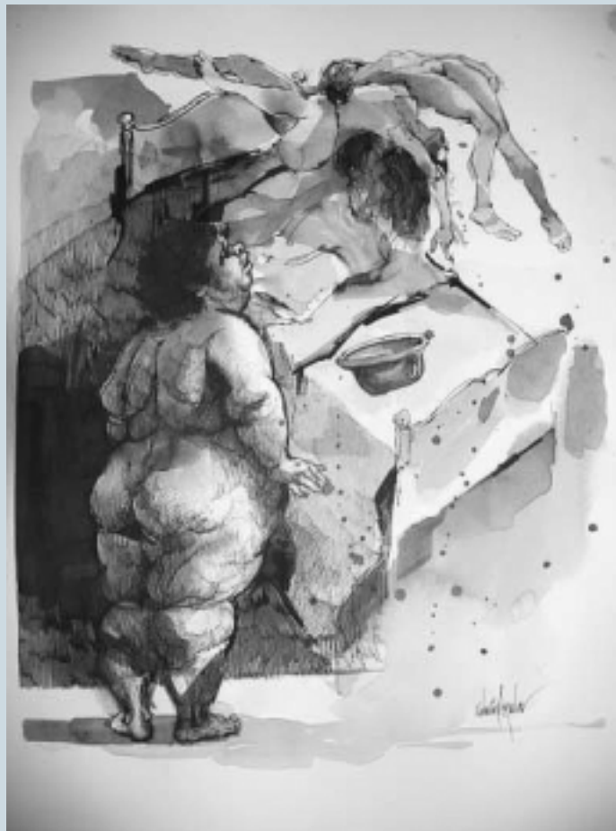
Quinto Salón de Dibujo

persistencia en el dibujo nos da la posibilidad de aproximarnos cada vez más a nuestra facultad creativa. La disciplina del dibujo es una herramienta, que no debe ser menospreciada por los artistas contemporáneos, porque aunque existan nuevos caminos hacia la creación visual, el ejercicio psicomotor de esa herramienta tiene una necesidad primaria, no se puede comprar, se adquiere con la práctica.