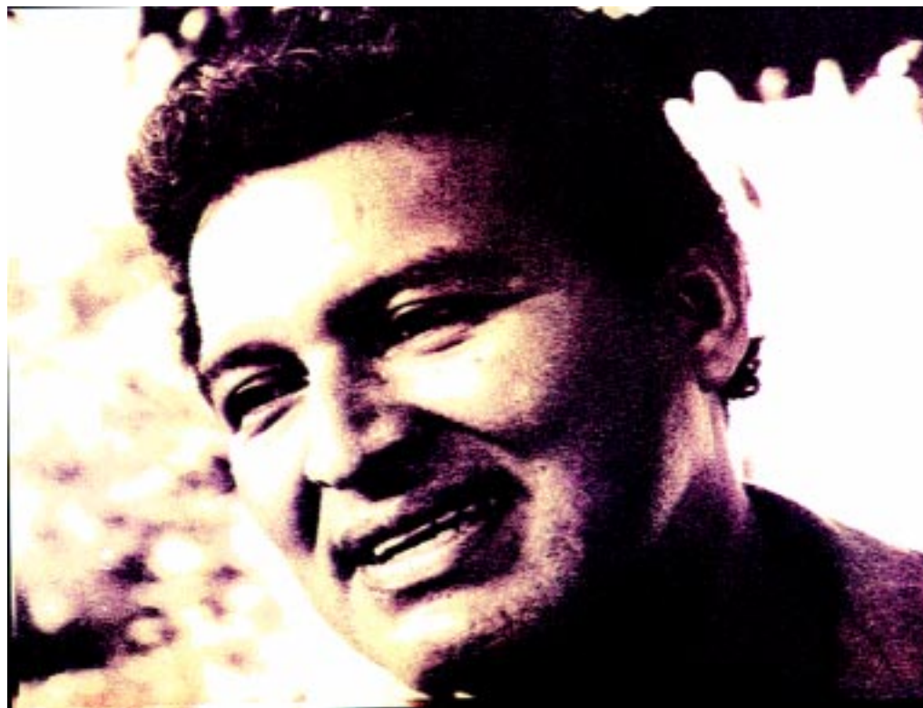
Salvador Sánchez Cerén, autor del libro Con sueños se escribe la vida .

Y dado que quienes comentamos también estamos atados a nuestros enfoques particulares, no quiero peder oportunidad de aclarar que mis valoraciones las hago desde dos puntos de vista muy específicos: como joven universitario en estos días difíciles que nos toca vivir (en la única universidad pública del país) y como joven salvadoreño, deudor del proceso de guerra que ha marcado los derroteros de nuestra nación en las casi cuatro décadas recién pasadas, deseoso de recoger la herencia de lucha y pensamiento crítico que nos han legado las ge-