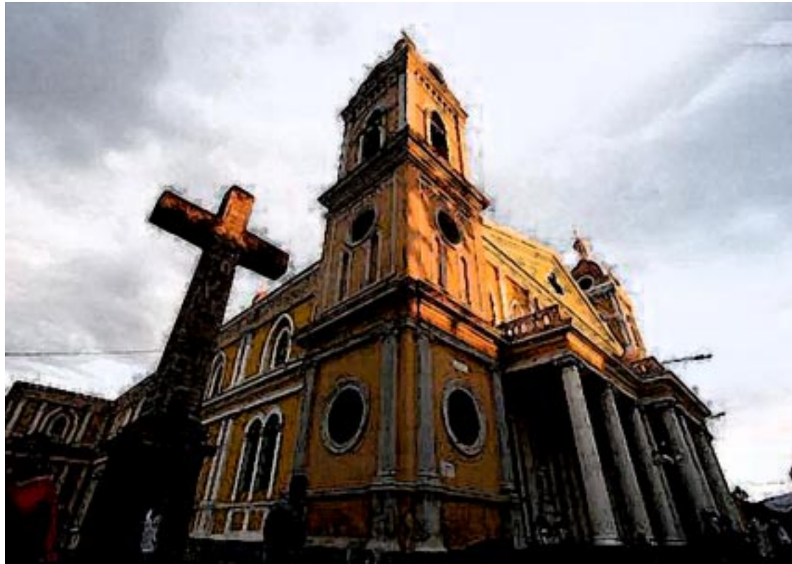
La Catedral de Granada.

Y es que la cobertura mediática y el despliegue publicitario del Festival de Poesía, termina alcanzando hasta a los turistas que estaban en la ciudad durante estos días por pura casualidad. "Vinimos aquí el do-