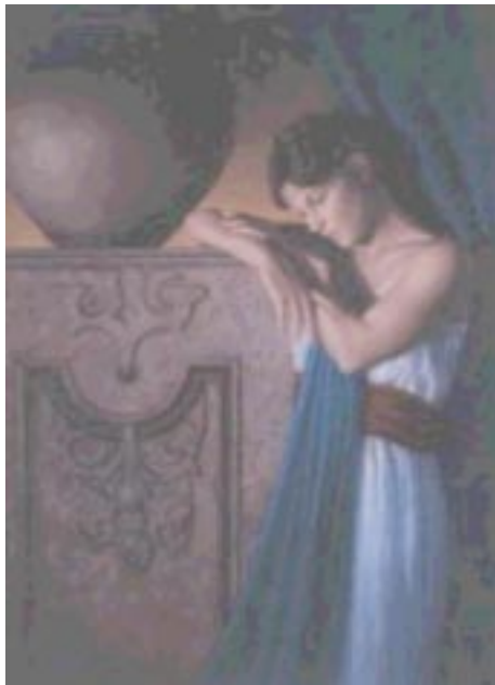
El drama y la comedia griegas.

3) El arte: El tema de arte aparece en sus obras en un sentido específico: para burlarse de las nuevas corrientes y estilos. Dentro de esta temática, su víctima predilecta fue Eurípides, a quien acusaba de haber degenerado la Tragedia, de irrespetar a los dioses y héroes, representándolos en forma vulgar. En Las Ranas , hace aparecer a Eurípides como un corruptor del arte, lo retrata en forma vulgar, hiriente. Le atribuye acciones humillantes y lo hace blanco del desprecio