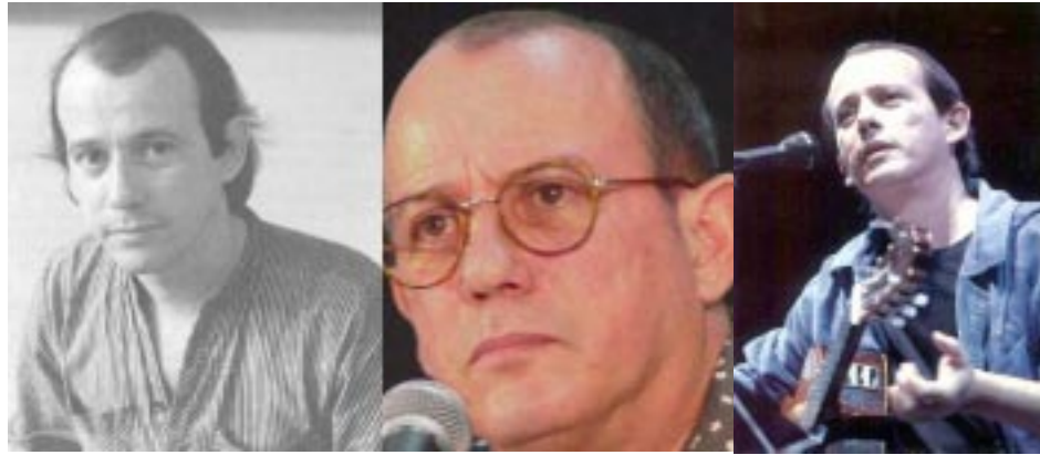
Silvio Rodríguez, al pasar de los años. El cantante y poeta cubano realiza una gira por Centroamérica.

Entre las luces más bellas, duerme intranquilo mi amor porque en su sueño de estrellas, mi paso en tierra es dolor.