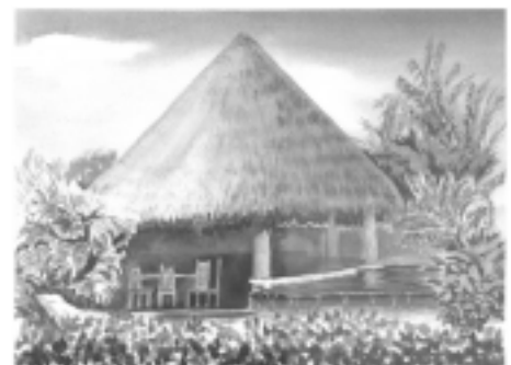
Rancho de Centroamérica.

Los persas fueron pueblo de mucho poder, como que hubo tiempo en que todos esos pueblos de los alrededores vivían como esclavos suyos. Persia es tierra de joyas: los vestidos de los hombres, las mantas de los caballos, los puños de los sables, todo está allí lleno de joyas. Usan mucho del verde, del rojo y del amarillo. Todo les gusta de mucho color, y muy brillante y esmaltado. Les gustan las fuentes, los jardines, los velos de hilo de plata, la pedrería fina. Todavía hoy son así los persas; y ya en aquellos tiempos eran sus casas de ladrillos de colores, pero no de techo chato como las de los egipcios y hebreos, sino con una cúpula redonda, como imitando la bóveda del cielo. En un patio estaba el baño, en que echaban olores muy finos; y en