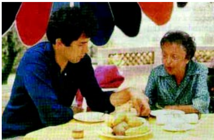
Editt Piaf y Teo Sarapo

No hay párrafo menor que pueda describirla, con sus sutiles colores y esa futilidad que le da el poker a los afortunados perdedores.