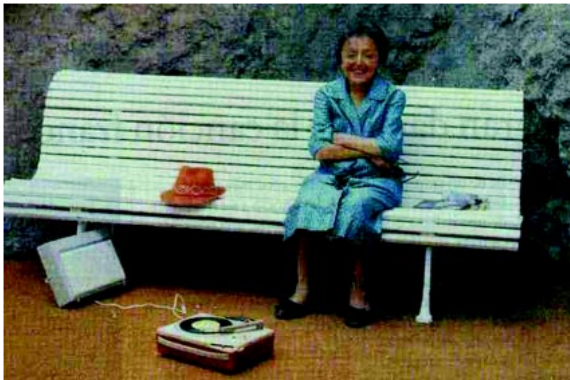
Editt Piaf en sus últimos días de vida en París.

Si parece que la estuviéramos viendo sus grises y ubicuos simpatizantes, del brazo del griego Teo Sarapo (vestido de negro, tal vez presintiendo su desaparición), su último gran amor, porque esos sí contaban para ella, no clientes de prostíbulo, que le tocó sumar cuando se crió allí, por razones sociales...Pero sigamos: en el Olimpia de París, cantando como dos enamorados que saben que van a partir por diferentes rumbos. Digo, en aquella foto que no apareció en la película, y que podría ser su segunda parte, a partir de esa última interpretación de "No, je ne regrette rien".