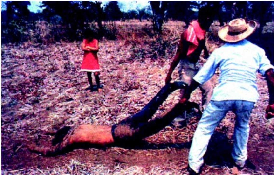
Campeños arrastran el cadáver de un hombre en Tecoluca.