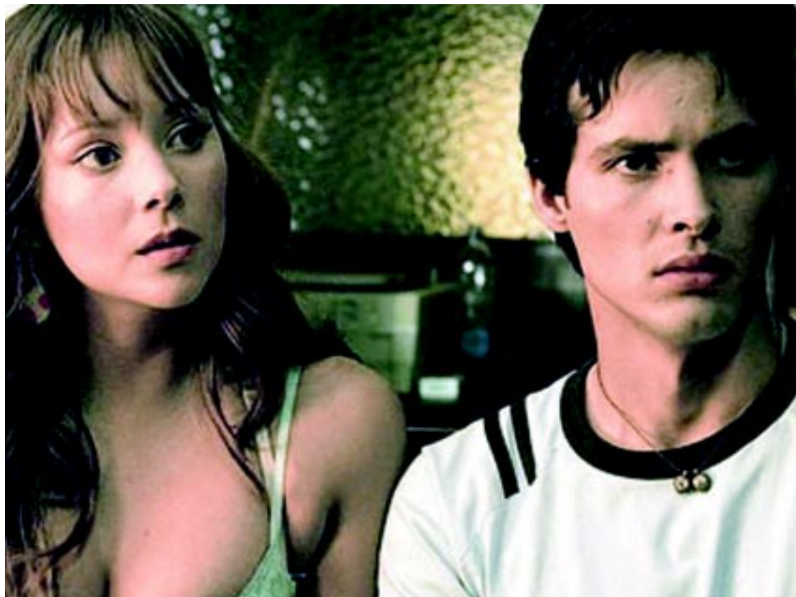
Todos los colombianos de la película, unidos a los boricuas y mexicanos, entre otros, mantuvieron el criterio firme de enfrentar la situación con sacrificio, para poder sobrevivir, con algo de violencia y de enajenación gringa.

Todos los colombianos de la película, unidos a los boricuas y mexicanos, entre otros, mantuvieron el criterio firme de enfrentar la situación con sacrificio, para poder sobrevivir, con algo de violencia y de enajenación gringa. Con actores nuevos y algunos consagrados, aportando su talento, a esta recreación, volcada a retratarnos con ese humor sangrado, como se dice, y ese amor perdido que mantiene el filme con