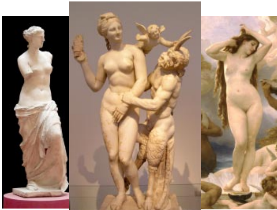
La Venus de Milo, encontrada en la isla del mismo nombre; Afrodita, Pan y Eros (150 a. C.) y El Nacimiento de Venus de W. Adolphe (1879). Muestras del arte clásico griego

al Mar Egeo con el Mar de Mármara), y las aventuras del prudente Ulises , cuando al regresar a su hogar, concluido el sitio de Ilión, (que así también se llamaba Troya ), es desviado de su ruta por los contrarios vientos, son para el hombre medianamente educado de nuestro tiempo episodios tan familiares como los de su propia historia nacional.