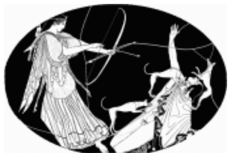
Artemisa y Acteón

Las hazañas de Aquiles y otros guerreros aqueos en el sitio de Troya, (ubicada estratégicamente a la entrada del Estrecho de Helesponto, hoy, de Los Dardanelos, y donde toda embarcación tenía que pagar un tributo, ya que el mencionado estrecho une