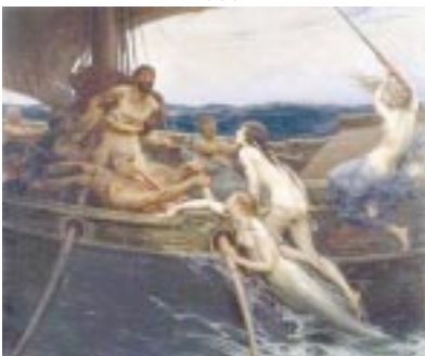
Ulises y las sirenas. Herbert Draper (1909)