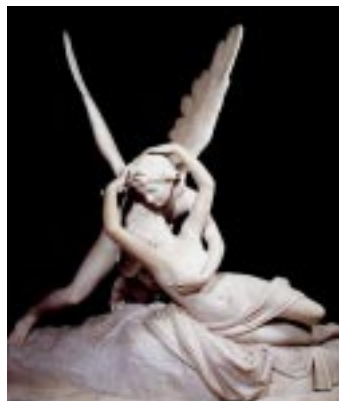
Eros y Psiquis