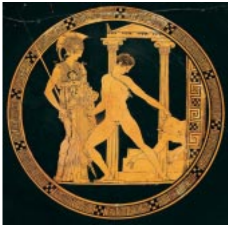
Fondo de copa griega con Atenea, Teseo y Minotauro. Museo Arqueológico Madrid

Erato , o la “ Amorosa ”, inspiradora de la poesía lírica y erótica. Llevaba en sus manos una lira y orlaba sus sienes una corona de mirto y rosas.