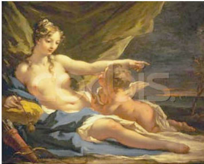
Venus y Cupido. De Pellegrini, Giovanni Antonio (1675-1741)

Homero, como los rapsodas de su época, tiene por oficio exaltar la gloria individual mediante