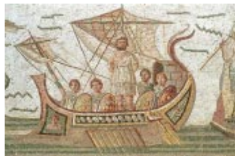
Ulises en busca de Ítaca, sorteando peligros y enemigos.

Cástor y Pólux, Helena (de Troya) y Hércules son algunos de los más clásicos ejemplos, aunque este último, por su corpulencia y fuerza descomunal, así como por su destino, sea el más singular de todos.