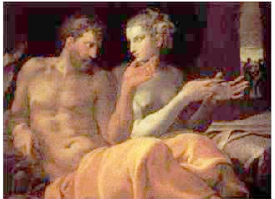
Ulises y Penélope

El “ milagro griego ”, como se le ha llamado, significa el origen de la cultura occidental. Abarcando un área mucho mayor que la Grecia actual, podemos afirmar que la lengua y la literatura de la Grecia Clásica se desarrollaron en el Mar Mediterráneo Oriental, dejando a la humanidad obras tan antiguas que datan probablemente del siglo X a. de C.