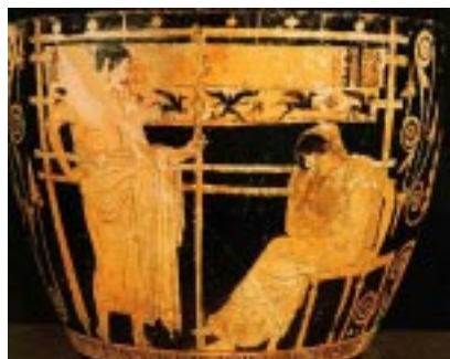
Telamaco y Penélope, vaso griego

Al empezar la tercera batalla , Zeus prohíbe a los dioses intervenir en la lucha y truena en lo alto como augurio favorable a los troyanos. Al anochecer los troyanos son vencedores y pemoctan en el campo en vez de retirarse a la