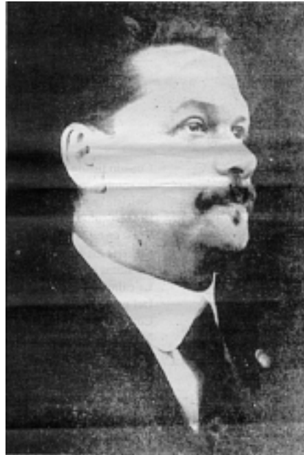
El maestro Francisco Gavidia

Francisco Gavidia ha sido señalado con justicia como el fundador de la literatura salvadoreña.