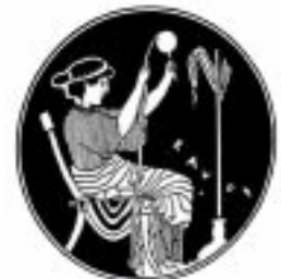
La Tejedora. Penélope