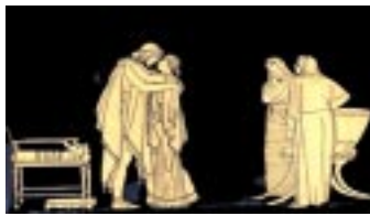
El retorno a casa de Ulises

La espada, luminosa cual la Idea Con que Francisco Morazán sondea Donde su rayo el patriotismo fragua, Para escalar las escarpadas cumbres En que el laurel florece de la gloria Y llevar por la mano a la victoria El furor a las bravas muchedumbres; Las épicas y ardientes aventuras, Con que un día el coloso, Gloria de El Salvador, hijo de Honduras, Padre de Centro América glorioso, Ensoberdecía los ámbitos del Istmo,