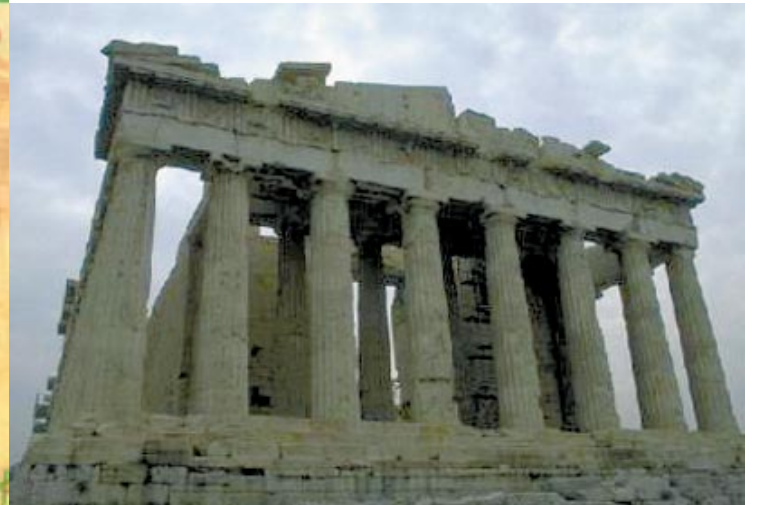
Ruinas de la Antigua Grecia y al centro José Martí, autor de este bello fragmento explicativo de La Ilíada de Homero. Martí se ubica en la portada de la reconocida revista Bohemia.