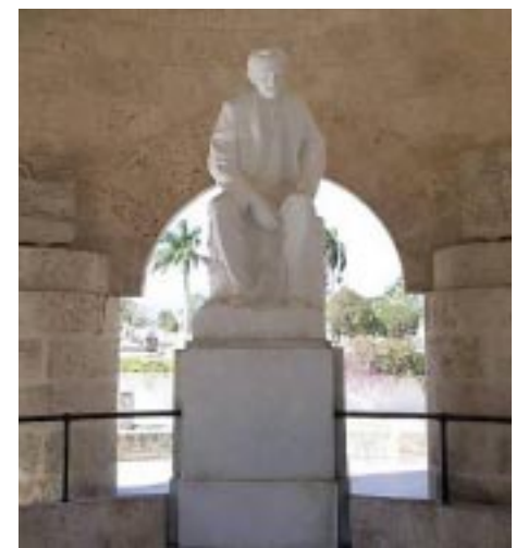
Monumento a Martí en Santiago de Cuba

¡Feliz Cumpleaños Maestro ! página 1. José Martí y Los Cinco páginas 2, 3 y 4.