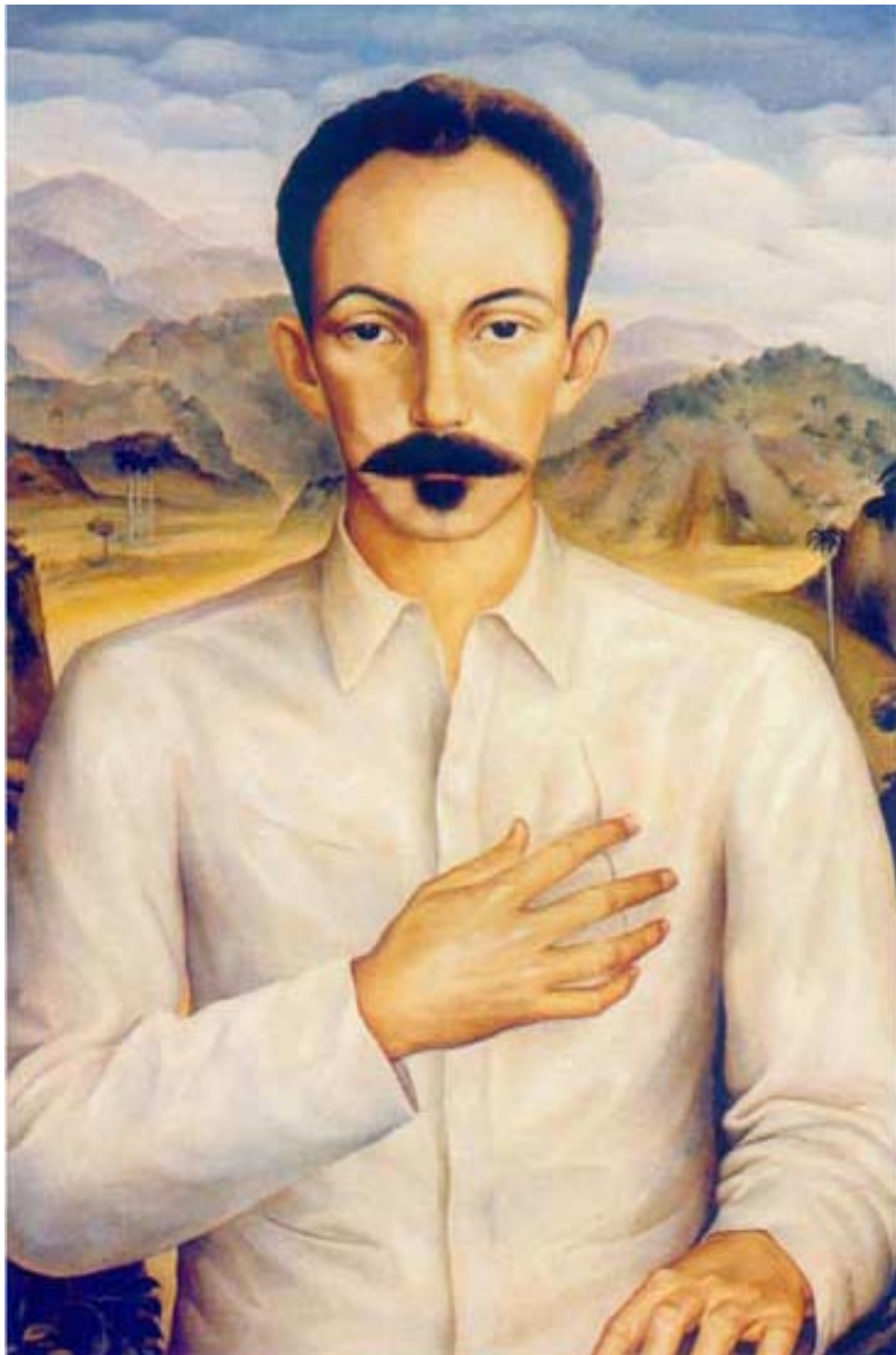
El Apóstol cubano José Martí: insigne patriota, escritor, poeta, periodista y educador de Nuestramérica .