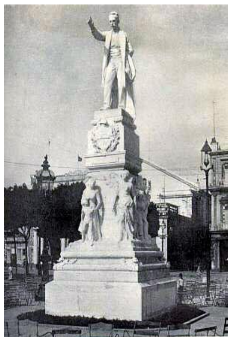
Monumento a José Martí.

“De manera que no tengo ni el derecho a pedir clemencia para mí en un momento como este... quisiera creer que usted entenderá el que yo no tenga razones para el arrepentimiento. Pero siempre sentiré la obligación de pedir justicia para mis compañeros acusados de crímenes que no cometieron y condenados sobre la base de los prejuicios.... Nosotros seguiremos apelando a estos valores y a la vocación por la verdad del pueblo norteamericano,