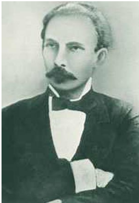
José Martí produjo una abundante obra literaria.

La tercera y última característica que nos interesa destacar es que esa expresión