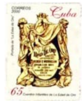
Sello en honor a La Edad de Oro, obra para niños del patriota José Martí.