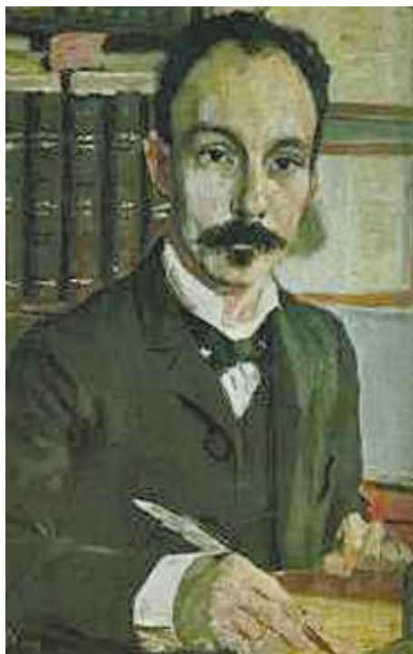
Martí en su faceta de escritor y periodista.