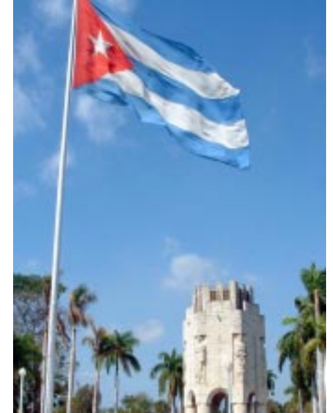
Arriba José Martí en Jamaica y la enseña patria de Cuba.