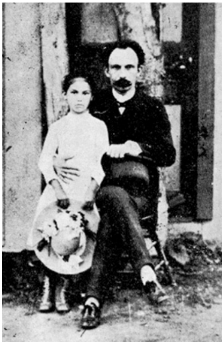
El apóstol cubano José Martí y su hija.