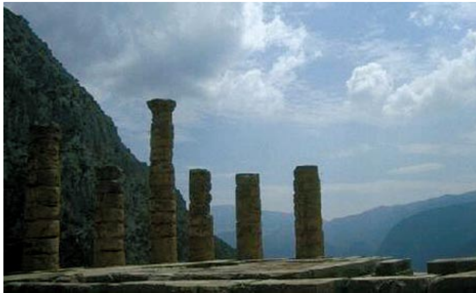
Monumentos de la antigüedad helénica o griega, dispuestos en el área mediterránea de Europa..

En la Ilíada no se cuenta toda la guerra de treinta años de Grecia contra Ilión, que era como le decían entonces a Troya; sino lo que pasó en la guerra cuando los griegos estaban todavía en la llanura asaltando a la ciudad amurallada, y se pelearon por celos los dos griegos famosos, Agamenón y Aquiles. A Agamenón le llamaban el Rey de los Hombres, y era como un rey mayor, que tenía más mando y poder que todos los demás que vinieron de Grecia a pelear contra Troya, cuando el hijo del rey troyano, del viejo Príamo, le robó la mujer a Menelao, que estaba de rey en uno de los pueblos de Grecia, y era hermano de Agamenón. Aquiles era el más valiente de todos los reyes griegos, y hombre amable y culto, que cantaba en la lira de las historias de los héroes, y se hacía querer de las mismas esclavas que le tocaban de botín cuando se repartían los prisioneros después de sus victorias. Por una prisionera fue la disputa de los reyes, porque Agamenón se resistía a devolver al sacerdote troyano Crises su hija Criseida, como decía el sacerdote griego Calcas que