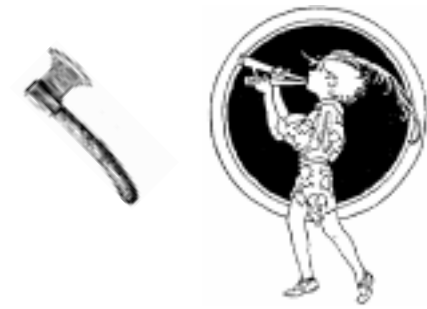
Meñique y el hacha mágica

Sin embargo, en sus oídos zumbaban las palabras de Meñique recordándole su compromiso.