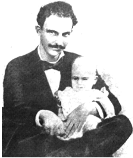
Ismaelillo, el hijo de José Martí