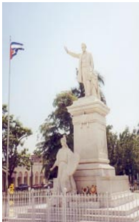
Monumento a Martí, a un lado ondea la bandera cubana.

Martí es detenido bajo el cargo de traición y recluido en la Cárcel Nacional. Después