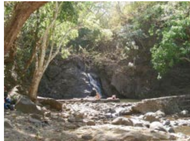
Poza El Saltón, Cinquera

sin embargo yo he de construir de ti un monumento a la vida no una torre ni un adefesio para el tálamo nupcial ni una [vieja casona que sea refugio [de fantasmas murciélagos y telas de araña serás el poema la sinfonía el testamento que nunca escribiré porque cuando descubras que yo he muerto comenzarás a vivir y la realidad también comenzará a entretejer su celada a urdir su esperanza.