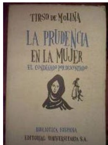
Portada de libro de Tirso de Molina

Es un teatro de temas cortesanos para un público de