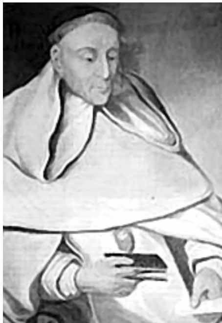
Tirso de Molina

“Don Juan Tenorio engaña en Nápoles a Isabela, y huye y embarca Para España. Llega como naufrago a Tarragona, donde lo recoge una pescadora, Tisbea, a la cual también burla y abandona después. El rey decide casar a Don Juan con Doña Ana, hija del comendador Don Gonzalo de Ulloa, pero enterado éste de la vida disoluta de don Juan, desiste del casamiento y la promete a Octavio. En una entrevista nocturna que han de tener Doña Ana y Octavio, Don Juan sustituye, secretamente a éste. Descubierta el engaño por Doña Ana profiere fuertes gritos. El padre acude y es muerto por Don Juan. El seductor prosigue sus locas aventuras y, huyendo de la justicia, se refugia en una iglesia, en la que se halla el sepulcro del comendador, a cuya estatua convida cínicamente a cenar. Esta acepta y, con gran sorpresa de Don Juan, se aparece en el lugar donde la cena se realiza, y lo invita a su vez a concurrir al día siguiente a la capilla. Así lo hace Don Juan, pero la estatua lo toma de la mano y lo mata, hundiéndose ambos en el sepulcro, condenándose así Tenorio por sus crueldades y atropellos”.