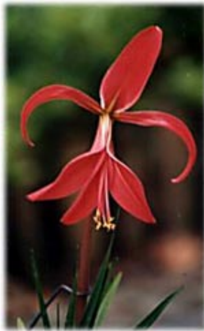
FLOR DE LIS