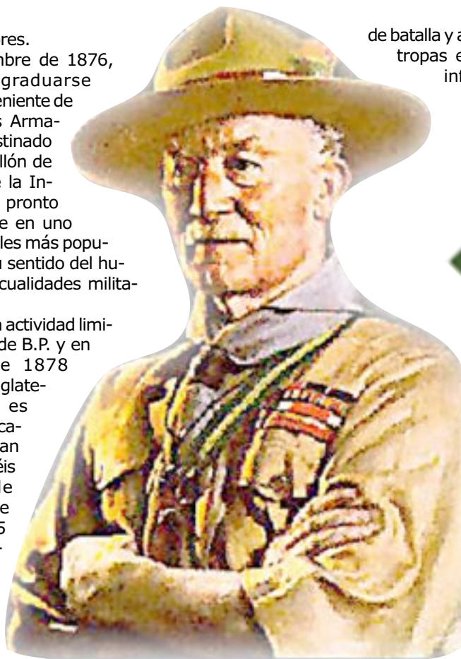
Sir Lord Robert Baden-Powell

fen- dió Mafeking, resistiendo el sitio contra fuerzas mucho más numerosas, hasta que le llegaron re- fuerzos el 18 de mayo de 1900. Gran Bre- taña había permaneci- do sin noti- cias de Baden-Powell durante estos largos meses; cuando finalmente recibió la noticia de que se había logrado el objetivo buscado, B. P. fue elevado al rango de Mayor General y convertido en el héroe de sus conciudadanos.