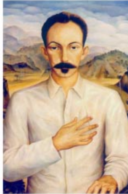
El patriota cubano José Martí

¡Celos del cielo Llorar le hacen, Que a todos cubre Con sus celajes! Las alas níveas Cierra, y ampárase De ellas el rostro Inconsolable: Y en el confuso Mundo fragante Que en la profunda Sombra se abre, Donde en solemne Silencio nacen Flores eternas Y colosales, Y sobre el dorso De aves gigantes Despiertan besos Inacabables, Risueño y vivo Surge otro ángel!