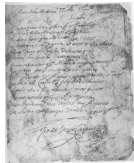
Manuscrito de Lope de Vega

Ahora, hablaremos un poco sobre otro de los grandes escritores del Barroco español, Lope de Vega . Es el autor más completo de su época; se dice que escribió 1800 comedias, más 400 autos sacramentales y numerosos poemas entre infinidad de textos. Practicó con maestría los tres principales géneros literarios: narrativo, lírico y dramático; motivo por el cual fue llamado por sus