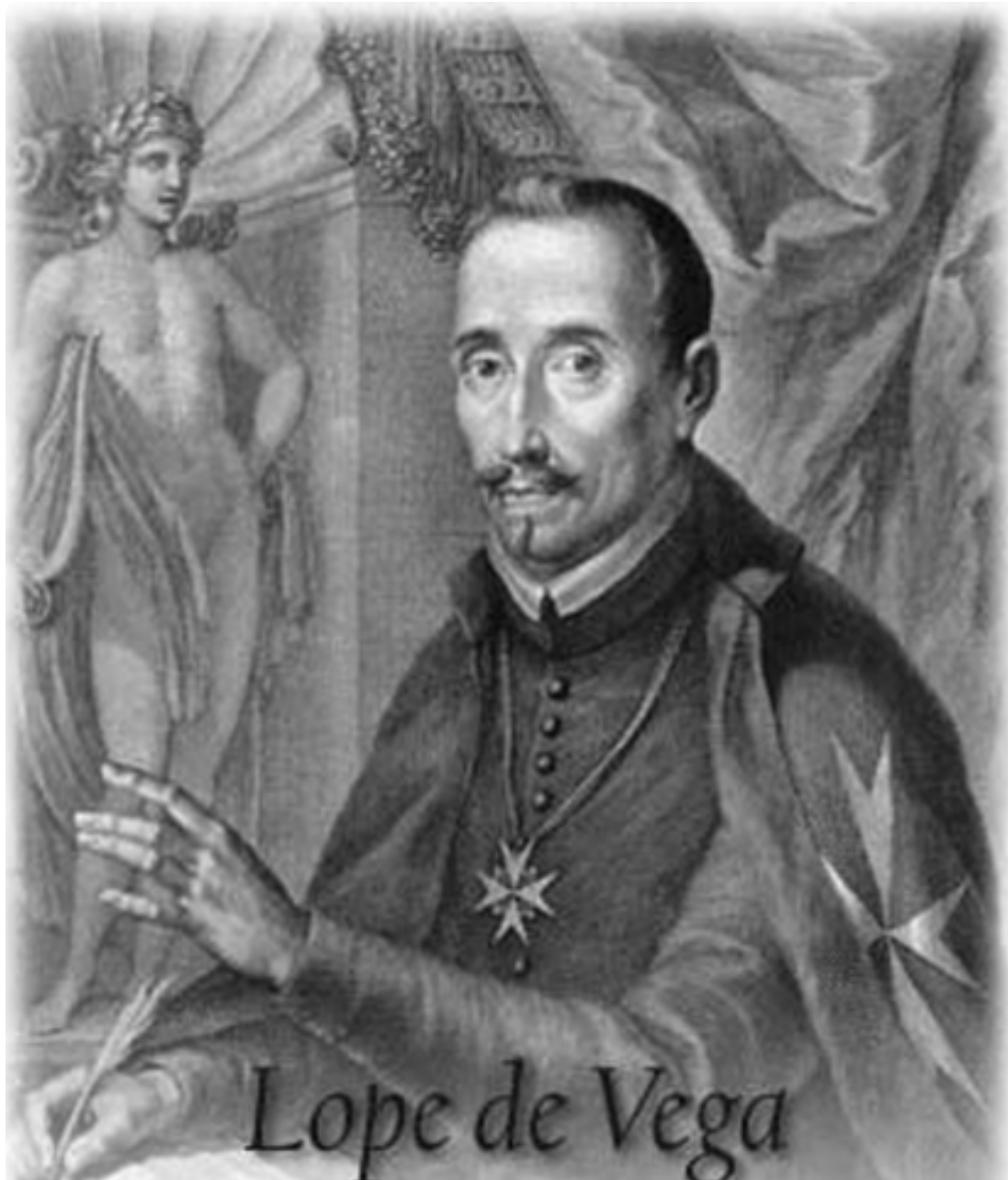
El escritor español Lope de Vega