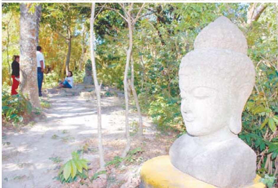
Entrada a la Plaza Buda, espacio para la meditación en Alma de Montaña.