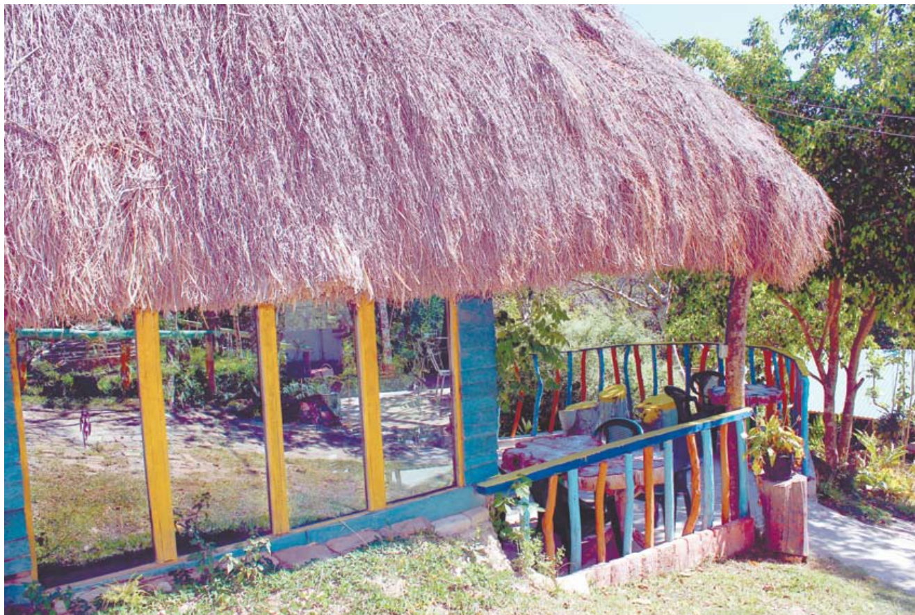
Alma de Montaña es un lugar que ofrece espacios diversos de esparcimiento.