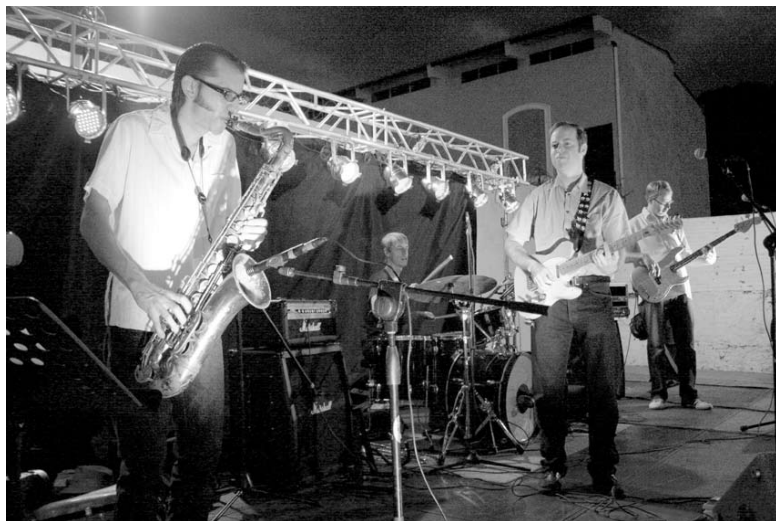
El cuarteto de Los Grandsons deleitaron con éxitos como: “Party with the Rich”,