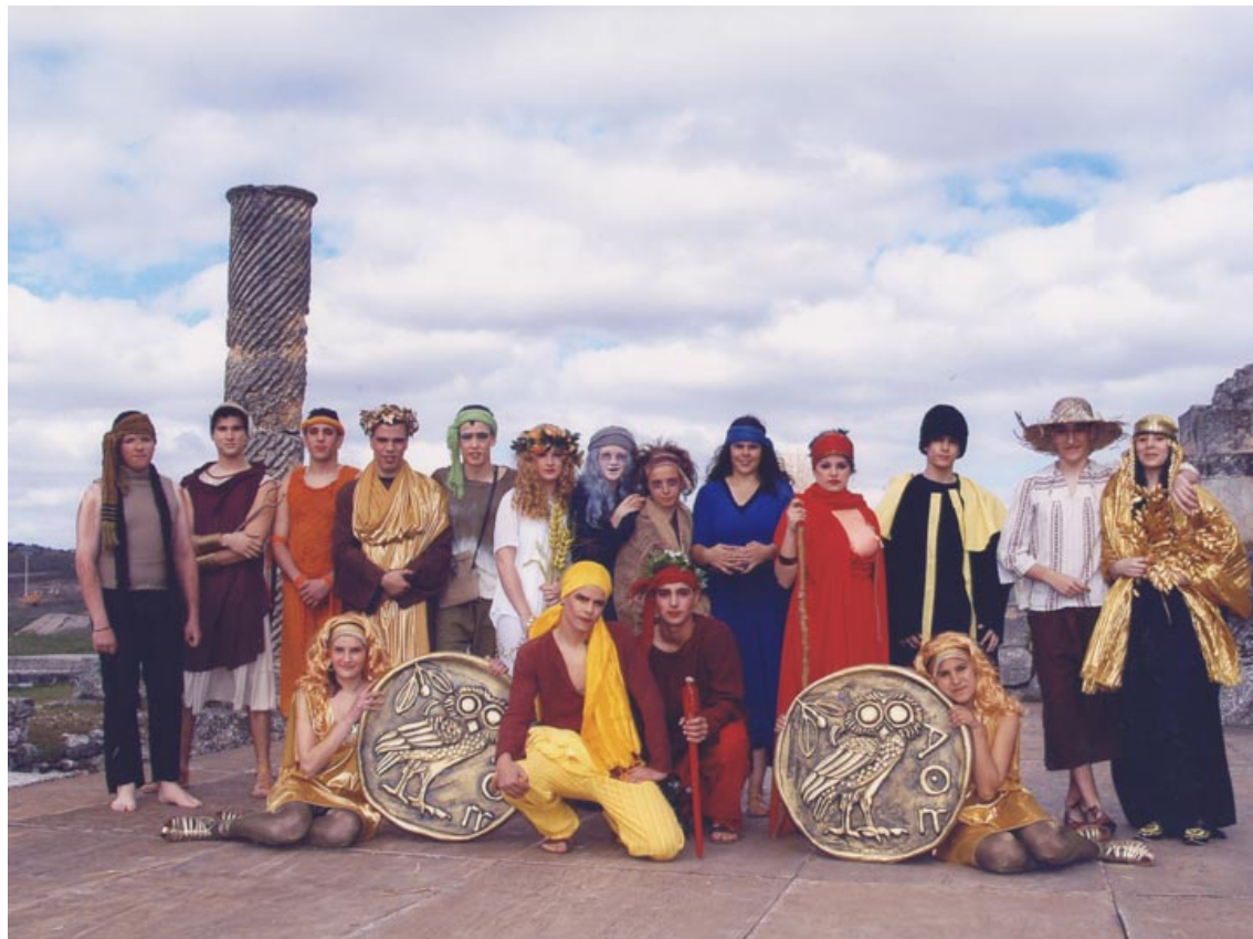
Grupo francés que representó obras de Aristófanes.

El coro, los actores, el corego, y el poeta eran presentados al público en una especie de ceremonia preliminar llamada proagôn. Uno de los privilegios de los que goza-