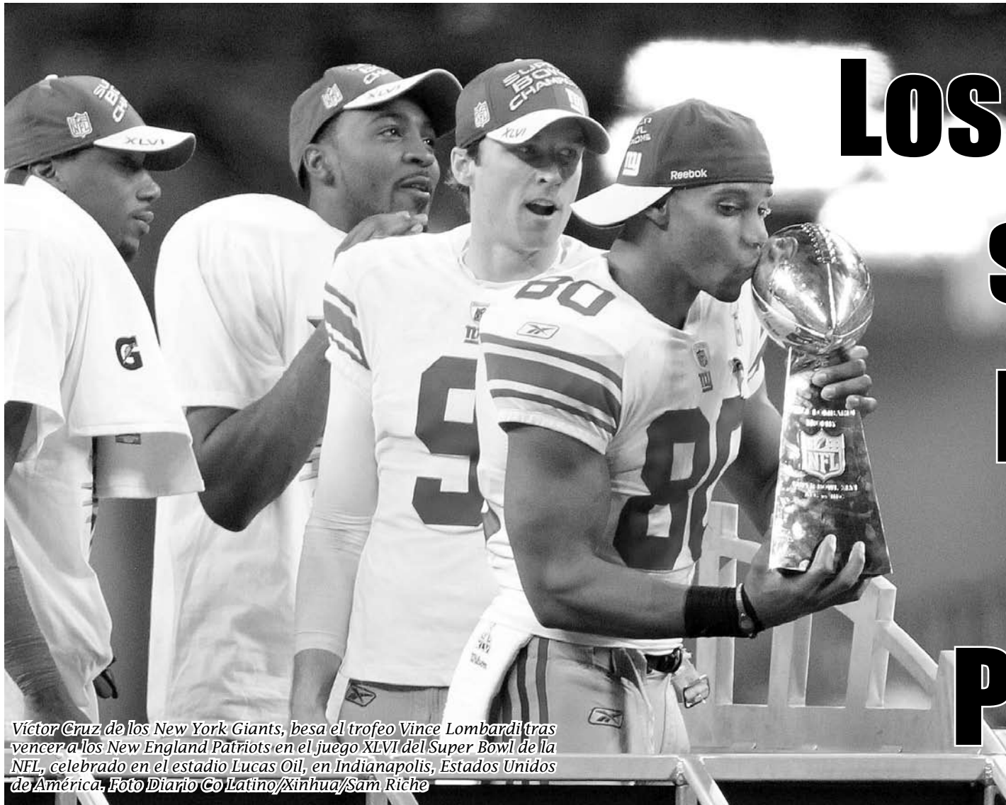
Víctor Cruz de los New York Giants, besa el trofeo Vince Lombardi tras vencer a los New England Patriots en el juego XLVI del Super Bowl de la NFL, celebrado en el estadio Lucas Oil, en Indianápolis, Estados Unidos de América.