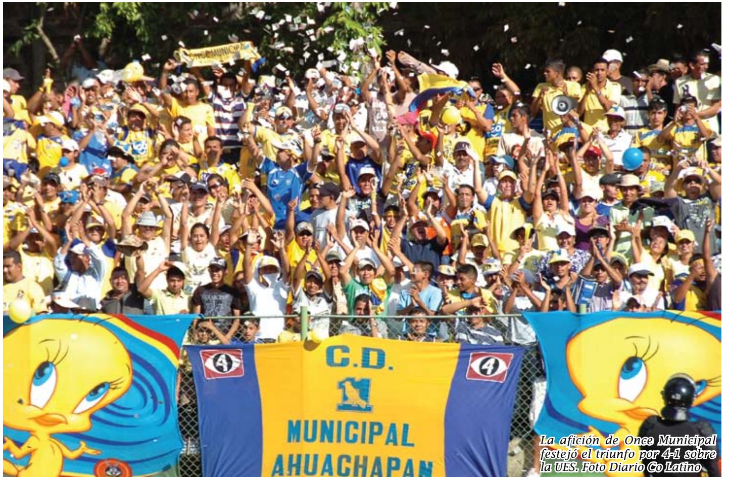
La afición de Once Municipal festejó el triunfo por 4-1 sobre la UES.

El canario mantiene record perfecto actuando en casa y de cuatro juegos disputados ha logrado 12 puntos, que lo confirman como un equipo competitivo.