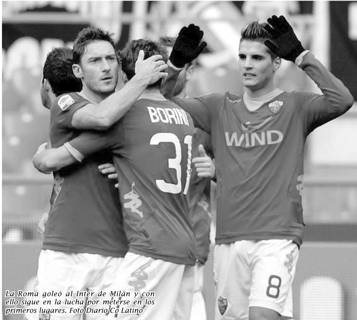
La Roma goleó al Inter de Milán y con ello sigue en la lucha por meterse en los primeros lugares.

En Turín, la Juventus llevó el peso, presionó y dispuso de incontables ocasiones de gol en su estadio, donde hoy sumó su cuarto empate.