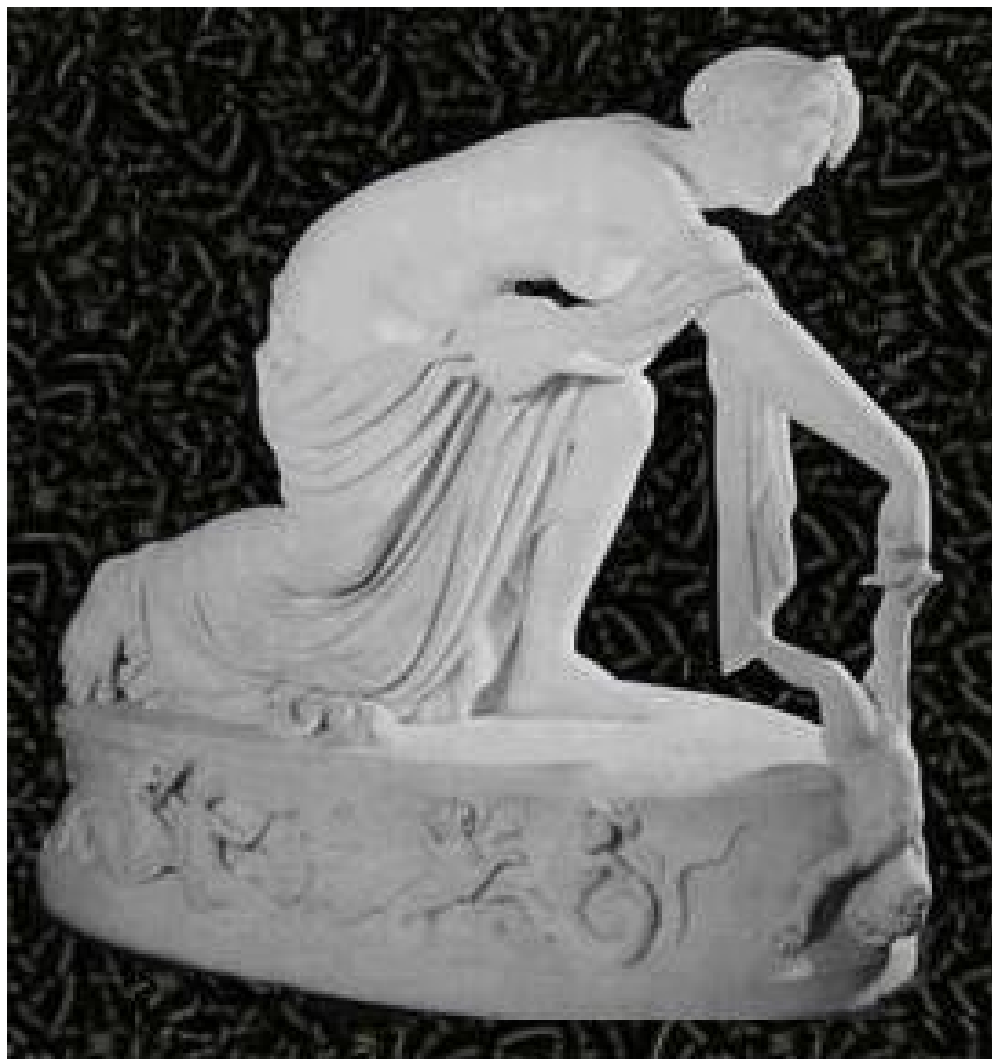
Tetis sumerge a su hijo Aquiles para hacerlo invencible.