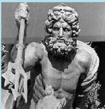
Neptuno o Poseidón

Titanis, considerada por algunos madre de Temis.