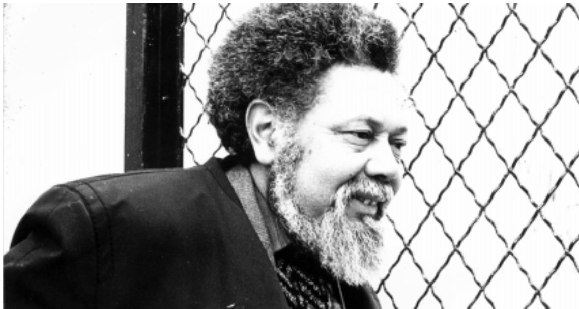
«Hay también culebras como la zumba-dora, animal prodigioso; la masa-cuata o culebra de las sementeras, la bejuquillo, víbora que cambia de color según sea el tiempo...»

ban mujeres, hombres barbones, y en los bancos de los parques ancianos soñaban. Este paisaje lo animaba a caminar, a decir: ¡la primavera! No se dio cuenta, por estar hundido en sus meditaciones que llegó al río. Al fondo, el sol como una naranja cubría el mundo, su cabeza, su traje, sus zapatos. Agachó la cabeza sobre el río. Barcazas partían las aguas y bamboleaban como delfines en los bancos de espuma. Turistas tomaban fotografías de Notre Dame . Continuó caminando sin prisa, y cuando desembocó en el Bulevar St. Michel , ya la noche extendía su lienzo. En el parque colgante, muchachas cantaban bajo los últimos resplandores. El paisaje lo matizaban las flores, los grandes árboles, y los perros que corrían entre los arriates. En la arena jugaban los niños. Otros colocaban barcos de papel en el agua de las fuentes. Brotaban estrellas en el cielo de Babilonia.