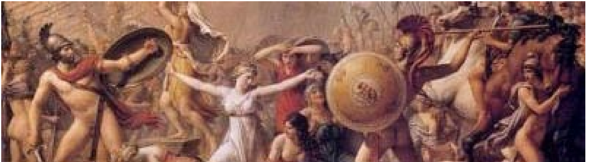
ESTAMPA DE LA GUERRA DE TROYA

La Ilíada comienza con el gran enfado de Aquiles, porque Agamenón, rey de los aqueos y jefe de la expedición griega contra Troya, se ha empeñado en quedarse con su esclava favorita, Briseida. En señal de protesta, Aquiles, con su ejército de mirmidones, decide mantenerse al margen de la batalla, en su campamento, junto a las naves griegas atracadas en las playas del Estrecho de los Dardanelos, cercano a Troya. (El Estrecho de los Dardanelos, Helesponto, es la franja marina que une el mar Egeo con el mar de Mármara; así como el mar de Mármara se comunica con el mar Negro, por el estrecho del Bósforo).