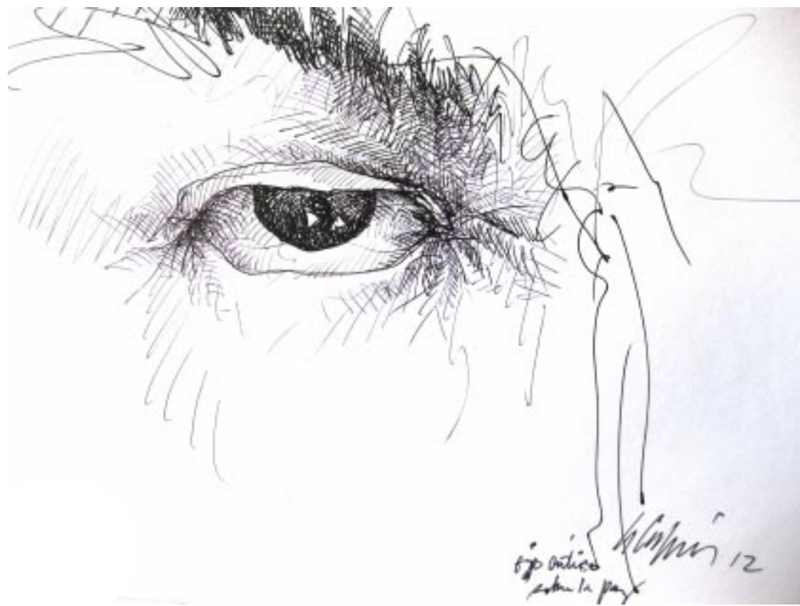
ILUSTRACIÓN SUPLEMENTO TRESMIL/ AUGUSTO CRESPIÑ, OJO CRÍTICO DE LA REALIDAD, TINTA, 2012.

Los Acuerdos de Paz fueron un trato para detener la guerra, la bélica, esa última consecuencia de las diferencias, pero lamentablemente la guerra se lleva en el corazón y en la mente de la gente. Muchos no pudieron reconciliarse. Las ideas y