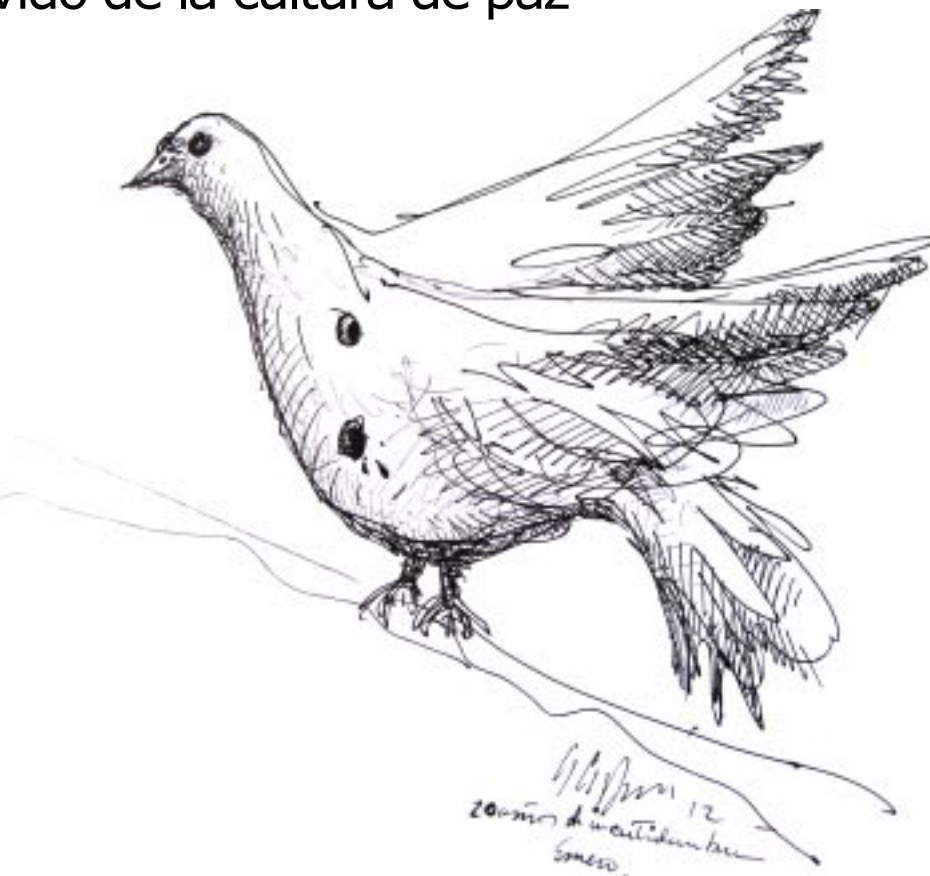
ILUSTRACIÓN SUPLEMENTO TRESMIL/ AUGUSTO CRESPIÓN, INCERTIDUMBRE, TINTA, 2012.

La cuestión es que la paz tan anhelada, el fin de la guerra, no cuaja en una paz social permanente y estable. Este malestar crea indiferencia ya que la esperanza inicial se marchita y la sustituye el desgano. La violencia social arrecia, como Ud. lo sabe. Se vive a diario en las extorsiones, los crímenes, el narcotráfico, el desempleo atroz. La emigración al norte sigue siendo una alternativa tentadora. Mientras estos problemas sociales no los reemplace un proyecto efectivo de educación técnica, artesanal, artística, etc. que desemboque en el empleo, la esperanza seguirá trunca. La celebración es momentánea, una algarabía fugaz, lo importante es el resultado a largo plazo. Y en este disyuntiva hay que pre-