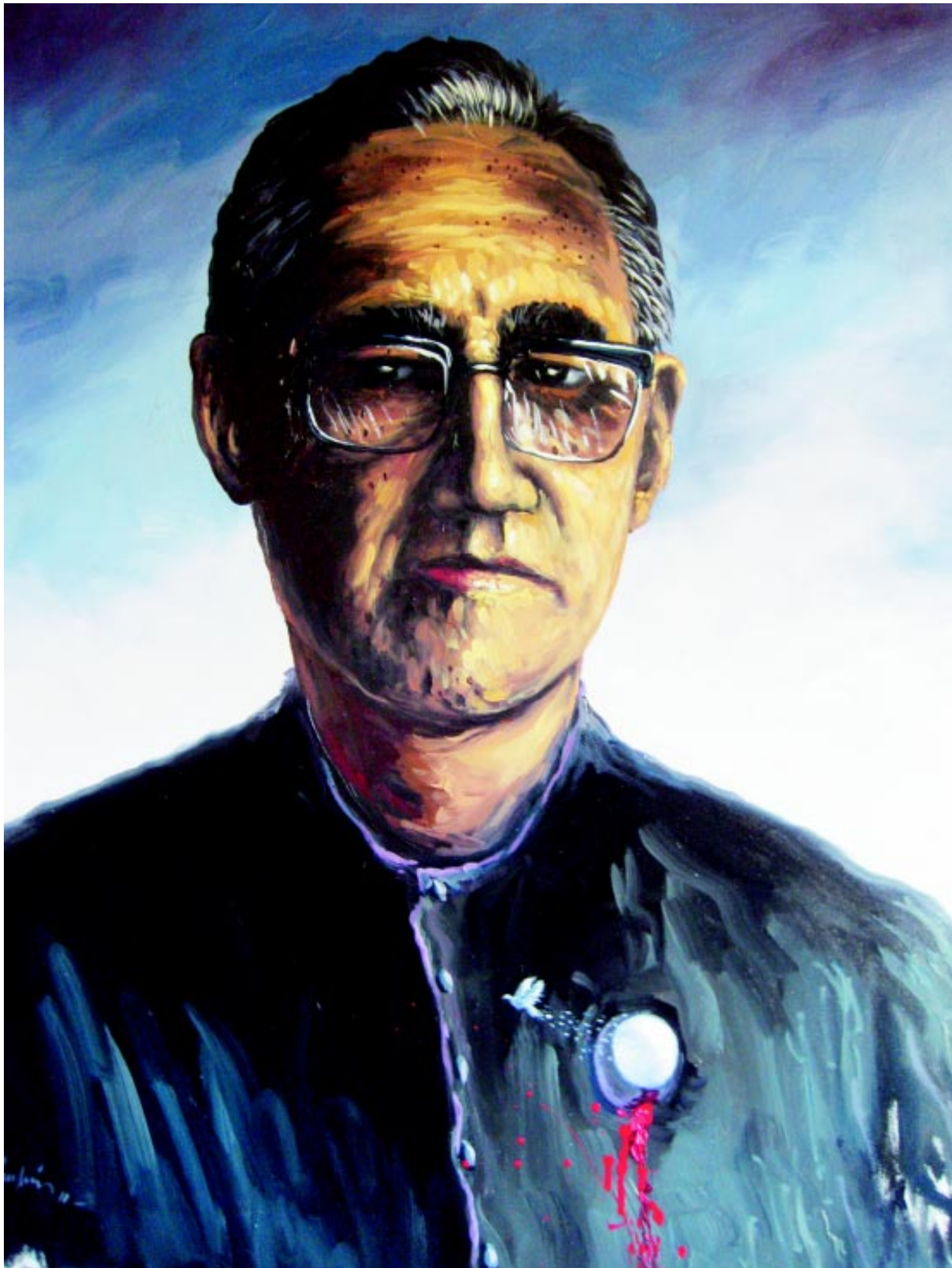
PINTURA: AUGUSTO CRESPIÓN/ CONVIVENCIA POLÍTICA.

Augusto Crespín, pintor salvadoreño, nos muestra en esta edición su percepción de la paz