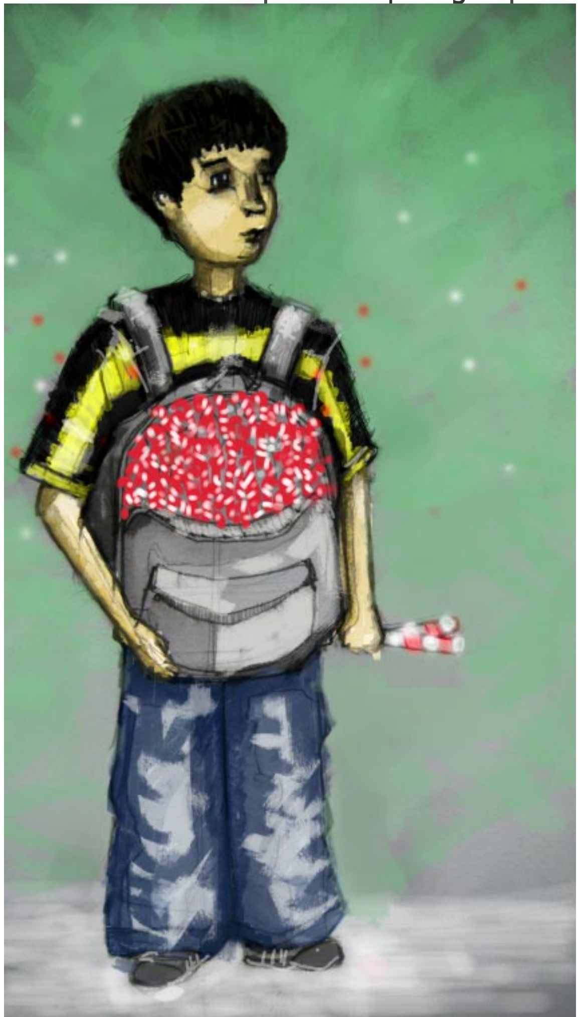
El vendedor de Navidad por Elvis Avid Guzmán.

Usamos el nombre de la navidad, pero no la celebramos. Un fenómeno cultural muere y se convierte en otro cuando la sociedad lo considera y lo celebra como algo diferente de lo que era. La navidad poco a poco está muriendo, y lo que