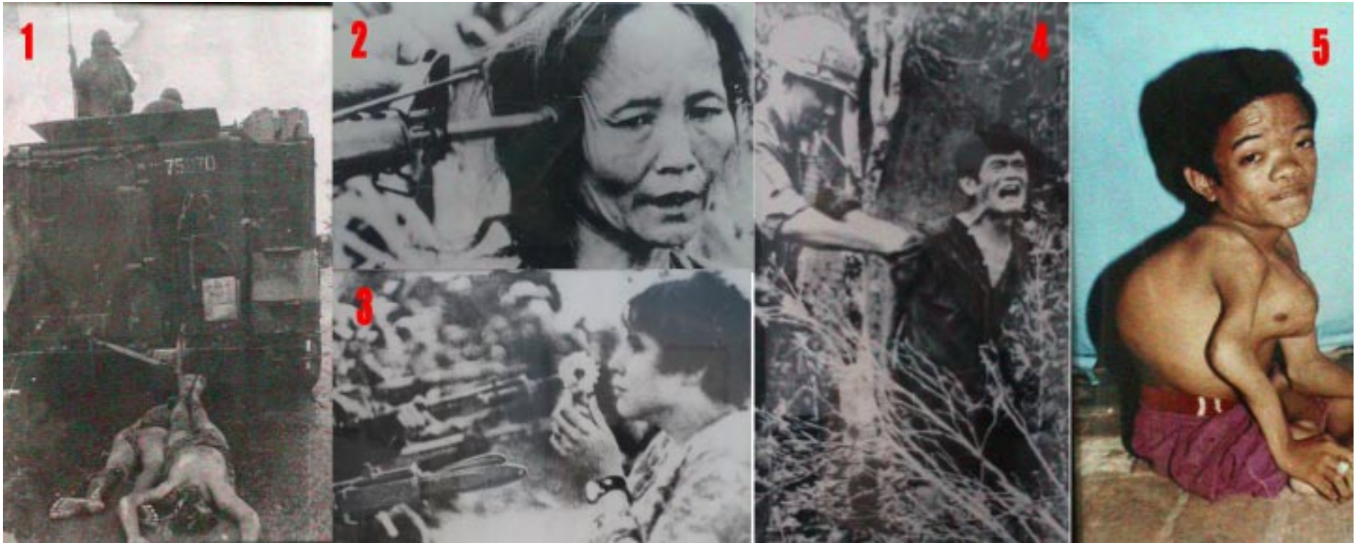
1. Soldados norteamericanos arrastran los cadáveres de dos vietnamitas. 2. El M-16: invento norteamericano especialmente fabricado para sangrar a las tropas rebeldes. 3. Manifestante contra la guerra de Vietnam en Whashington, USA. 4. Soldado estadounidense maltratando a un prisionero de guerra. 5. Efectos genéticos del gas naranja.

Es escritor, poeta. Académico en una universidad jesuita de EE.UU.