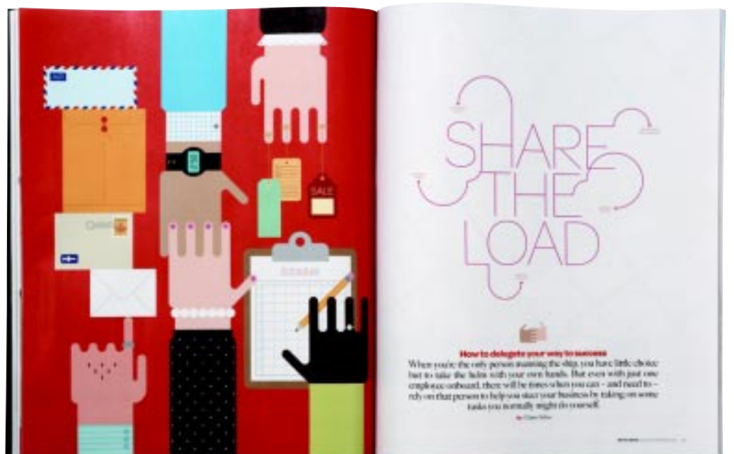
3) Plata: Revista "Retail News"