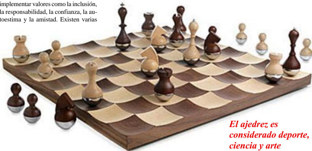
El ajedrez es considerado deporte, ciencia y arte

* El proyecto en mención se denominó "DEPORTE PARA LA PAZ Y EL DESARROLLO" auspiciado por el Programa de las Naciones Unidas para el Desarrollo (PNUD) y coordinado por el Comité Olímpico de El Salvador (COES) en los municipios de Lourdes Colon y Sacacoyo.