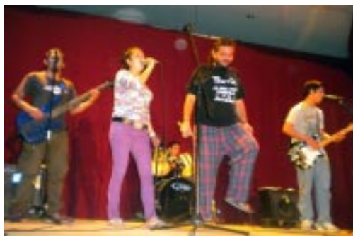
El grupo TNT apoya las distintas áreas artísticas.

La actividad tiene el financiamiento de TDH-Alemania, ACCD-Huacal de Barcelona, Secretaría de Cultura de la Presidencia, TNT y Centro Cultural Jon Cortina. Además hay colaboración de los pobladores San Antonio Los Ranchos en diferentes comisiones para apoyar los festivales, asegura.