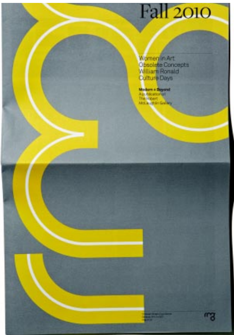
2) Plata: Identidad corporativa de RMG -- la imagen es de la portada de la publicación de la Galería de Arte de Oshawa, Robert McLaughlin Gallery (RMG), que incluye el logo de la galería