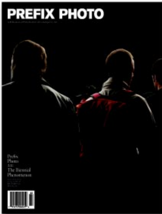
1) Oro: Revista Prefix Photo 22