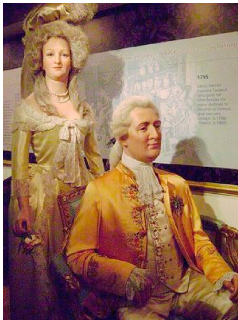
Luis XVI y María Antonieta. Ambos fueron guillotinos como consecuencia de los actos viles de la monarquía y sobre todo de Luis XV.

La Revolución Francesa fue el cambio político más importante que se produjo en Europa, a fines del siglo XVIII. No fue sólo importante para Francia, sino que sirvió de ejemplo para otros países, en donde se desataron conflictos sociales similares, en contra de un régimen anacrónico y opresor, como era la monarquía. Esta revolución significó el triunfo de un pueblo pobre, oprimido y cansado de las injusticias, sobre