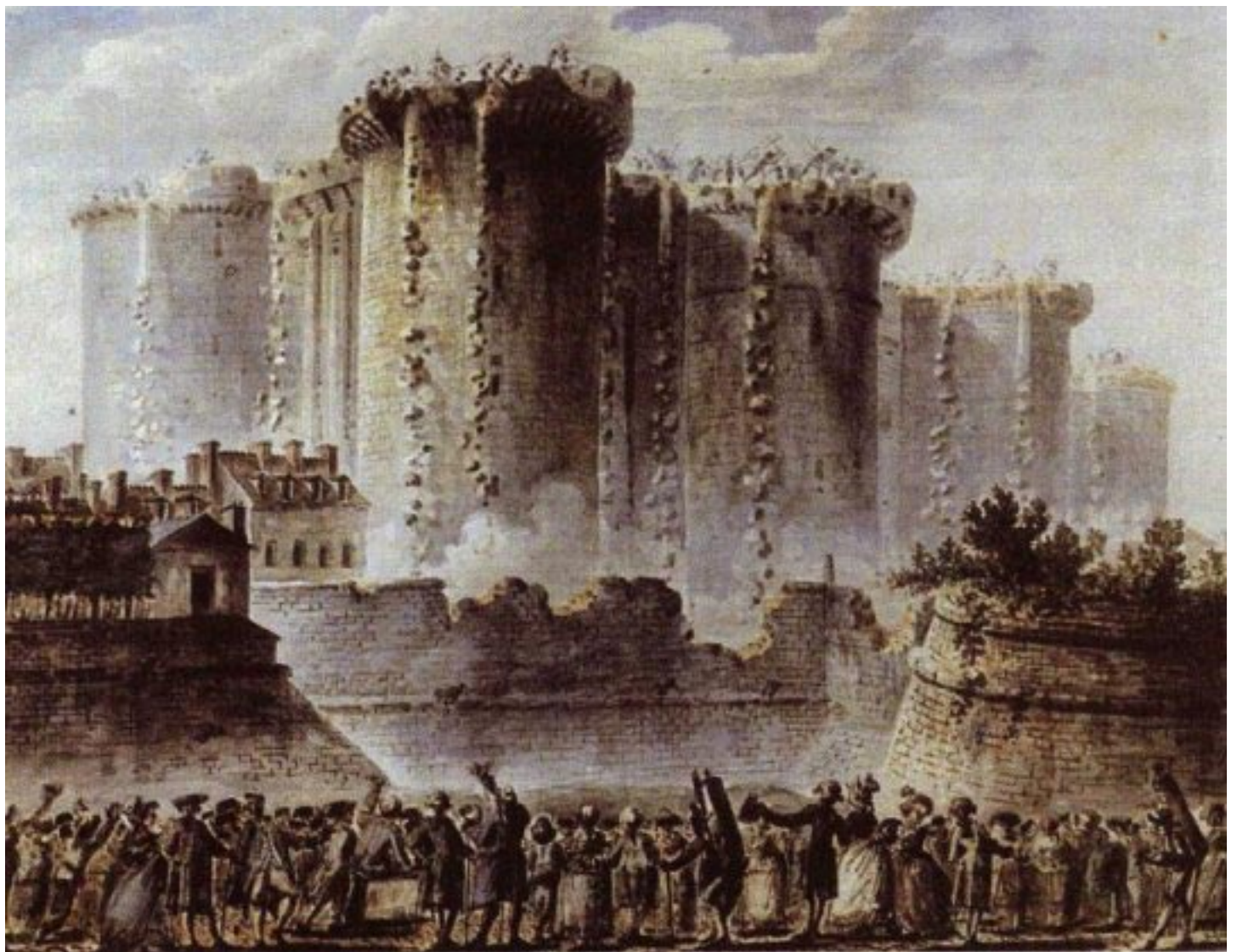
EL PUEBLO OBSERVA LA TOMA DE LA BASTILLA

Robespierre: Con Robespierre al frente, se estableció un gobierno revolucionario, el Comité de Salvación Pública, que suspendió algunas garantías constitucionales, mientras la situación de guerra pusiera en peligro la Revolución, y se utiliza el Terror, un estado de excepción, para perseguir, detener y, en su caso, guillotinar a los sospechosos de actividades contrarrevolucionarias. Ante la guerra y la crisis económica se tomaron toda una serie de medidas para favorecer a las clases populares y que fueron signo del nuevo carácter social de la República.