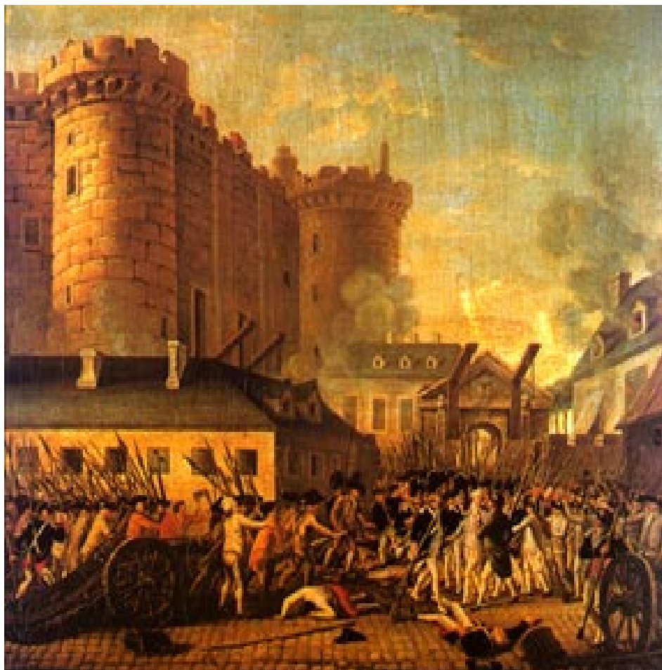
La toma de la Bastilla.

Napoleón Bonaparte en 1799 se apoderó del gobierno se Francia, y se coronó como Primer Cónsul, concentrando cada vez más poder, hasta llegar a emperador en 1804.