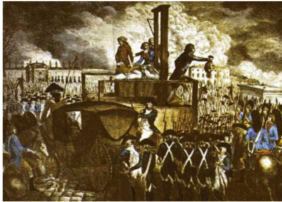
Los pintores de la época retrataron los ajusticiamientos.

Cuando se reunieron en los Estados Generales (1789), la situación de Francia estaba sumamente comprometida, ya que el pueblo no soportaba más tan penosa vida, y existía un gran descontento social. Como se dijo, las clases sociales existentes en ese momento eran: la nobleza, el clero y la burguesía, pero al contar los votos de la nobleza y del clero, que pertenecían a un estamento privilegiado, superaban en número a la burguesía, y por lo tanto siempre