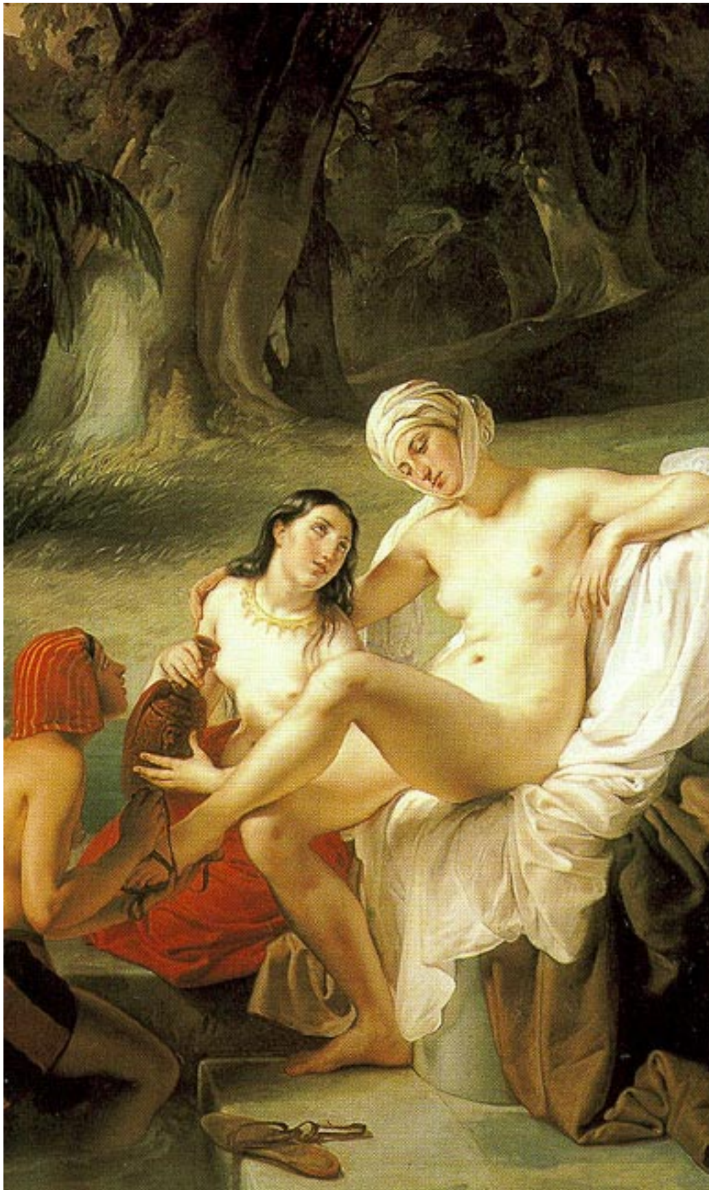
En Alemania el romanticismo se vio reflejado en sus artes.

representación del mundo interior en su totalidad. El poeta es alma y universo. Este egocentrismo romántico tiene sus raíces en la filosofía kantiana y en el idealismo trascendental. Kant llevó el centro de gravedad de la filosofía hacia el interior del propio hombre y valoró el sentimiento para el acto del conocer. Y Schelling, con su filosofía de la naturaleza dio salida a la circularidad destructora de Fichte, pues el mundo entero se le acababa convirtiendo en un espejo que eternamente le presentaba al yo su propia soledad. Schelling liberaba al hombre de encontrarse a sí mismo y sólo a sí mismo en todas partes. Admite la existencia de un mundo exterior opuesto al mundo interior (Yo). La intuición realiza la síntesis entre el Uno (“yo”) y el Todo (la naturaleza). El Yo, el Uno se acerca a ese mundo externo para dialogar con él, coexistir con él y reconciliarse con él. El sujeto cree en una visión de algo que está