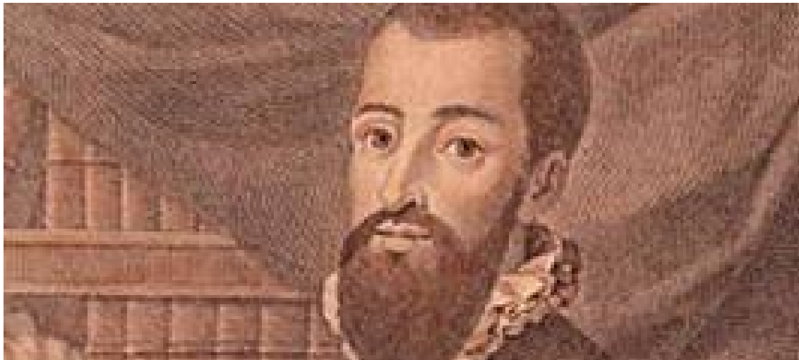
Don Luis de Góngora

mas no de veros ya para valerme, si no es morir, ningún remedio hallo, y si éste lo es, tampoco podré habello.