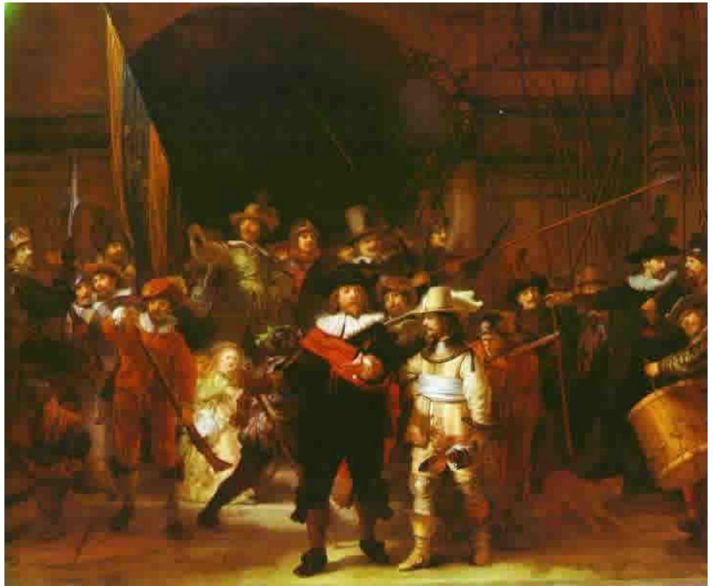
La ronda nocturna no sólo muestra el uso de los oscuros sino una expresión del romanticismo. Su autor fue Rembrandt.