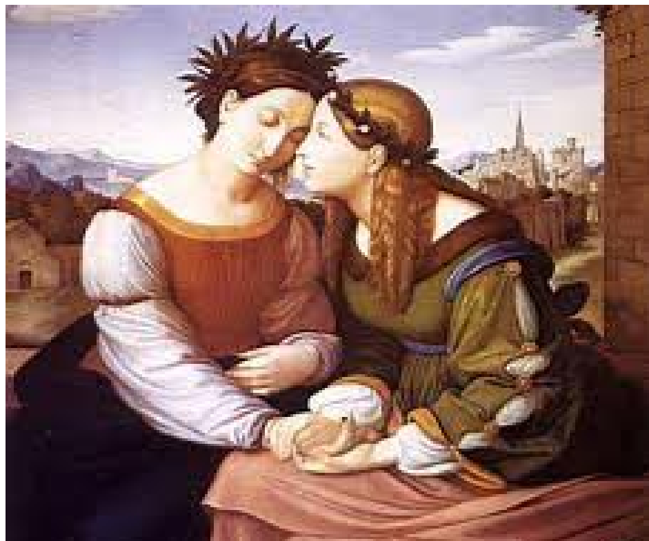
En Alemania el romanticismo se vio reflejado en sus artes.

Giacomo Leopardi fue el mayor exponente del romanticismo italiano, quien muestra su pesimismo en sus obras: El infinito y a Italia