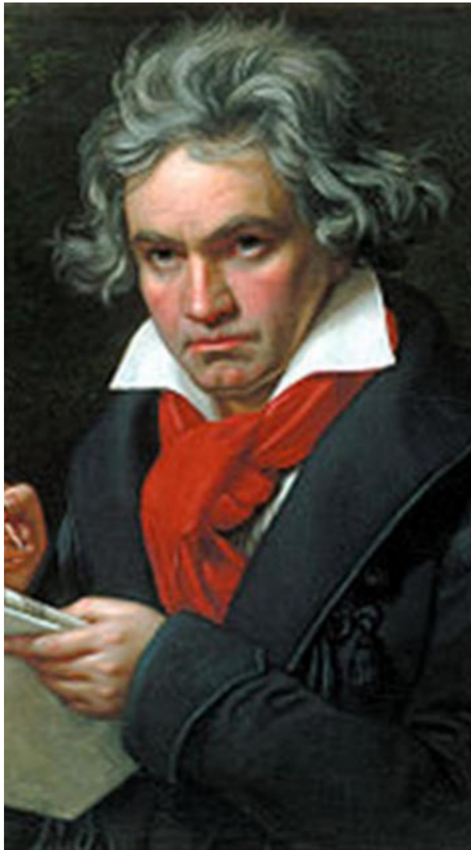
Beethoven fue uno de los grandes representantes de la música romántica junto a Franz Schubert.

De forma diferente a la Ilustración dieciochesca, que había destacado en los géneros didácticos, el Romanticismo sobresalió sobre todo en los géneros lírico