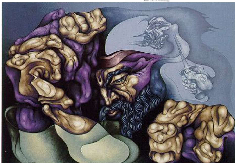
Martín Fierro visto por Carpani.

Fierro esperaba alguna ocasión en que entraran los indios y así poder hacerse el salvaje y volverse a su rancho.- Una noche y borracho no reconoció a Martín Fierro y le disparó, pero no lo hirió.- El ruido despertó a los oficiales y atraparon a Fierro, el Mayor dio la orden de que lo ataran de las manos y los pies.- Así fue que lo estaquearon, Fierro maldijo al borracho.-