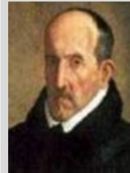
LUIS DE GÓNGORA: (1561-1627)

—Muros de abeto, almenas de diamante—, Bates los montes que de nieve armados Gigantes de cristal los teme el cielo, Donde el cuerno, del eco repetido, Fieras te expone, que — al teñido suelo, Muertas, pidiendo términos disformes— Espumoso coral le dan al Tormes! Arrima a un frexno el frexno, cuyo acero, Sangre sudando, en tiempo hará breve Purpurear la nieve; Y, en cuanto da el solícito montero, Al duro roble, al pino levantado —Émulos vividores de las peñas— Las formidables señas Del oso que aun besaba, atravesado, La asta de tu luciente jabalina, —O lo sagrado supla de la encina Lo Augusto del dosel, o de la fuente La alta cenefa, lo majestuoso Del sitiál a tu Deidad debido—, ¡O Duque esclarecido! Templa en sus ondas tu fatiga ardiente, Y, entregados tus miembros al reposo Sobre el de grama césped, no desnudo, Déjate un rato hallar del pie acertado Que sus errantes pasos ha votado A la real cadena de tu escudo. Honre suave, generoso nudo, Libertad, de Fortuna perseguida; Que, a tu piedad Euterpe agradecida, Su canoro dará dulce instrumento, Cuando la Fama no su trompa al viento.